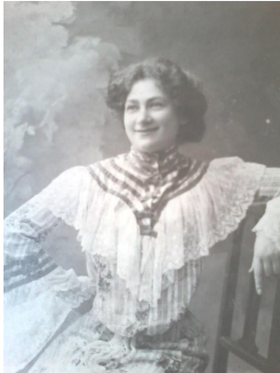
Ábrányiné Várnay Róza