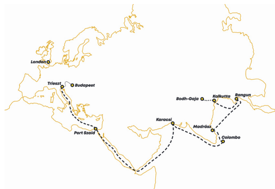
5. A fogadalmi sztúpák Budapestre szállításának útvonala. Készítette: Pataki Gábor

zös szállította Bombay, Áden, Port Szaíd érintésével Triesztbe (5. kép). 30 1890. november 13-án tették őket hajóra, és a rákövetkező év február 15-én jelentették be az Akadémián az „egész ép állapotban” lévő szobrok megérkezését. 31