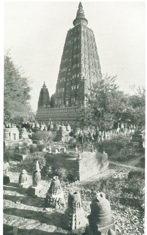
210. Bodhgajai templom („Mahābodhi”); as restored.

Bodh-Gaja mint szent hely maradt meg a (tibeti, ceyloni) buddhisták számára az évszázadok alatt; a 18. század vége felé pedig az angol gyarmati uralmat fenntartó, az indiai archeológia iránt érdeklődő katonatisztek is felfedezték. 13 Az első, merőben szakszerűtlen ásatást 1847-ben Markham Kittoe kapitány végezte: a kőkortól egy részét és szobrokat ásott ki, és amit tudott, magával vitt. 1861-ben Alexander Cunningham folytatta az ásást, majd burmai buddhisták érkeztek, és olyan mélységig egyelték le a talajt, hogy láthatóvá tették a kisebb templomokat a nagy körül (4. kép). 14 Ezzel – felső részüket leszántva – rengeteg fogadalmi