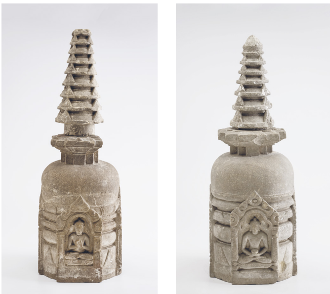
2. Fogadalmi sztúpák, 9–10. század. Szürke kő, 62,5, illetve 58,7 cm. Budapest, Szépművészeti Múzeum – Hopp Ferenc Ázsiai Művészeti Múzeum, ltsz. 54.25–26.

A buddhista vallás egyik szent helyén, Bodh-Gajában (3. kép) szerezte őket 1883-ban, hasonlóan azokhoz az Indiában állomásozó angol katonatisztekhez, akik a gyarmati uralom kiterjesztése és fenntartása során a szubkontinentst bejárva, hol még antikvárius, hol már szakszerű régészeti érdeklődéssel fordultak az indiai civilizáció romokban lévő emlékei felé. Feltárták, dokumentálták, publikálták és gyakran magukkal is vitték az emlékeket, magán- vagy közgyűjteményekben halmozva fel őket. Azaz átkutatták a szent épületeket, feltörték az azokban talált ereklyetartók „rakhelyeit” (Duka szóhasználatát idézve), és elhordták a nyelvészeti, filológiai, archeológiai vagy művészeti szempontból érdekes és értékes tárgyakat. Az építmények, tárgyak kiürültek – átvitt értelemben is; eredeti funkció-