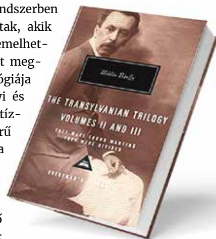
A trilógia egyik angol kiadásának borítója

Ha a kötet szerzőjét követve „csak” a gazdag, változatos műfajokban megmutatkozó írói arcélt vizsgáljuk, akkor is azonnal szembeötlök két jellemző. Az első az, hogy az irodalmi életmű javarészt a politikától formálisan-kényszerűen visszavonuló Bánffy