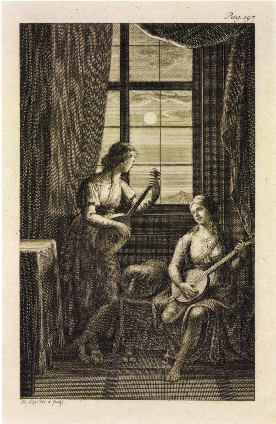
10. kép. J. H. Lips: Két lantozó nő , 1796, rézmetszet