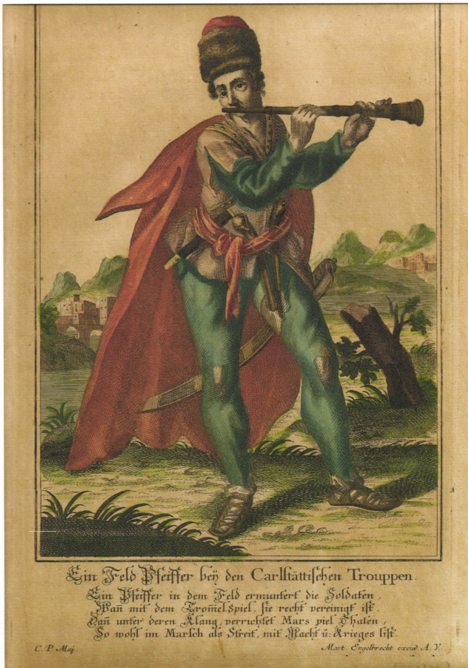
7. kép. M. Engelbrecht: A károlyvárosi csapat táborigényese (fuvólás), 1750 körül, akvarellal színezett rézmetszet