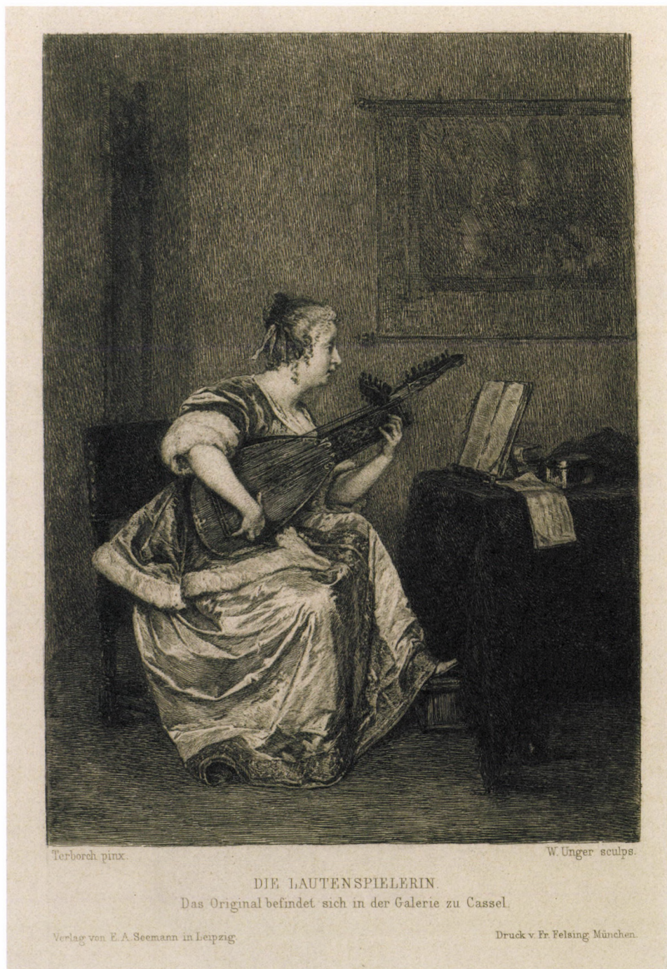
11. kép. G. Terborch után W. Unger: Lantozó nő, 1869, rézkarc