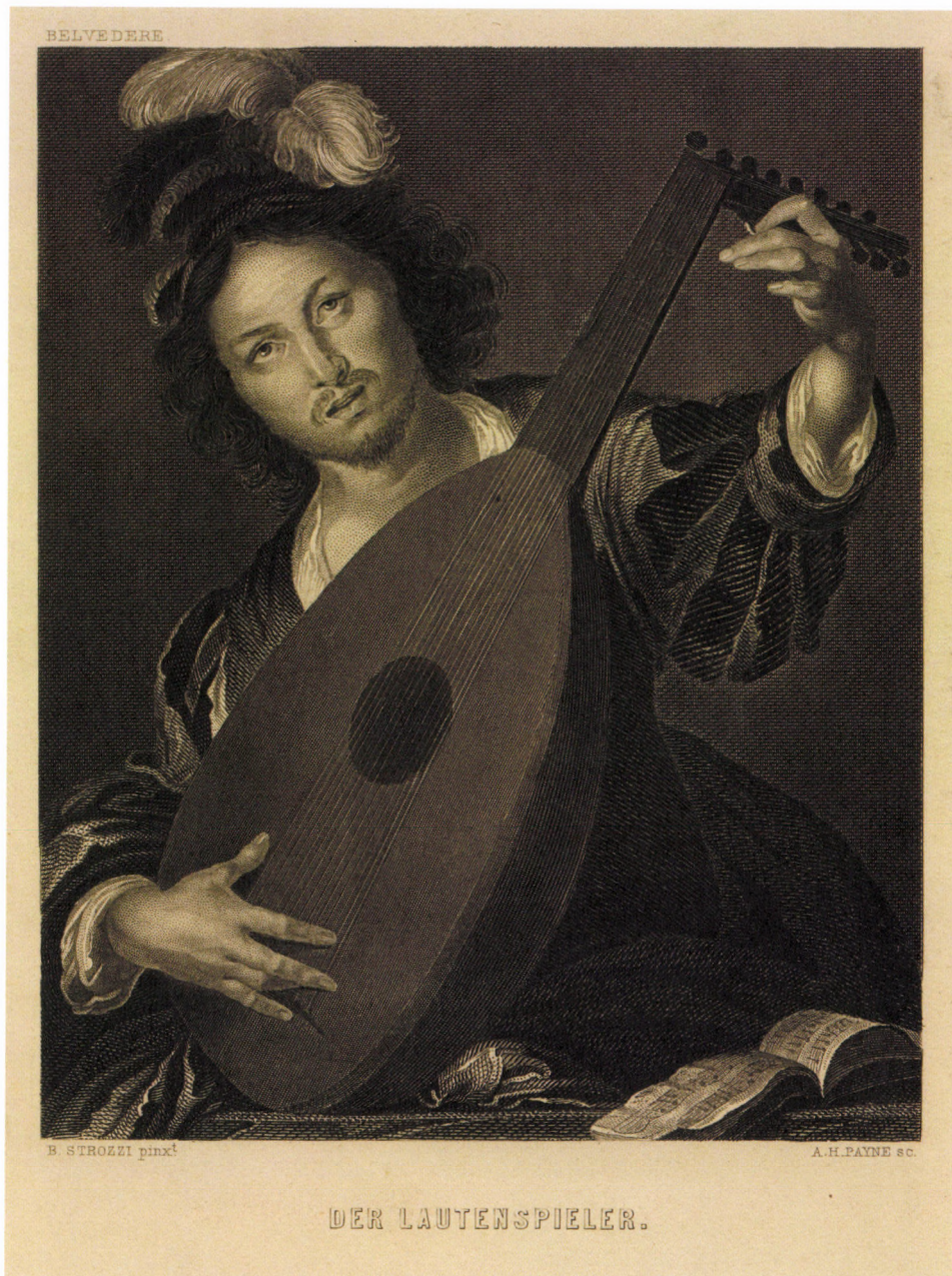
20. kép. B. Strozzi után A. H. Payne: Lantozó nő , 1861, acélmetszet