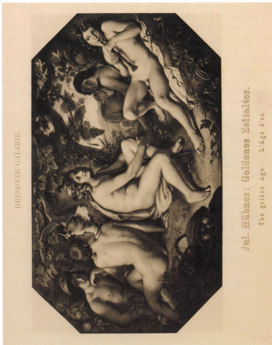
26. kép. Julius Hübner Az aranykor című festményének fénynyomata