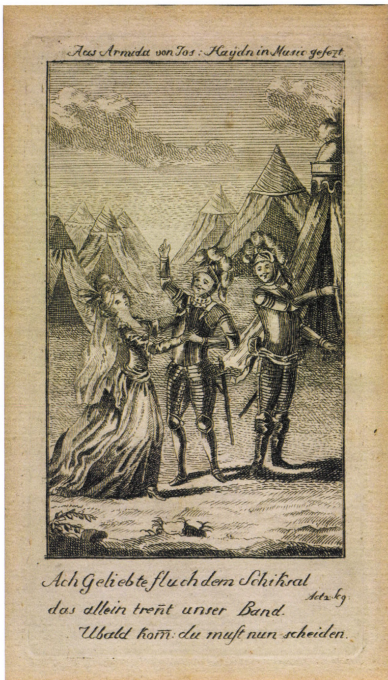
4. kép. F. A. Hoffmann: Díszletterv Haydn Armida című operájához, 1787, rézmetszet