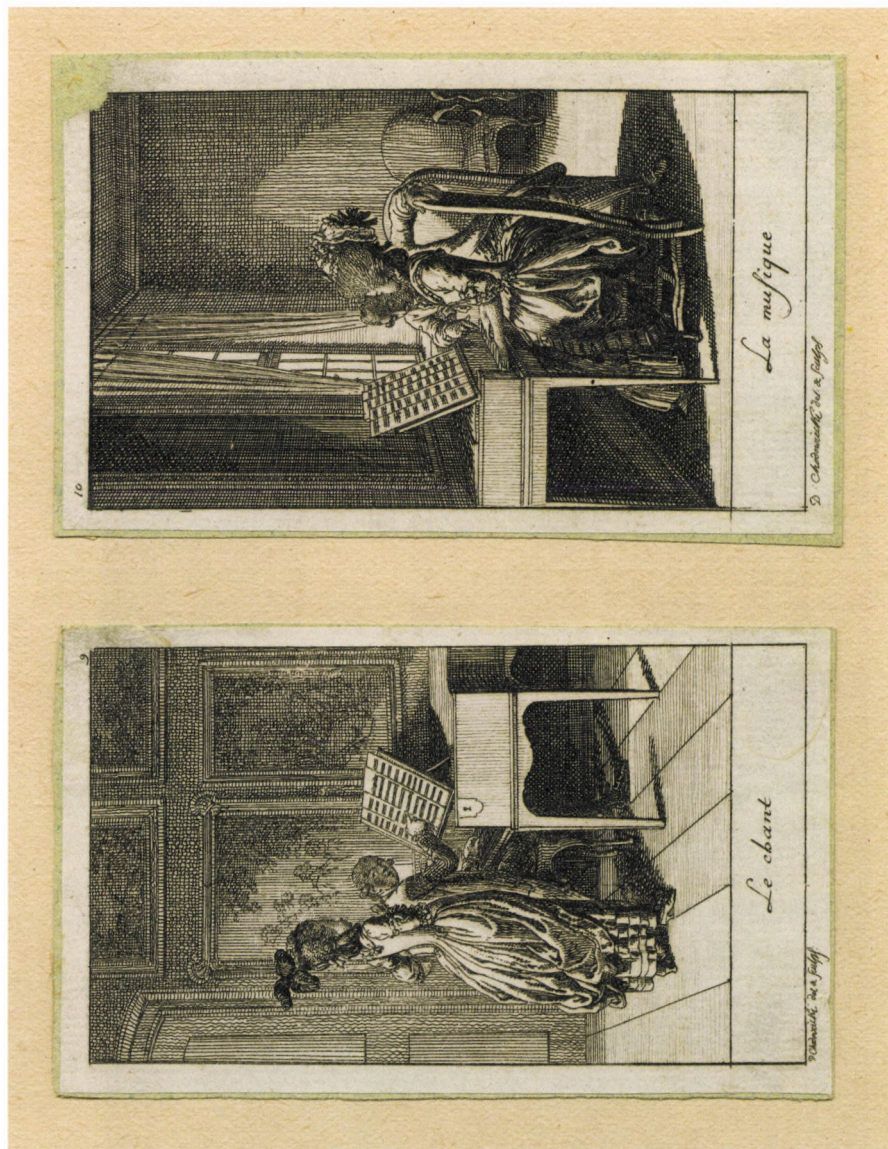
9. kép. D. Chodowiecki: Az ének és A zene, 1781, rézkarc