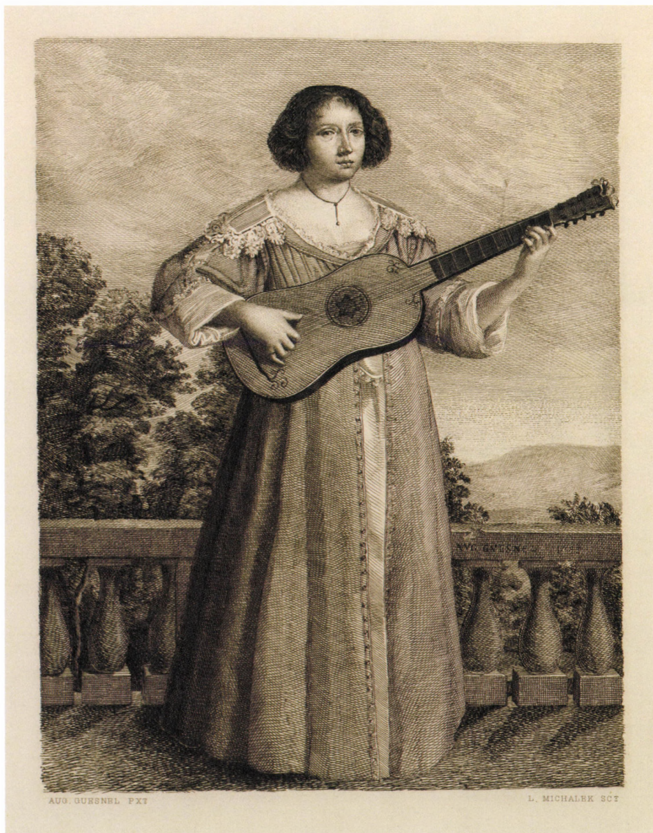
13. kép. A. Quesnel után L. Michalek: Gitarozó nő , 19. sz. vége, rézmetszet