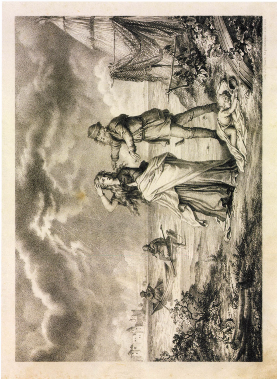
23. kép. A. F. Wälzel, Engel és Mandello: Tiszaparti jelenet , 1861, litográfia