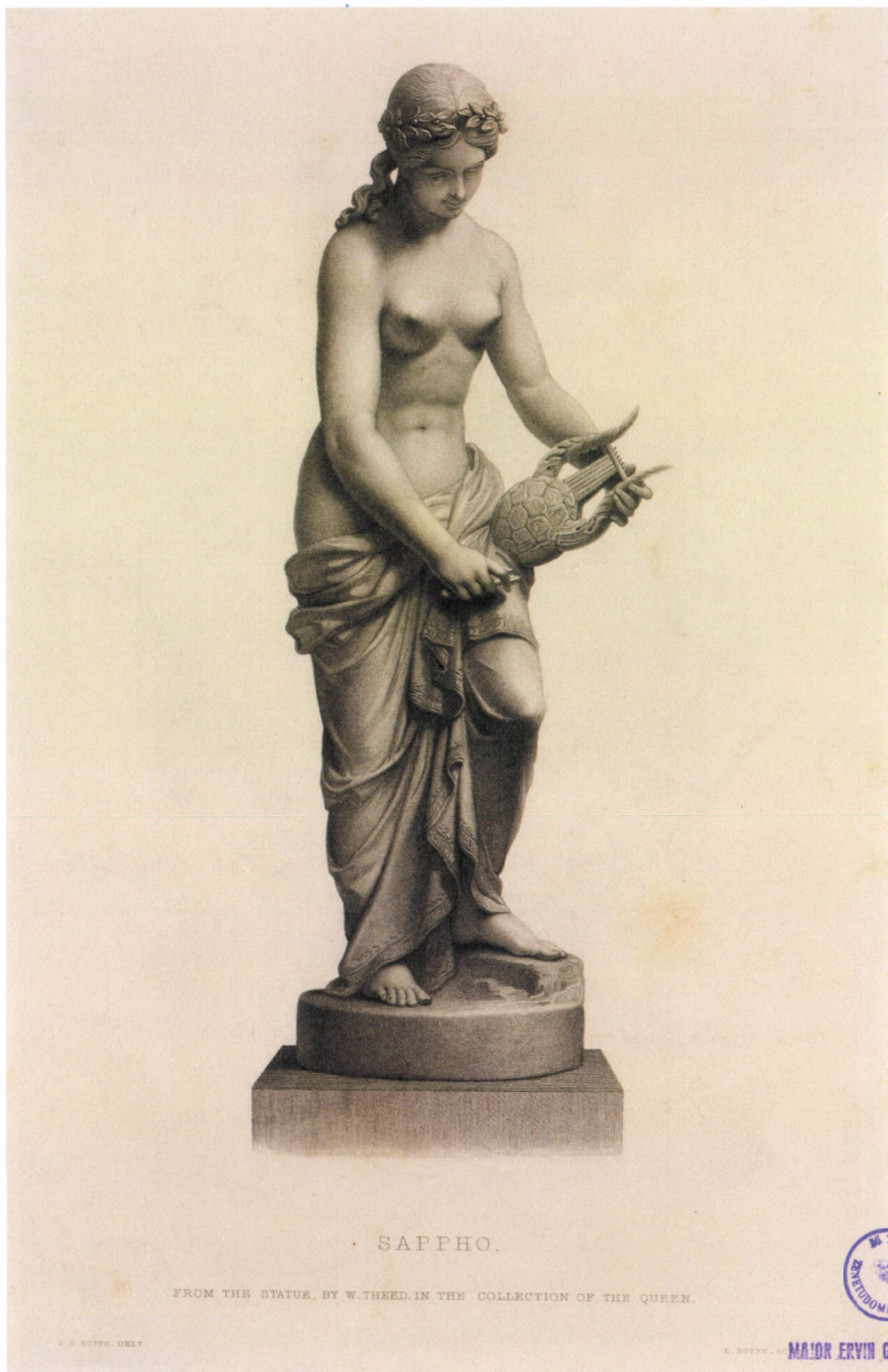
18. kép. W. Theed után E. Roffe: Sappho , 1855, acélmetszet