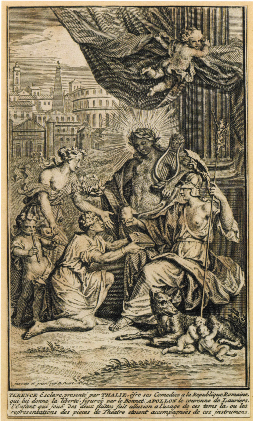
5. kép. B. Picart: Terence Esclave... , 1726, rézmetszet