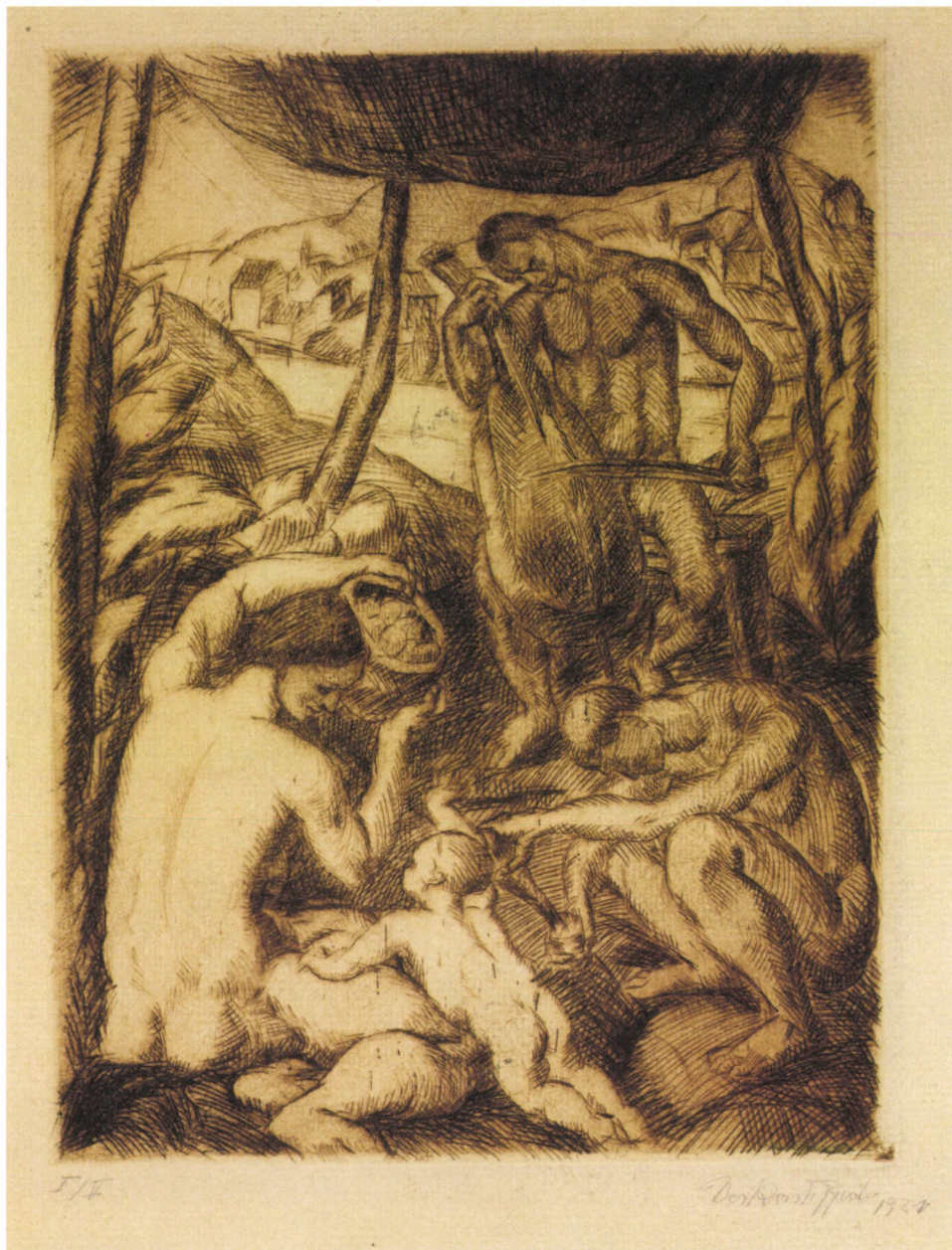
14. kép. Derkovits Gyula: A koncert , 1921, rézkarc