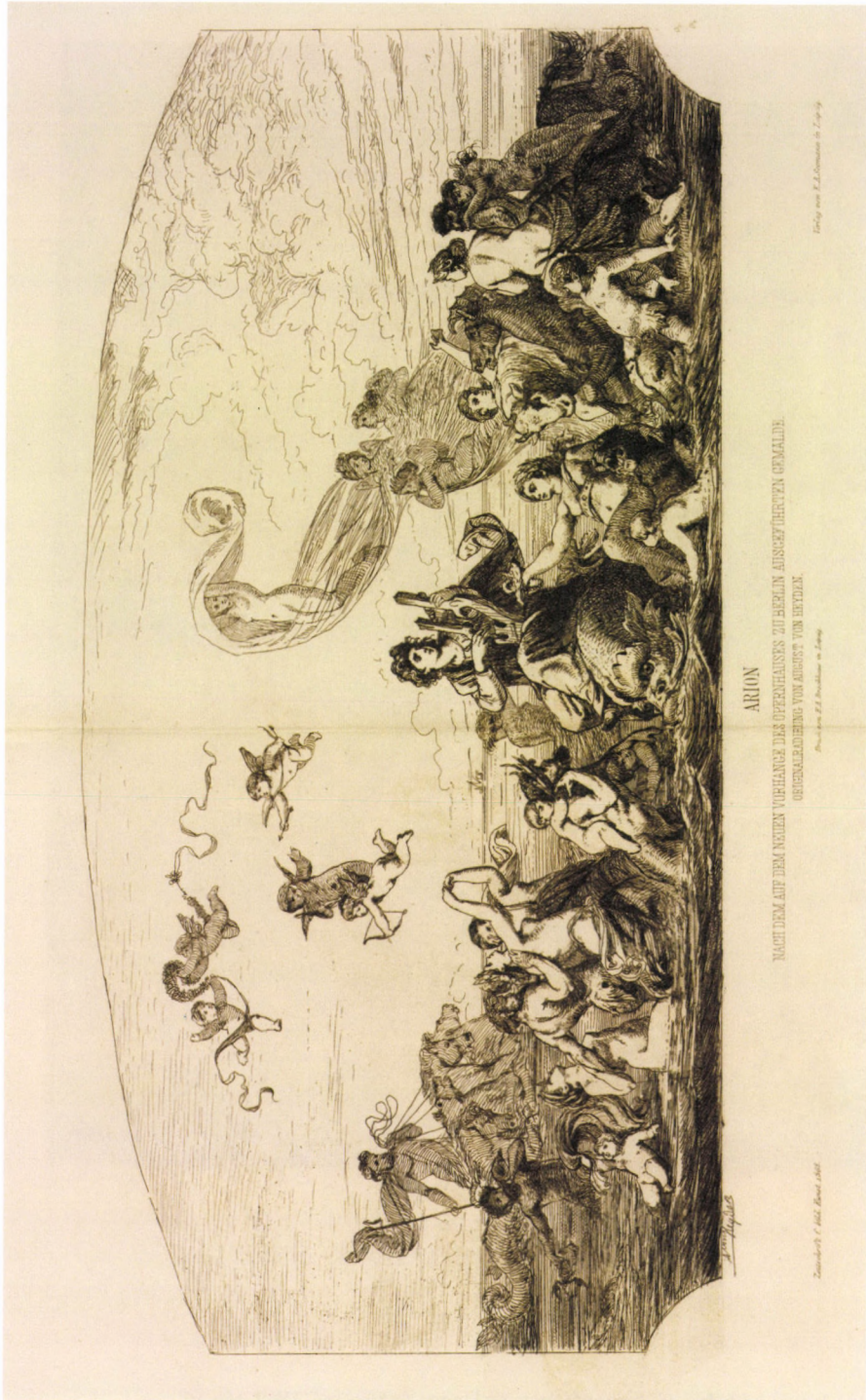
12. kép. A. Heyden: Arion , 1868, rézkarc