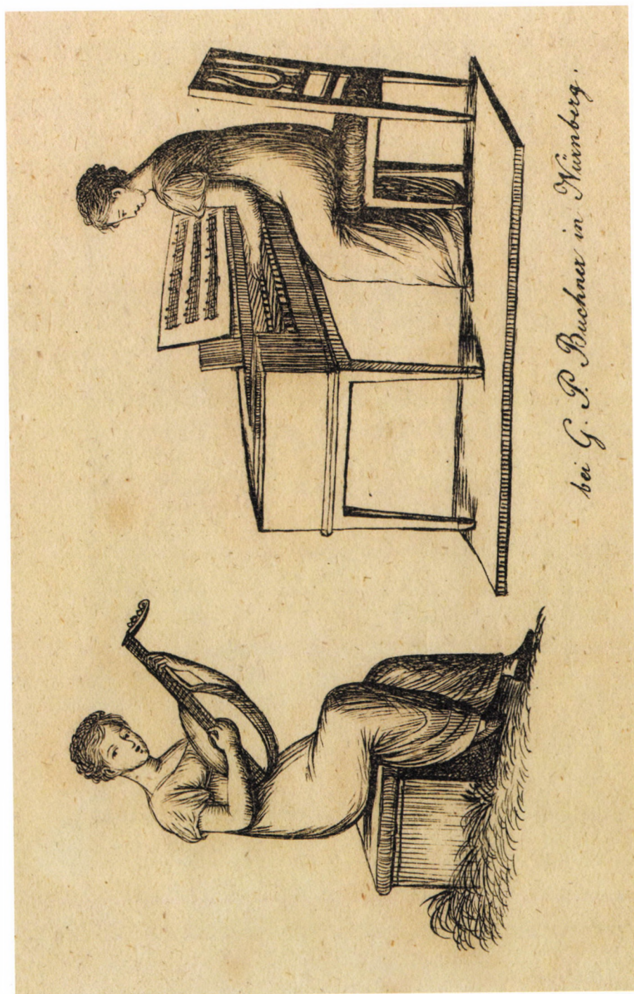
22.b kép. G. P. Buchner: Így a városban, részlet, 1820 körül, litográfia