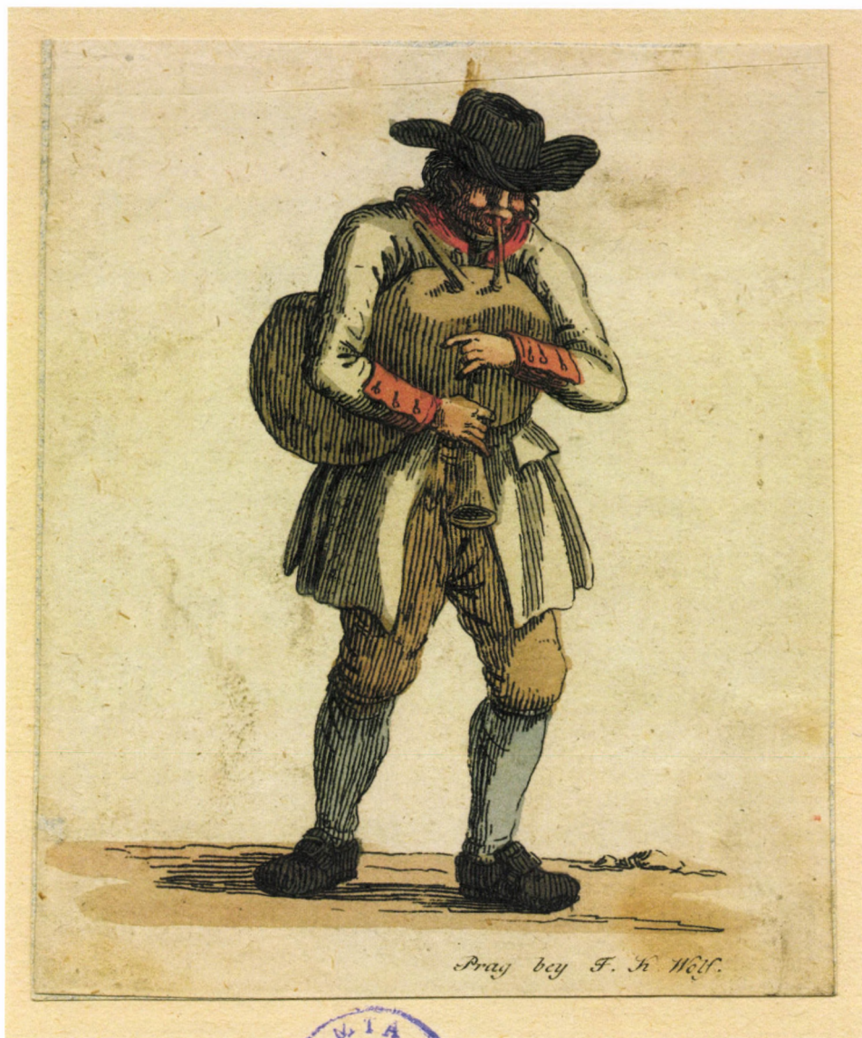
8. kép. F. K. Wolf: Dudás , 1800 körül, akvarellal színezett rézkarc