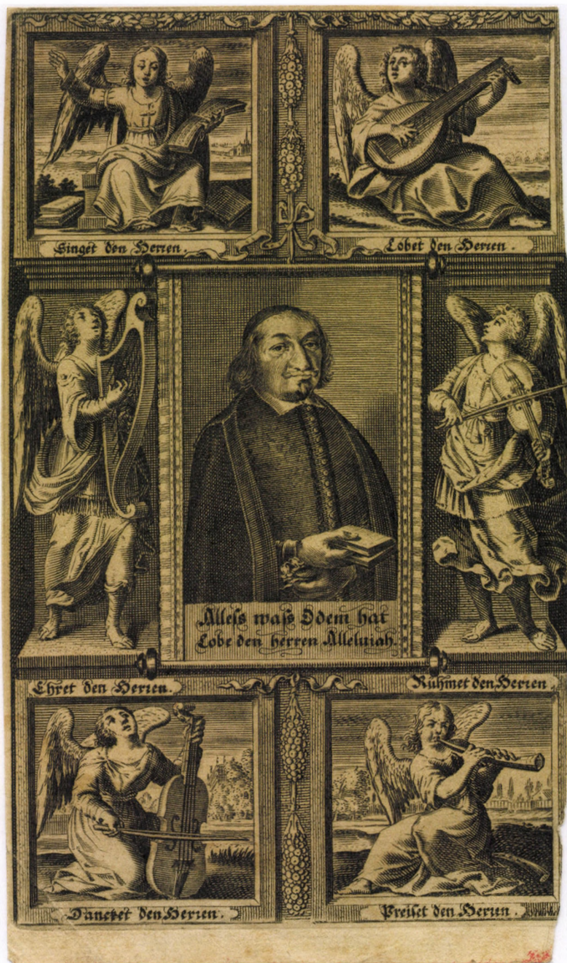
2. kép. F. Stürhelt: Johann Rist , 1650 körül, rézmetszet