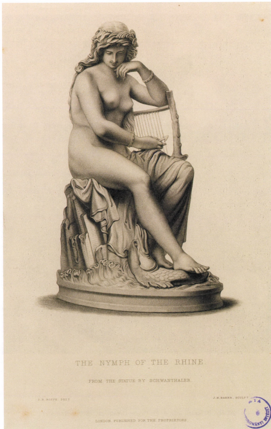
19. kép. L. Schwanthaler után J. H. Baker: Rajna nimfája , 1855, acélmetszet