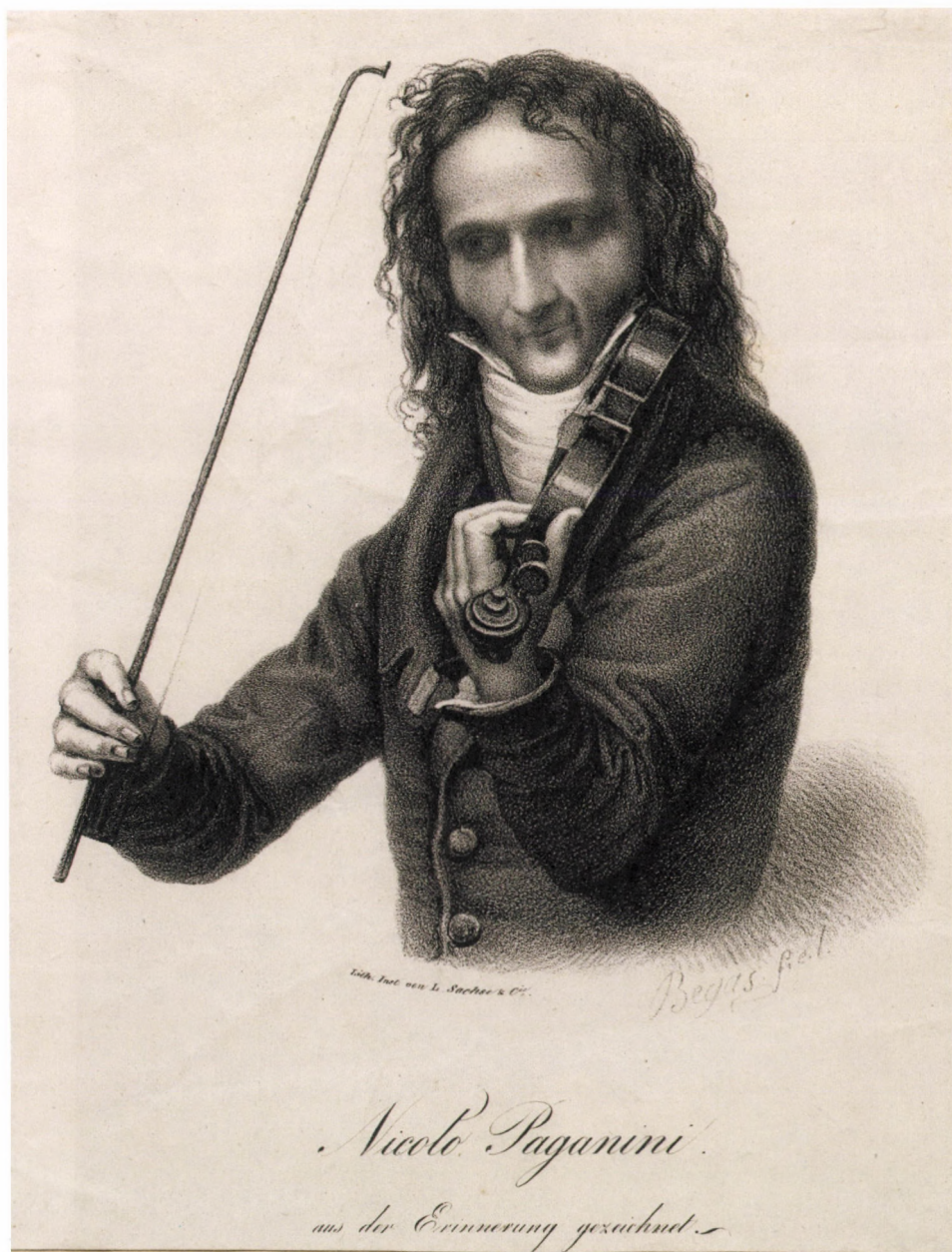
24. kép. Karl Begas: Paganini, 1820 körül, litográfia