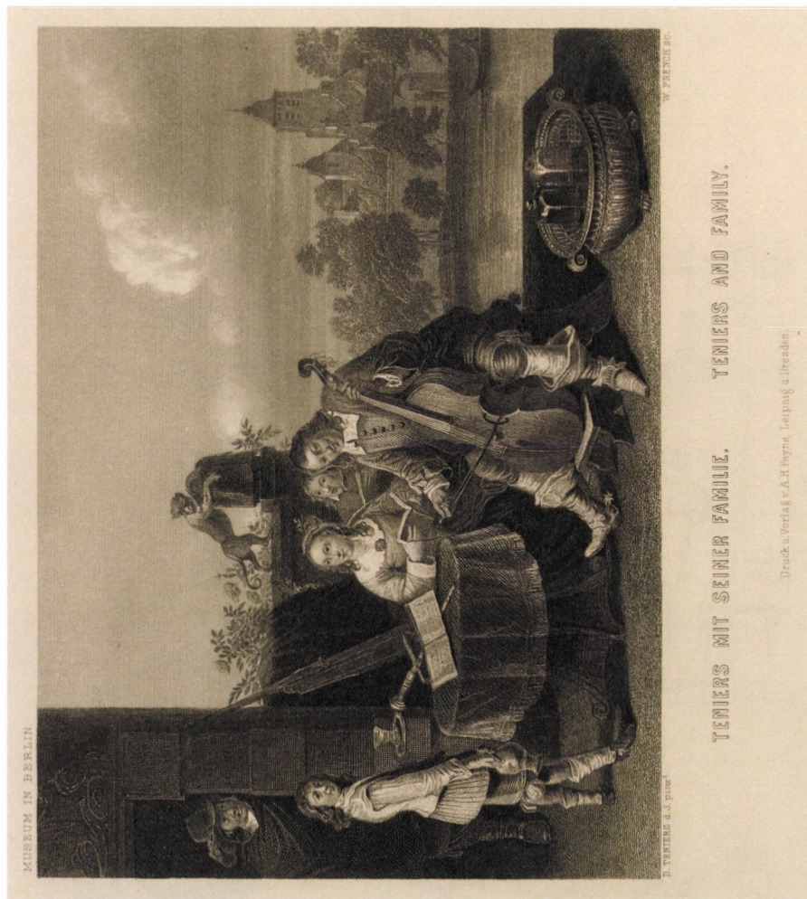
21. kép. D. Teniers után W. French: Teniers családjának , 19. sz. második fele, acélmetszet