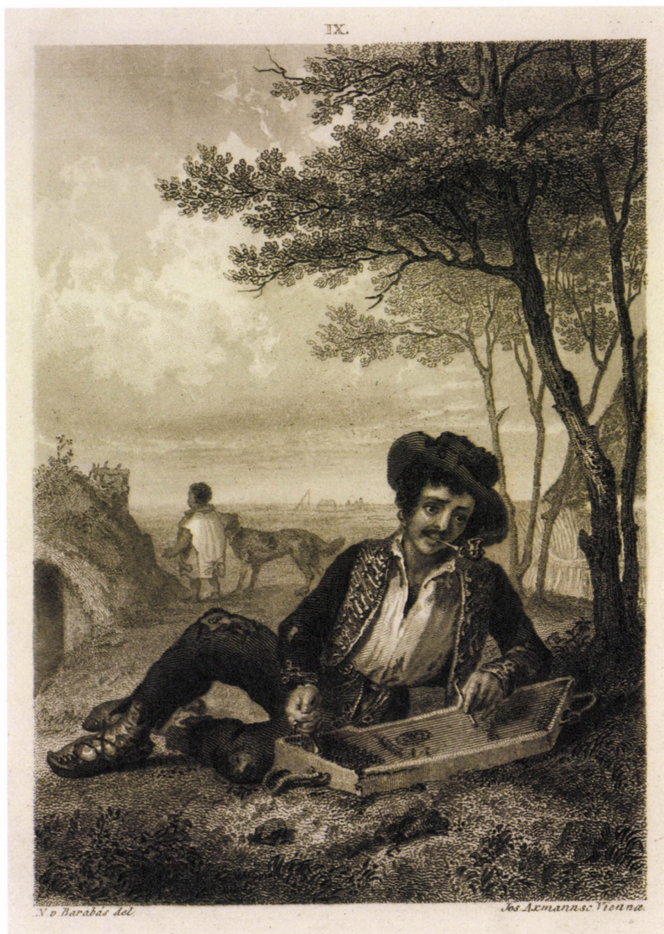
16. kép. Barabás M. után J. Axmann: Cimbalmos , 1845, acélmetszetet