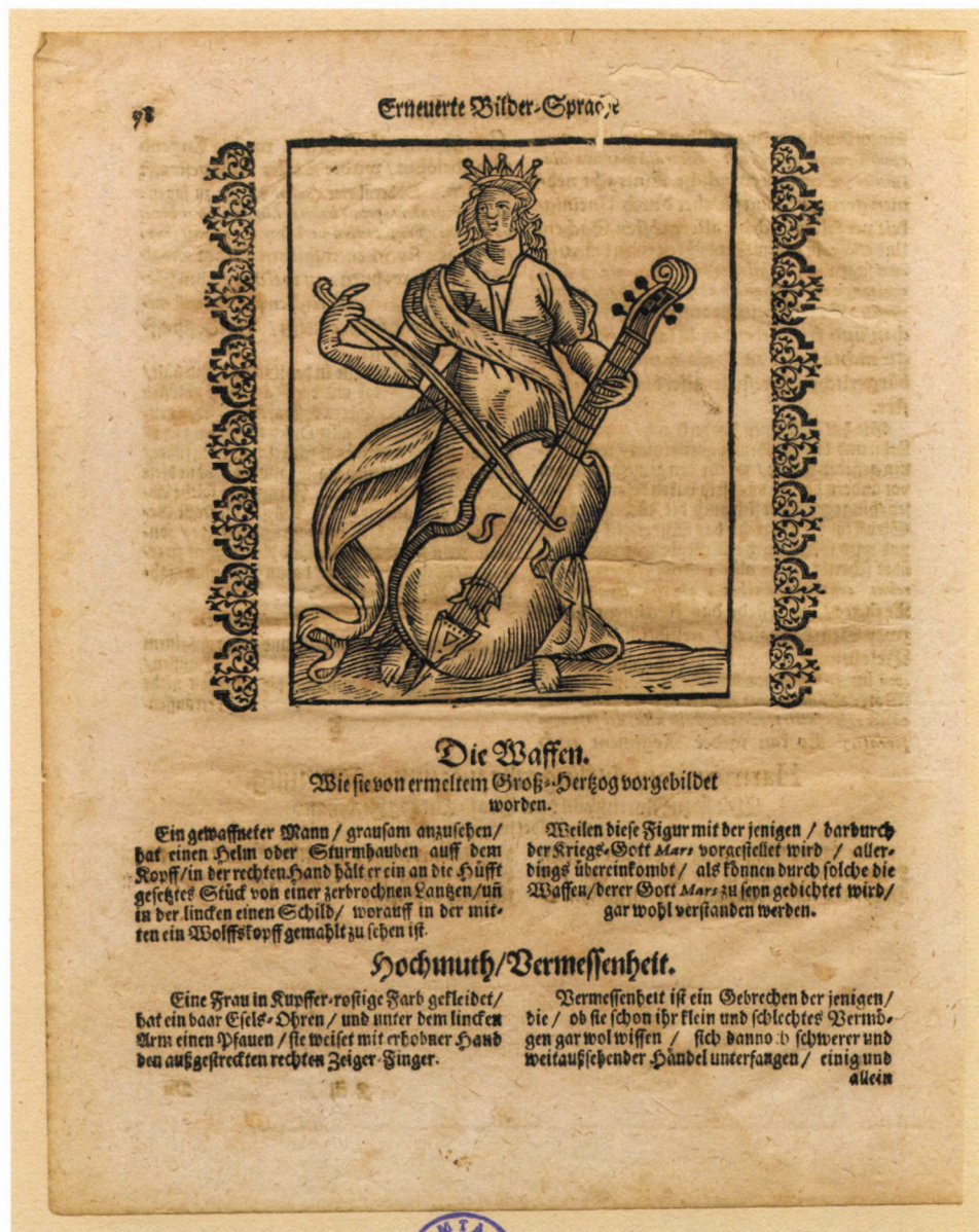
1. kép. Harmónia Cesare Ripa Iconológiájából, 1660 körül, fametszet