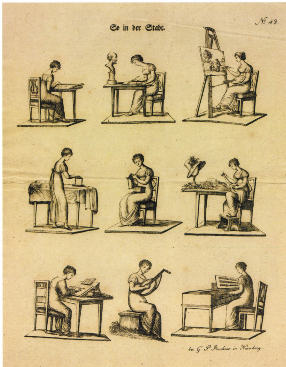
22.a kép. G. P. Buchner: Így a városban , 1820 körül, litográfia