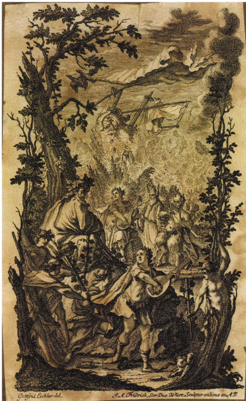
6. kép. G. Eichler után J. A. Friedrich: Ovidius Átváltozások német kiadású kötetéből, 1763, rézkarc