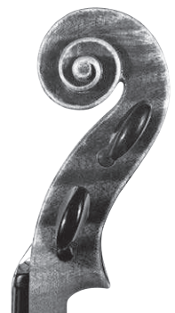
A „Belházy” hegedű csigája