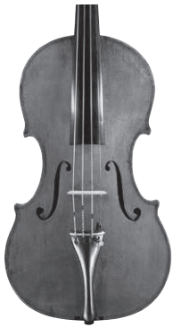
A „Roth” hegedű (Chi-Mey Múzeum, Tajvan)