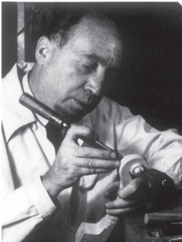
Reményi László (1895–1964)