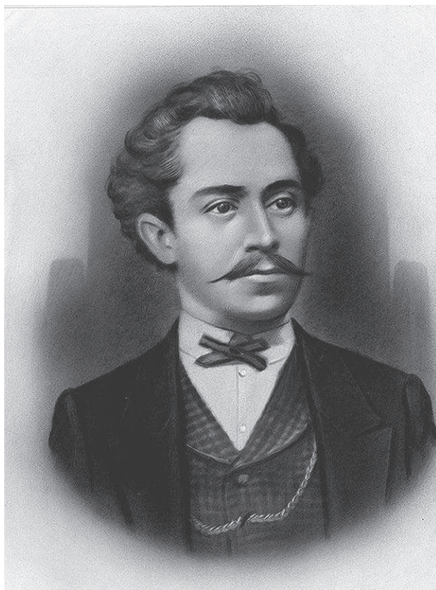
Nemessányi Sámuel (1837–1881)

Az elmúlt évtizedekben 2018–2019 hozott olyan jelentős változást Nemessányi recepciójában, amellyel csak az előző évszázad legkiemelkedőbb eseményei mérhetők össze. Utóbbiak között említhetjük az 1925-ös I. Országos Kézművesipari Tárlatot , amelyen a Reményi cég egy teljes kvartettet mutatott be a mestertől, Reményi Mihálynak az 1928-as kiállítás katalógusában megjelent írását, valamint a 20-as évek végének próbálkozásait, hogy Nemessányiról monográfia jelenjen meg, tiszteletére köztéri szobrot állítsanak, illetve hogy az utódok