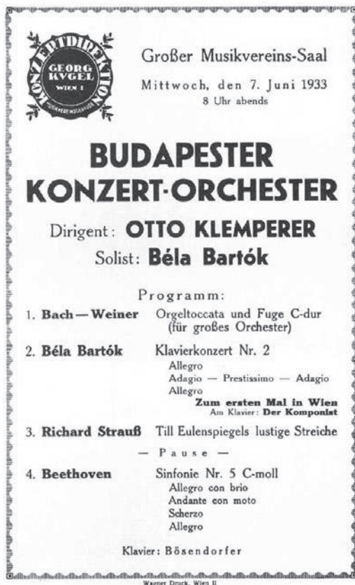
A II. zongoraverseny bécsi előadásának műsortalpa, 1933. jún. 7.

Az I. zongoraverseny előadásainak keserű tapasztalatai arra sarkallták Bartókot, hogy a mű kiváltására egy második versenyművet írjon, hiszen nem elriasztani, hanem megnyerni szeretne volna a zenészeket és a közönséget egyaránt. Erre utalt az utóbbi darabról tett nyilatkozatában, kiemelve a két mű hasonló vonásait is: „Első zongoraversenymet 1926-ban írtam. Ez a mű szándékom ellenére kissé – sőt mondhatni nagyon – nehézre sikeredett mind a zenekar, mind a közönség számára. Néhány év múlva, 1930–31-ben ezért akartam megírni 2. zongoraversenymben az elsőnek mintegy ellendarabját: olyan művet, amely a zenekar számára kevésbé nehéz, tematikus anyagai pedig tetszetősebbek. Ez a szándék magyarázza utóbbi versenymű legtöbb témájának népszerűbb és könnyedebb jellegét. [...] Az első tétel zenekara fúvós és ütőhangszerekből áll; az adagióé (szordinált) vonós hangszerekből és üstdobokból; a scherzo vonós hangszereken és a fúvós és ütőhangszerek egy csoportján szólal meg, s csak a III. tétel veszi igénybe a teljes zenekart. Megjegyzem még, hogy két zongoraversenymnek egyikét sem zenekarral kísért zongorára, hanem zongorára és zenekarra írtam; szólólistának és együttesnek teljesen egyenrangú szerepet szántam mindkettőben.”