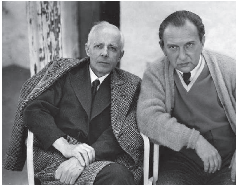
Reiner Frigyesel Westportban, 1942-ben

Bartók a Divertimentó ban még erőteljesebben megkötötte a kezét azzal, hogy kizárólag vonószekart alkalmazott (Sacher visszaemlékezése szerint eleinte nem akart ebbe beleegyezni), a hangzások, játékmódok és a zenekar kezelésének bámulatos sokrétősége azonban sokszorosan kárpótolja a hallgatót. A kettősfogások, a divisik és a sűrű tutti-szóló váltakozások óriási változatoságot biztosítanak a darabban, a második tétel gyakran apokaliptikus temetés-vízióként jellemzett közép-része pedig újabb effektusokkal gazdagította a zenekari írás tárházát. A mester e szívemarkoló megnyilatkozásában a félelmetes hatású, visító trillák és a sűrűn felrakott kísérőszólamok nem is annyira az elmúlás fájdalomáról szólnak, mint inkább az egész emberiség fenyegetettségéről, amelyet a szeizmográf-érzékenységu komponista a világháború előestéjén megérezhetett. Bartók nem tudott részt venni az 1940. június 11-én Bázelen megtartott bemutatón. Csupán néhány hete érkezett haza Amerikából, és ősszel – a visszatérés reményében, de immár végleg – ismét elhagyta otthonát. Amint ekkor írta: „ugrás a bizonytalanságba a biztos elviselhetetlenből.”