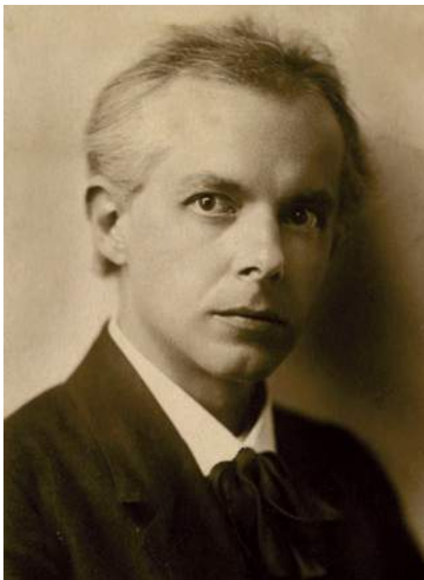
Bartók az 1910-es években

Utólag, a teljes életmű felől közelítve egészen más következtetésekre juthatunk, mintha csupán egyetlen alkotás vizsgálatából indulunk ki. Szívesen kérnénk számon a fiatalkori műveken is az érett mester stílusjegyeit, ezáltal megkérdőjelezve azok jelentőségét. Amikor azonban az I. zenekari szvitet (op. 3) hallgatjuk, a professzionálisan kezelt, Richard Strauss-i méretű romantikus együttes bűvöl el, a II. szvitben (op. 4) pedig a kamarazene-szerűbb hangszerelés és egyes szólisztikusan felrakott részletek ragadnak meg. Utóbbi átmeneti darab: amikor Bartók az 1905 novemberét követő hónapokban az első három tételt komponálta, még a magyar romantika jegyében alkotott, majd másfél évvel később, 1907 nyarán írta meg a zárótételt, már új eszmények jegyében, az ereszkedő pentaton magyar népzene felfedezését követően. Amint ebben az alkotásban, úgy a Két portré második tételében (op. 5, a 14 bagatell zárószámának hangszerelése) és a Két képben (op. 10, 1910) is felfedezhető A fából faragott királyfi (op. 13, 1914–17) egy-egy pillanata. Emiatt könnyen eshetünk abba a hibába, hogy e műveket önálló alkotások helyett