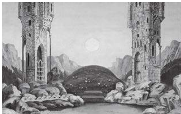
Bánffy Miklós díszletterve A fából faragott királyfi előadásához

Abban, hogy a táncjáték (majd az opera) hiteles előadásban szólalt meg, döntő szerepet játszott Egisto Tango karmester és az Operaház vezetése, amely soha nem tapasztalt mennyiségű próbát engedélyezett a be-tanuláshoz. Bartók így írt édesanyjának Tangóról: „ ő a legjobb karmester, akivel eddig dolgom volt. [...] minden egyebet levettek a műsorról, a filharmonikusok próba nélkül (!) rendezik koncertjeiket, Tangonak a „kegyelmes ur” megígérte a 30 próbát. Gondold csak meg, 30 próba! Tango eddig nagyszerűnek bizonyult: az hogy másképp nem vállalja a dolgot, csak ha kellő alapossággal tudja a legapróbb részletekig kidolgozni, az a legszebb dolog, amit egy karmestertől hallhat az ember. Képzeld el bárki más – kisebb tehetséggel, kisebb nekikészüléssel, 5-6 próbával megcsinálta volna, de hogyan! Attól mentsen meg bennünket az Ur! [...] 3 hétig tanulmányozza a