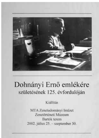
2. kép: Kiállítás Dohnányi Ernő születésének 125. évfordulóján, 2002

újabb fordulópontot jelentett a múzeum életében. Falvy Zoltán nyugdíjba vonulásával Anna került a múzeum élére, és egy-egy ifjú segítőt nem számítva hosszú ideig egyedül maradt a tengernyi teendő közepette. Ekkor indult ugyanis az Erdődy–Hatvani-palota felújítása, modernizációja és rekonstrukciója Tallián Tibor igazgató vezényletével. Anna számára ez a kiűzetés, vándorlás, beköltözés és újjáépítés hét szűk esztendejét jelentette. Vele párhuzamosan jómagam például két év alatt öt alkalommal költöztem a Dohnányi Archívum gyűjteményével és eszközeivel együtt egyik szobából a másikba, a földszintről az első vagy a harmadik emeletre és vissza, de mindez csupán sétagalopp lehetett a múzeumi irodák, termek, raktárak és lépcsőház alapvető átalakítása közepette, amikor a nagyméretű gyűjtemény mozgatása és megóvása heroikus feladatot jelentett. Vándorlás közben, valahol a puszta közepén találkoztunk Annával: egy ideig én is a kiállítás romjai között kaptam menedéket íróasztalommal és eszközeimmel együtt, majd mivel évről évre jobban késett és