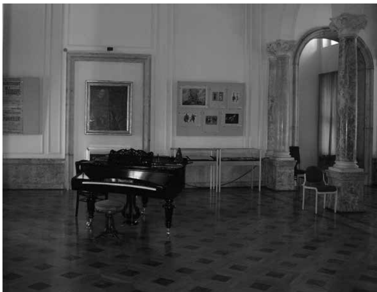
3. kép: Dohnányi Bösendorfer zongorája a Bartók-teremben, 2002