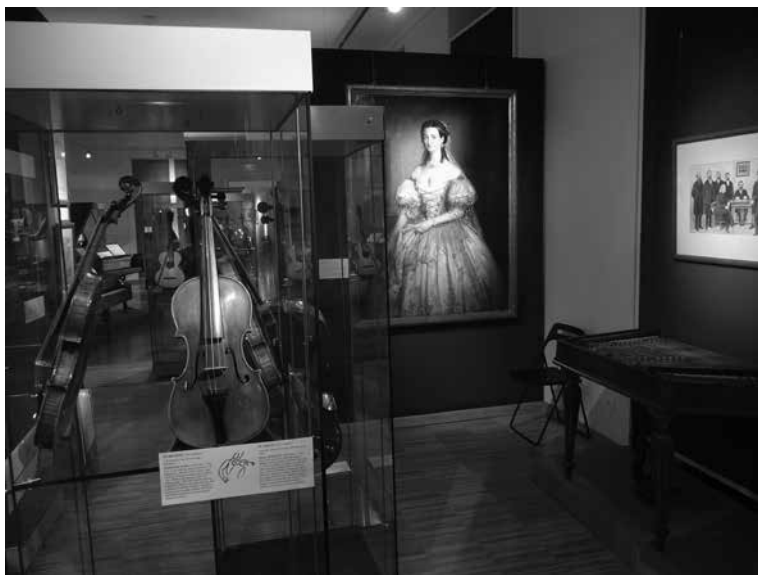
5. kép: A Hangszerek Magyarországon állandó kiállítás a Zenetörténeti Múzeumban, 2012

szenciájaként kelt életre. Mintha a kisebb és nagyobb tárlatok csupán abból a célból születtek volna, hogy amikor túljutottunk a kívülről elvárt feladatokon, amikor kifogytunk minden támogatási lehetőségből, akkor mindezek „melléktermékei”, a bemutatáshoz előkészített műtárgyak és vitrinek ott álljanak készen, hogy elfoglalják helyüket a régóta tervezett hangszerkiállításban. Anna folyamatosan pályázott restaurálásra, raktárkorszerűsítésre és más részfeladatokra, a viszonylag jól finanszírozott Haydn-, Erkel- és Liszt-évfordulók idején pedig szándékosan azokat a hangszereket újította fel vagy tisztította meg, azokat a festményeket kérte kölcsön vagy másoltatta le, amelyeket e nagy vállalkozásához szánt.