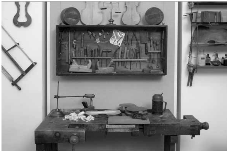
6. kép: Hegedűkészítő műhely a Zenetörténeti Múzeumban, 2014