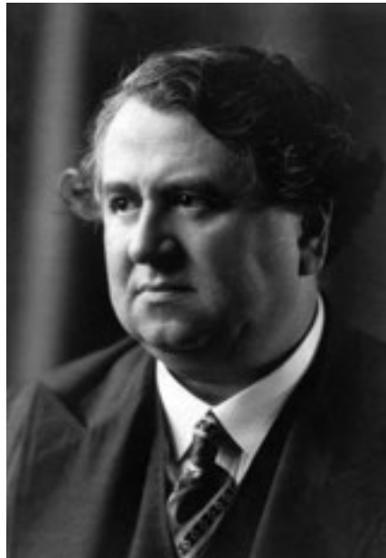
4. Gerevich Tibor tanszékvezető professzor, 1920-as évek