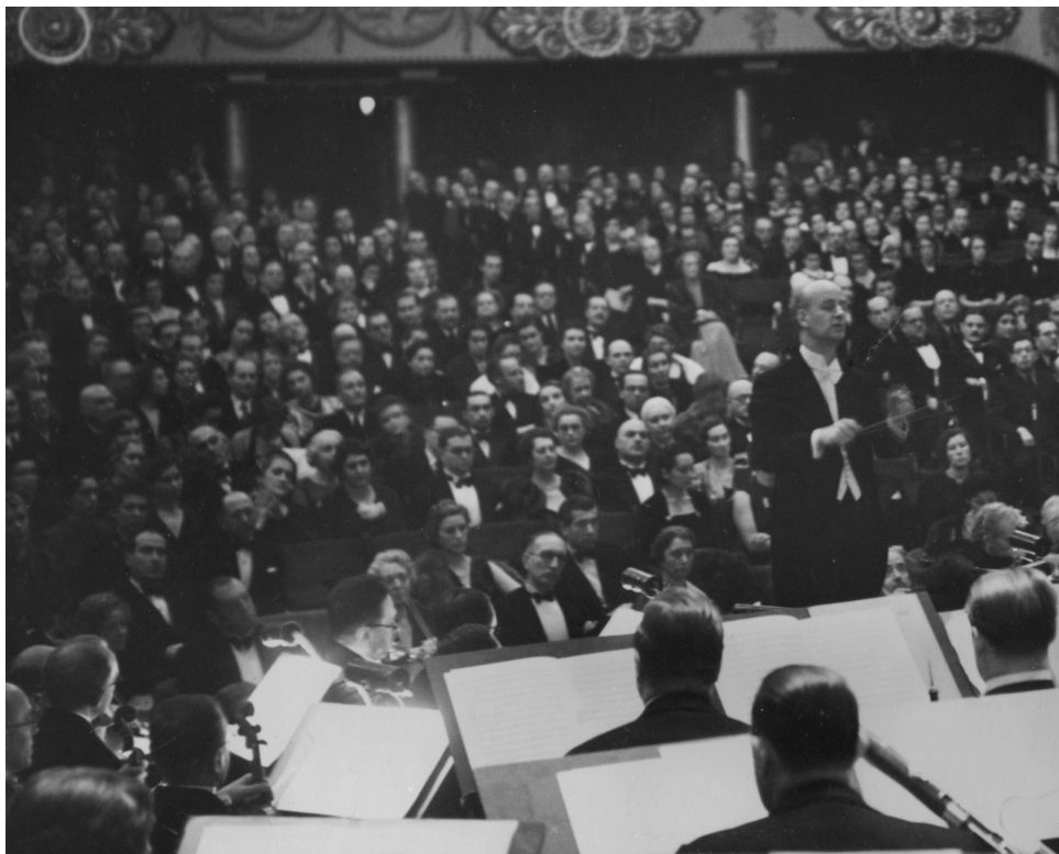
7. faksimile. Wilhelm Furtwängler és a Budapesti Filharmóniai Társaság 1939-ben

Béla már említett kiadványát használják kiindulópontul, ami lehetetlenné teszi a téma kritikus-elemző megközelítését. Bónis Ferenc ugyan hivatkozik kötete előszavában a Filharmóniai Társaság Archívumának fényképgyűjteményére és irattárára, az azonban nem tudható pontosan, hogy munkája elkészítéséhez milyen mértékben használta a gyűjtemény gazdag irattárát. Az előszóban Bónis azt a – nem teljesen helytálló – megállapítást tette, hogy az együttes nem minden időszakában gyűjtötte szisztematikusan az történetükhöz kapcsolódó dokumentumokat, s hogy a vidéki és külföldi vendégszereplések sajtóvisszhangjaiban is találhatunk hiányosságokat. 20