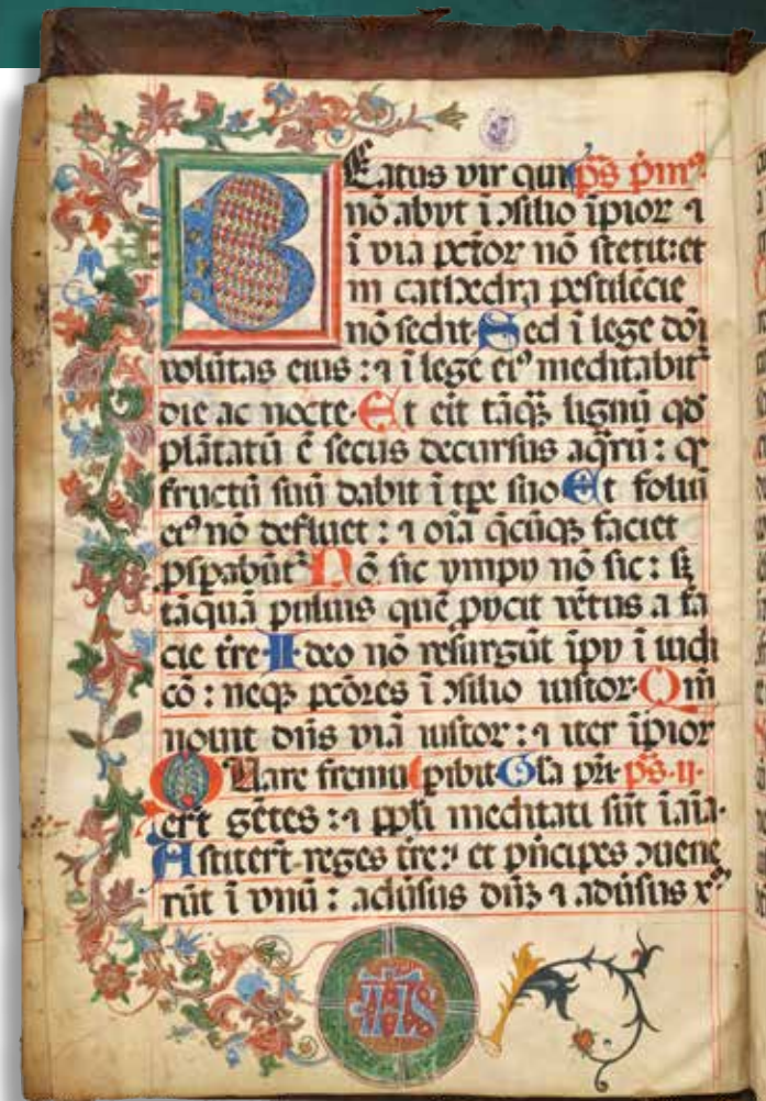
Zoltároskönyv részlete a marosvásárhelyi egykori ferences kolostor könyvtárából

„középszintet” Kézdivásárhely, Sepsiszentgyörgy, Csíkszereda, Székelykeresztúr és Nyárad-szereda képviseli, majd a 16–17. században felemelkedő mezővárosok (Barót, Bereck, Illyefalva, Gyergyószentmiklós) következnek. A sort olyan települések zárják, amelyek rendelkeztek ugyan bizonyos kiváltságokkal (vásárjoggal, átmenetileg jogszolgáltatási autonómiával) a kora újkorban, azonban a környék falvait csak kevéssel meghaladó méretük, gazdasági jelentőségük, igazgatási szerepük stb. alapján a valóságban nem tekinthetők mezővárosnak. Vásárjoguk kijárása feltehetően az itteni előkelő birtokosoknak tulajdonítható. Ezek a helyi jelentőségű, kisebb települések a korábbi mezővárosok piackörzetével egyértelműen le nem fedett, tőlük távolabb eső területeken fekszenek.