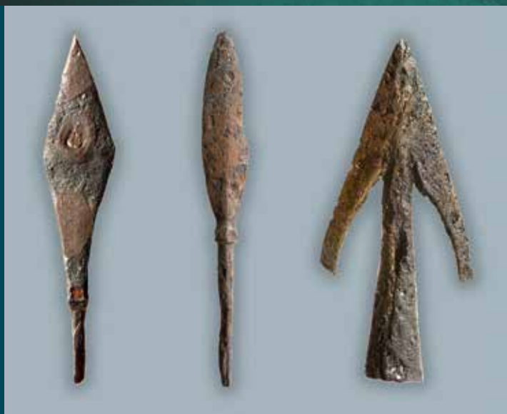
Középkori nyílcsúcsok a Székelyföldről JOBBRA: Kopjás lovas (lófő) ábrázolása a berekeresztúri templomban, 16–17. század A TÚLOLDALON: Székelyföldi kályha-csempék, kopjás lovasok ábrázolásával, 16. század