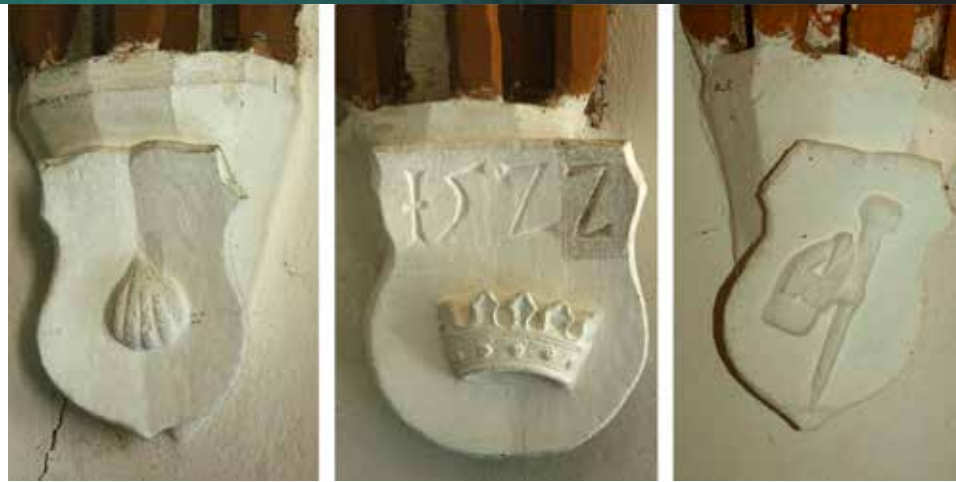
Nyugat-európai zarándoklatokra utaló címerek a homoródjánosfalvi templomban, 1522. JOBBRA: Felvarrható zarándokjelvény (fésűkagyló) Santiago de Compostela-i zarándoklatból Marosvásárhelyről

Ha hihetünk a viszonylag kis lélegzetű székelyföldi ásatások eddigi eredményeinek, figyelemre méltó, hogy a tatárjárás – bár a térség falvait közvetlenül érintette és nyilván nagyon súlyos károkat okozott – jelen tudásunk szerint nem okozott maradandó törést a településtörténetben, amennyiben ekkor elpusztult falvak és sorsukra hagyott pusztatemplomok nagyobb mennyiségben nem jellemzőek e vidékre. Az Árpád-kor derekáig visszanyúló előzményekre támaszkodó településhálózat kétségtelenül elég stabil lehetett ahhoz, hogy a mongoldulás egyetemes katasztrófája után az élet a régi falvak helyén folytatódjék, ami azt sejteti, hogy az embervesztés nem lépte túl azt a kritikus határt, ami már települések sorának megszűnésével járt. Feltételezzük, hogy a székelyek mozgékonyasága, a hegyes és erdős terület jó menedék-