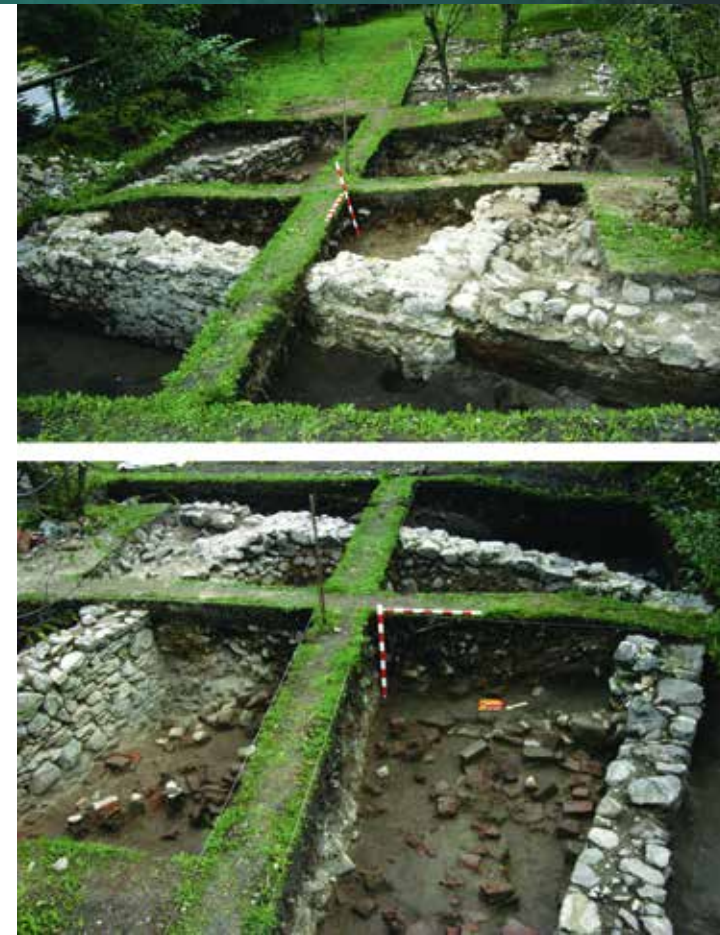
Csíkszentkirály, az egykori Andrásy-udvarház feltárása, 16–17. század

Marosvásárhely) is. A teljes kora újkori Székelyföldön így több mint 400 falusi településsel számolhatunk. A székely falvak kiterjedése és lélekszáma, egyben a településhálózat sűrűsége azonban a földrajzi adottságok szerint vidékenként igen eltérő volt. Pontos adatokkal természetesen nem rendelkezünk, hiszen a jegyzék csak a nagykorú, hadköteles férfiak (családfők) számát rögzíti. A falvak méretére nézve azonban így is nagyon tanulságos, hogy Maros- és Udvarhelyszék területén a felnőtt férfiak falvankénti száma viszonylag alacsony (Maros-szék átlaga: 32,30; Udvarhelyszék: 37,34), ami mögött kis- és közepes méretű települések sűrű hálózata rejlik. 59,19-es átlagával nem áll ettől nagyon messze Sepsiszék, azonban Kézdi- és Orbaiszék, illetve Csík-, Gyergyó- és Kászonszék már az egymástól viszonylag távol fekvő nagy falvak hazája, ahol az amúgy is jelentős átlagméretből (Kézdiszék: 78,70; Kászonszék: 89,50; Gyergyószék: 89,87; Orbaiszék: 91,94; Csíkszék: 96,61) valóságos „óriásfalvak” emelkednek ki, ahol a nagykorú férfiak száma a 200-at is meghaladta (Alsótörja: 195, Csíkszentgyörgy: 207, Zágón: 281).