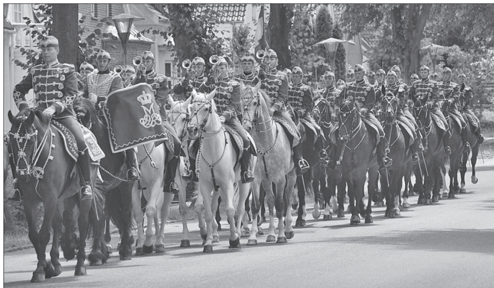
1. ábra A dán Gárdahuszárezred protokollfeladatokra alkalmas huszárszázadának egyenruhája