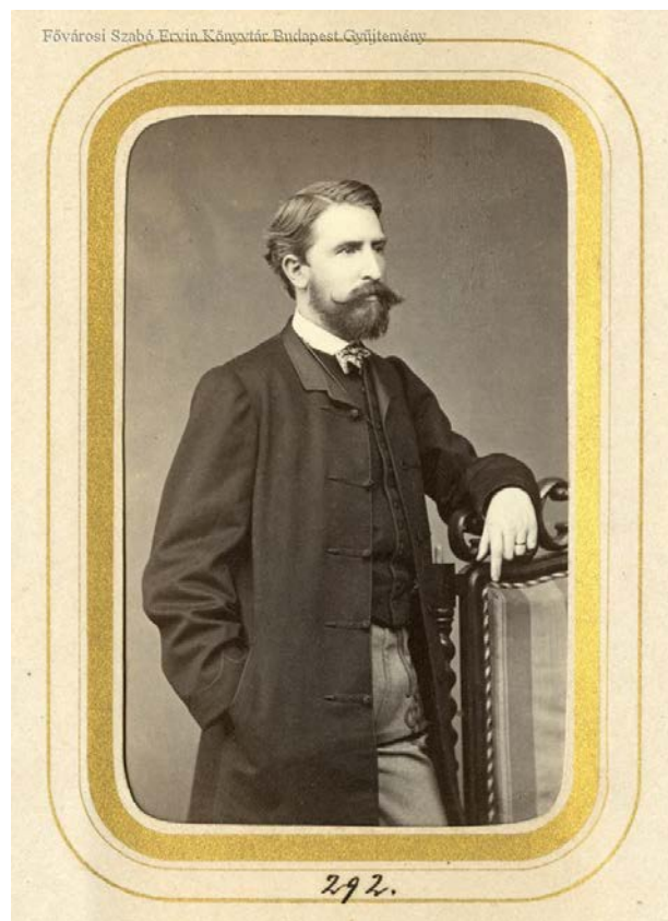
4. kép. Tóth Vilmos belügyminiszter az 1865-ös Országgyűlési album fényképén.

1871 végén kezdődött el a tényleges fővárosi törvény kidolgozása és megvitatása a diétán. A Belügyminisztérium ugyan már júliusban jelezte a rendőrséggel kapcsolatos pontok tárgyalását, de más, fontosabbnak ítélt kérdések miatt azokat mindig levették a napirendről.