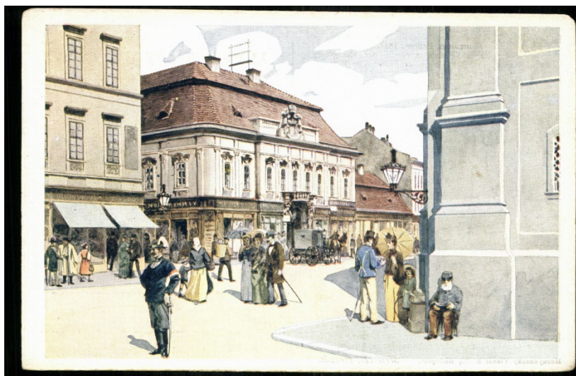
1. kép. A lebontott Grassalkovich-palota a Hatvani (ma: Kossuth Lajos) utcában, amelyben a régi pesti főkapitányi hivatal is működött. Képeslap Dörre Tivadar 1885-ös vízfestményéről.

A három városban a közrendészet tehát a helyi tanács hatósága alá tartozott. A rendőri feladatok felelősei a tanács által választott főkapitányok voltak, akik egyúttal tanácsnoki tisztséget is viseltek. Az egyes városrészekben albiróságok működtek, alkapitányok (a külvárosokban pedig a mezei kapitány ) irányítása alatt. A vezetői poszton működő tisztviselők, az írkokokkal, vásárfelügyelőkkel kiegészülve alkották az ún. fogalmazói állományt . Egyfajta ellenőrző szerepet töltöttek be a biztosok ( hús- és fabiztos, térbiztos ), a tényleges végrehajtói munkát pedig az őrszemélyzet ( közporoszlók, darabontok, lovas kerülők ) tagjai végezték. 3