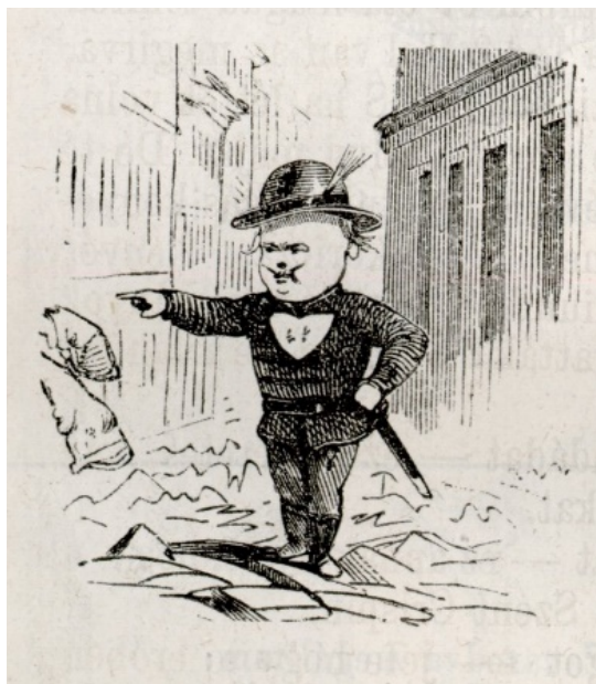
8. kép. Gúnyrajz a fővárosi rendőrségről. Borsszem Jankó, 1871.

rendőrségi törvény mielőbbi megalkotásában, amely azonban a képviselők sürgetése 29 ellenére is egészen 1881-ig váratott még magára. 30