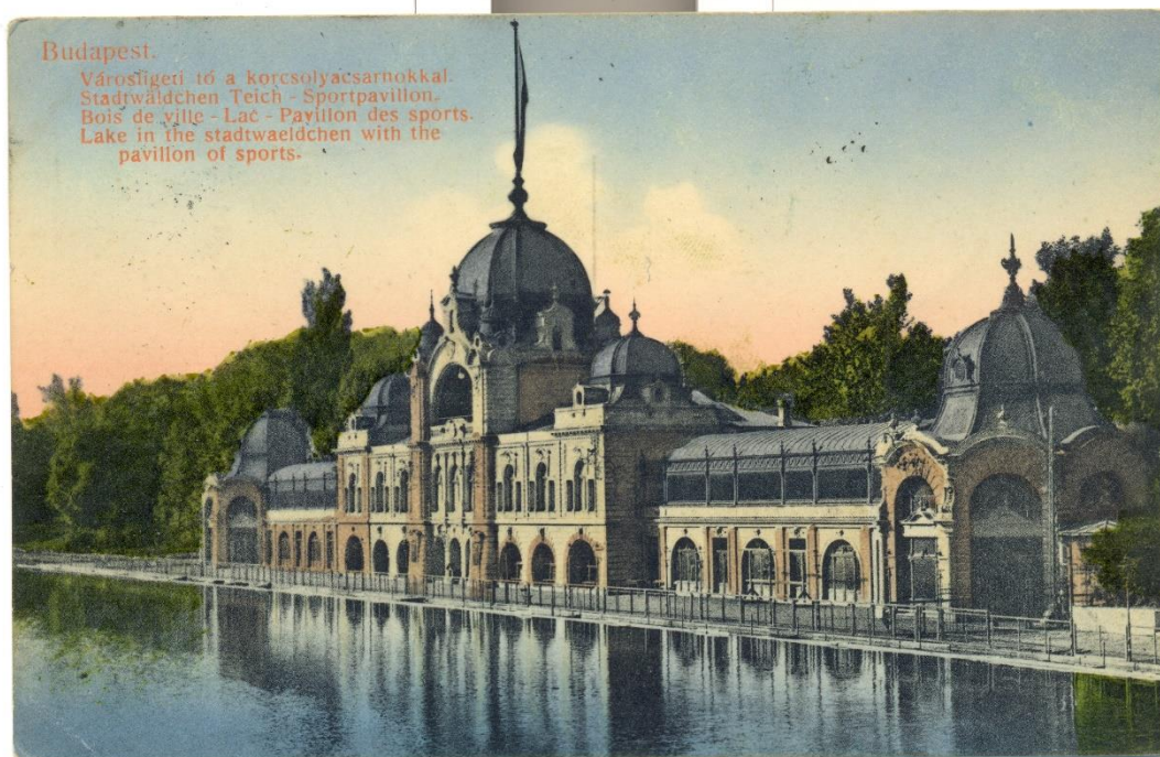
9. kép. A Városligeti-tó a Korcsolyacsarnokkal, 1914.