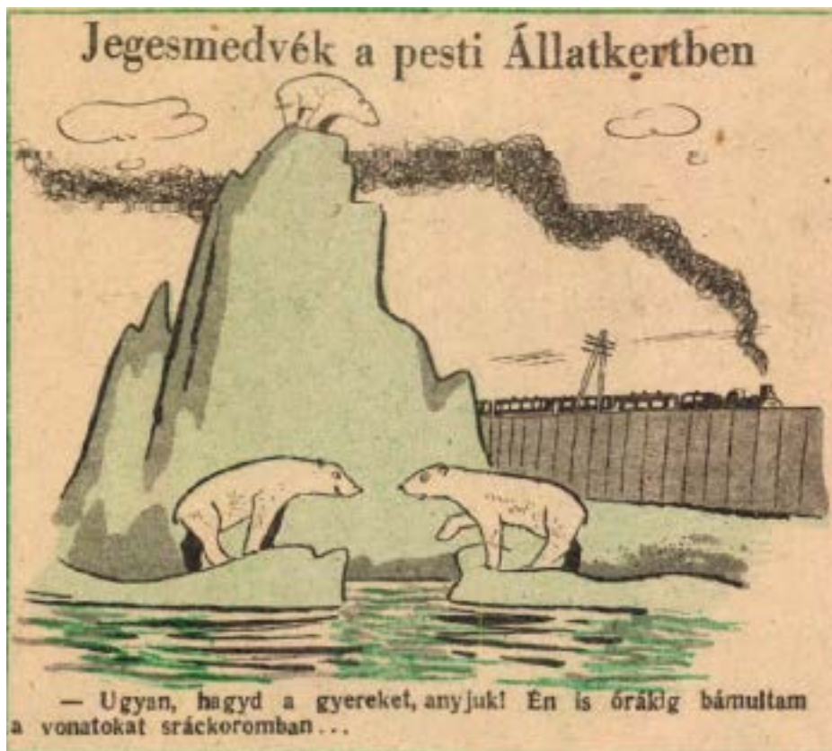
4. kép. Jegesmedvék a pesti Állatkertben: Az állatkert nyugalalmát 155 éve zavarja a közeli vasútforgalom. (Ludas Matyi, 6. (1950) 42. sz. 6. p.)

megkezdése előtt öt évvel jelezni fogja a terület visszakérésének igényét, amire végül sohasem került sor. 29