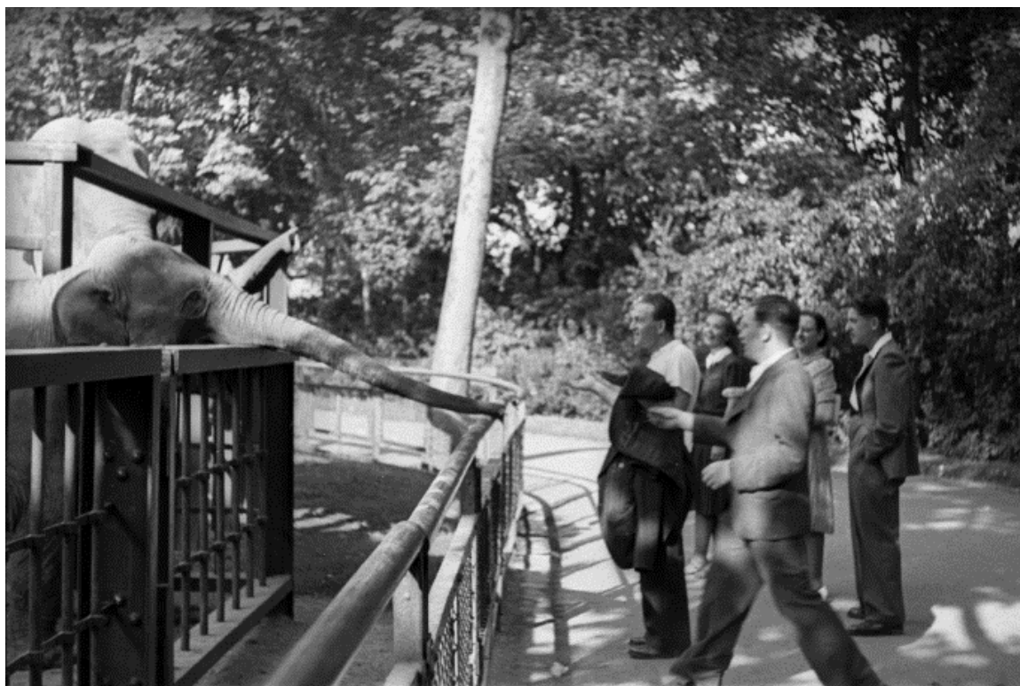
6. kép. Az Állatkert 1949-ben.