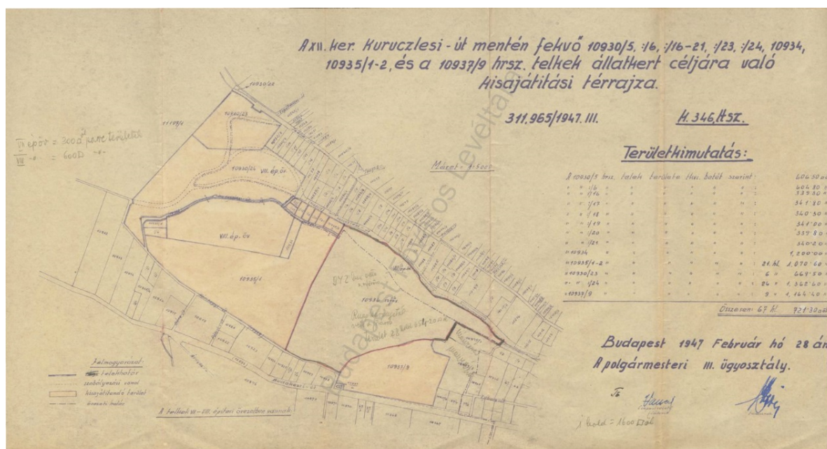
3. kép. Az új állatkert helyének szánt terület részletes térrajza 1947-ben. (HU BFL IV.1409.c XI. 1256/1945)