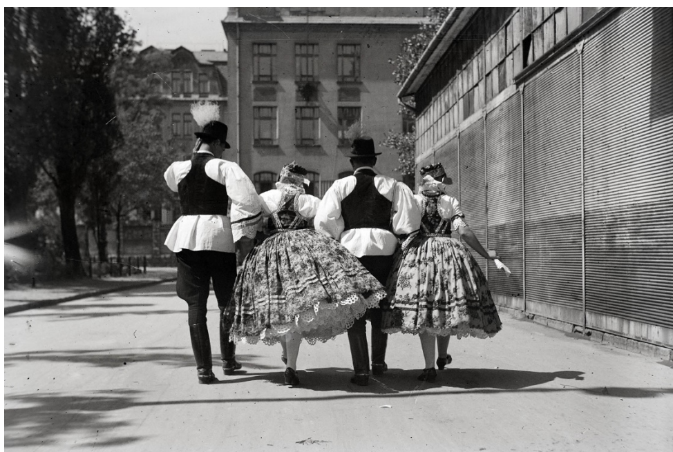
3. kép. Gyöngyösbokrétások 1940-ben a Tisza Kálmán téren (ma: II. János Pál pápa tér).

A Gyöngyösbokréta a mai Erkel Színházban (korábban Városi Színház, 1940-ben már Magyar Művelődés Háza) tartotta előadásait.