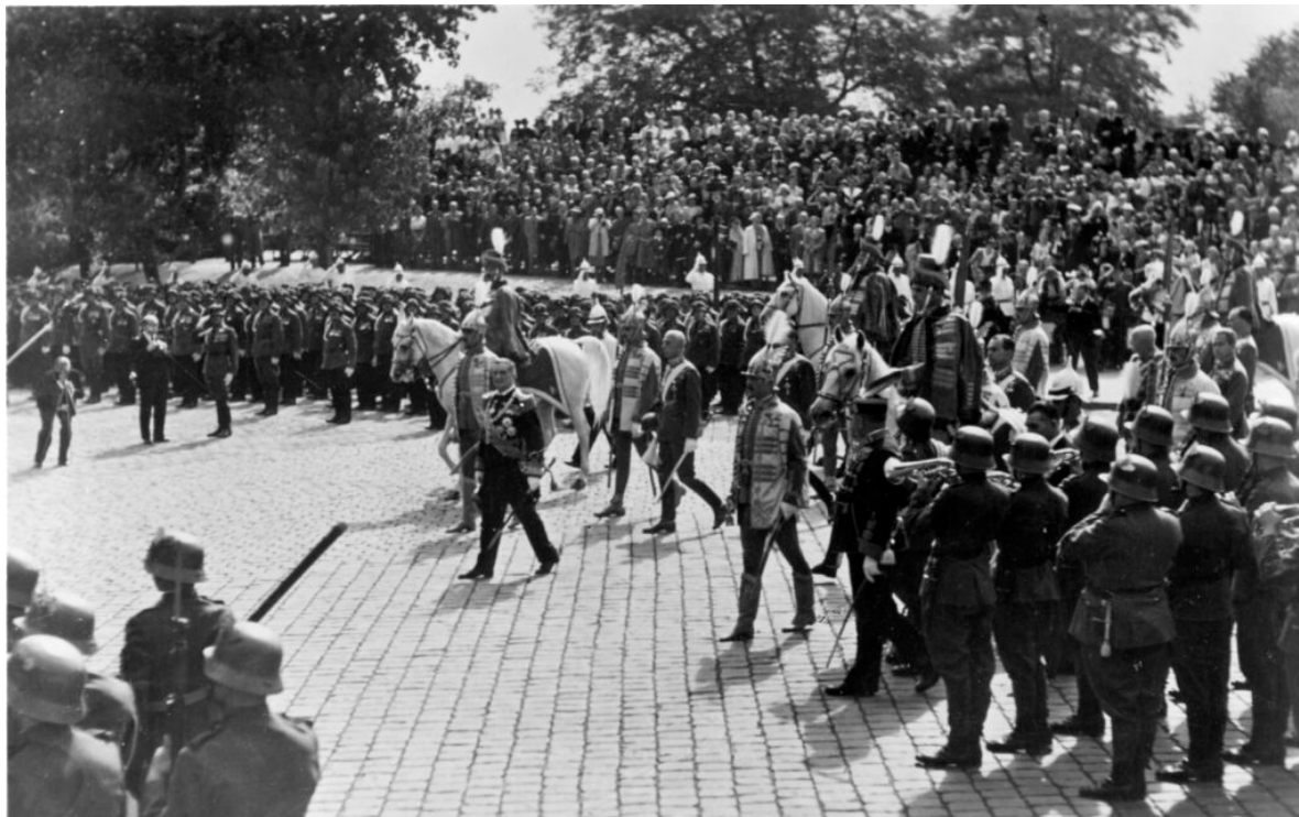
1. kép. Szentháromság tér, Szent István-napi ünnepség. Középen Horthy Miklós kormányzó a Magyar Királyi Testőrség tagjai között.

A Szent István-ünnep történetének újkori alakulásában, a kultusz megerősödésében és a budai Szent István-ünnep hagyományának megteremtésében a Habsburgok játszottak fontos szerepet. Ugyanakkor Mária Terézia, illetve József nádor főherceg intézkedései nyomán a Szent István-ünnep a 18–19. század fordulója körüli évtizedekben már nem kizárólag egyházi ünnepként kelt új életre. 1