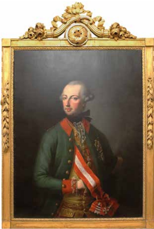
20. Joseph Hickel: II. József , 1779 Marosvásárhely, Maros Megyei Múzeum, ltsz. 866