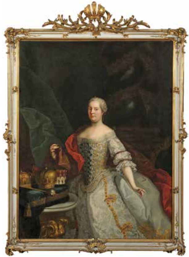
3. Johann Peter Kobler: Mária Terézia magyar koronázási díszruhában , 1758 Budapest, Budapesti Történeti Múzeum, Fővárosi Képtár, ltsz. KM 64.8.11

létre, s részben máig fennmaradt (2–7. kép). Az 1693-ban felállított intézmény az önálló tartományként működő Erdélyi Fejedelemség hivatalszervezetének élén állt, amely felügyelte az Erdélyi Főkormányzók működését, illetve közvetítette a Gubernium és az uralkodó között, így például előkészítette az uralkodóhoz felterjesztendő ügyiratokat. 12 A hivatal évtizedekig különböző bérelt épületekben működött Bécsben, majd 1755-ben az erdélyi kancellárrá frissen kinevezett (bethleni) Bethlen Gábor (1712–1768) megvásárolt egy épületet hivatala számára. 13 Választása a Magyar Udvari