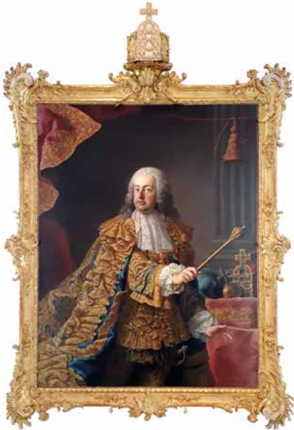
18. Martin van Meytens műhelye: Lotaringiai Ferenc , 1755 körül Budapest, Magyar Nemzeti Múzeum, Történelmi Képcsarnok, ltsz. 54.1