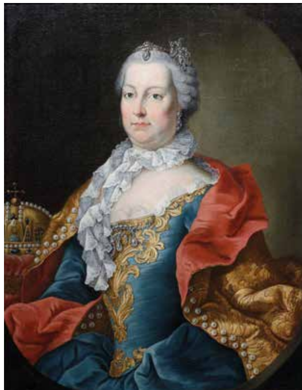
23. Ismeretlen festő: Mária Terézia , 1755 körül Kolozsvári Művészeti Múzeum, Itsz. MA 4806