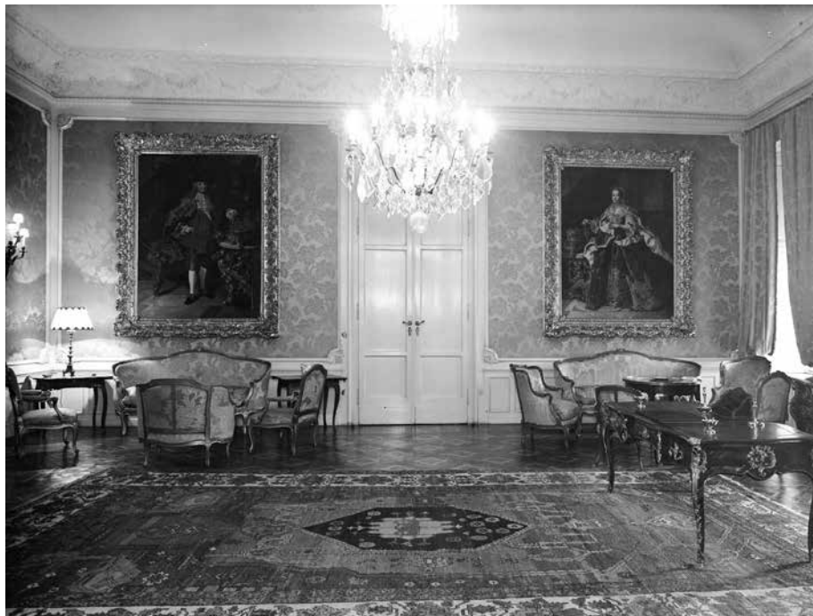
8. Ismeretlen fényképész: A budai Sándor-palota Vörös szalonja Lotaringiai Ferenc és Mária Terézia portréjával, 1940 körül Budapest, Magyar Építészeti Múzeum és Műemlékvédelmi Dokumentációs Központ, Fotótár, ltsz. 16.393.

alakos képmások később átkerültek a Magyar Udvari Kancellária épületébe, amely 1867-től a Király Személye Körüli Minisztériumnak, majd 1920-tól a Bécsi Magyar Királyi Követségnek adott otthont. 1946-ban Bécsből Budapestre szállították a képeket, ahol átmenetileg a Nemzeti Színház díszlektarában helyezték el őket, majd 1965-ben a Budapesti Történeti Múzeum Fővárosi Képtára gyűjteményébe kerültek, ahol ma is őrzik azokat. 22 Mária Terézia a pozsonyi