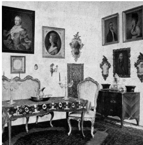
24. A sárosteri Teleki-kastély Mária Terézia-szobája, 1940 körül