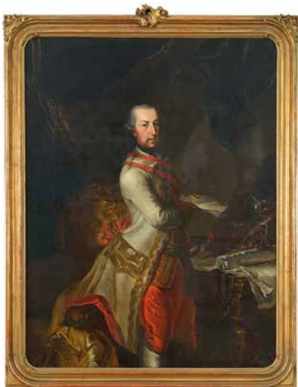
4. Ismeretlen festő: II. József osztrák tábornoki egyenruhában, 1780 körül Budapest, Budapesti Történeti Múzeum, Fővárosi Képtár, Iksz. KM 64.8.5

Az Erdélyi Udvari Kancellária első székházában, az egykori Sinzendorf-palotában a hivatali és reprezentációs helyiségek, valamint a kancellári lakosztály a második emeleten helyezkedtek el, míg az első emeleten lakószobák voltak. A második emeleti teremsorban több uralkodóportré is helyet kapott. Az 1759-es leltár szerint a lépcső melletti előszobát nyomott mintás vászontapétával kárpitozták, s a falakon Mária Terézia