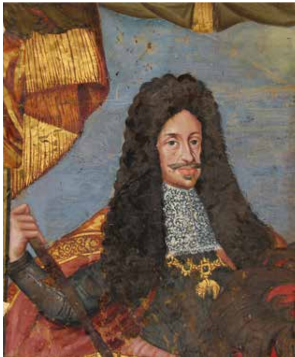
15. I. Lipót képmása a császár által Nagyszében városának adományozott zászló töredékén, 1695 körül Nagyszében, Muzeul Național Brukenthal, Itsz. VII-27

A három kolozsvári képmás az Erdélyi és a Magyar Udvari Kancellária bécsi palotája számára készült portrék másolataként, azok valamivel kisebb méretű „másodpéldányként” készült. II. Lipót portréját ugyanaz a bécsi mester, Johann Zitterer (1761–1840) festette 1791-ben,