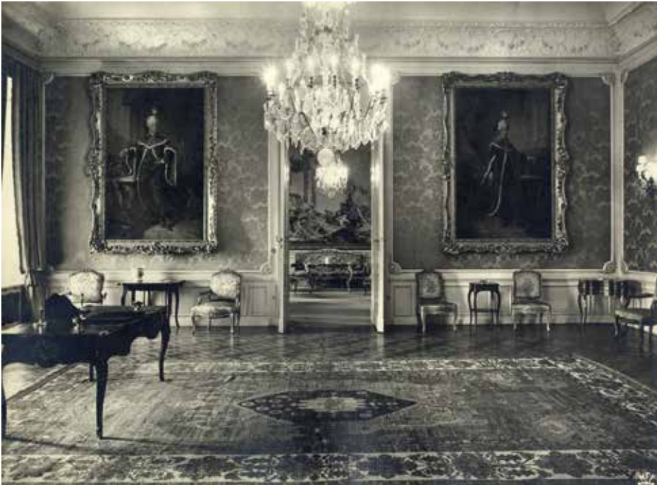
9. Ismeretlen fényképész a Magyar Film Iroda Rt.-től: A budai Sándor-palota Vörös szalonja az Erdélyi Udvari Kancelláriáról származó uralkodóportrékkal, 1940 körül Budapest, Magyar Nemzeti Múzeum, Fényképtár, ltsz. 91.946

Az Erdélyi Udvari Kancellária a későbbiek során a további Habsburg-uralkodók portréit is megrendelte székháza számára, amelyek szintén a Fővárosi Képtár gyűjteményébe kerültek. (Ezzel párhuzamosan a Magyar Udvari Kancellária tanácssterme számára is készült egy uralkodóportré-sorozat.) Az erdélyi kancelláriai együttes 1780 körül II. József osztrák tábornoki egyenruhás térdképével bővült, amely egy asztal mellett állva, kezében levélpapírral ábrázolja az uralkodót, mellette konzolasztalon a német-római császári, a magyar és a cseh királyi koronával (4. kép).