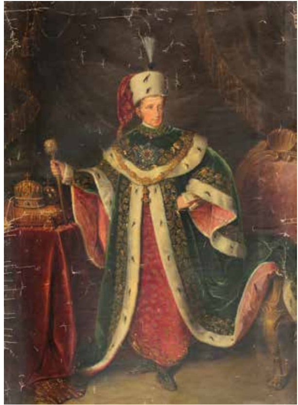
12. Ismeretlen festő: V. Ferdinánd a Szent István-rend ornatusában, 1840 körül Kolozsvár, Kolozsvári Művészeti Múzeum / Muzeul de Artă Cluj-Napoca, ltsz. FD 375

A 18. században az Erdélyi Főkormányzók ugyancsak megrendelte a Habsburg-uralkodók portréit tanácssterme számára, ahol a nyolc, majd később tizenkét tagú kormányzói tanács ülésezett. 34 A Gubernium kezdetben Gyulafehérváron, 1703–1790 között Nagyszébenben, majd pedig 1867. évi megszűnéséig Kolozsváron, a volt jezsuita újkollégium épületében működött, 35 amely a mai egyetem helyén állott a Farkas utcában. A Gubernium portrégalériája 1790-ben, a hivatal Kolozsvárra költözésekor VI. Károly, Mária Terézia, a társuralkodó Lotaringiai Ferenc és II. József aranyozott díszkerettel ellátott képmásaiból állt. A „fenséges fejedelmek” portréi 1790-ben Nagyszébenben maradtak, s az Erdélyi Országos Főbiztosság ( Supremus Commissariatus Provincialis Transylvanicus ) tanácsstermében kerültek elhelyezésre,