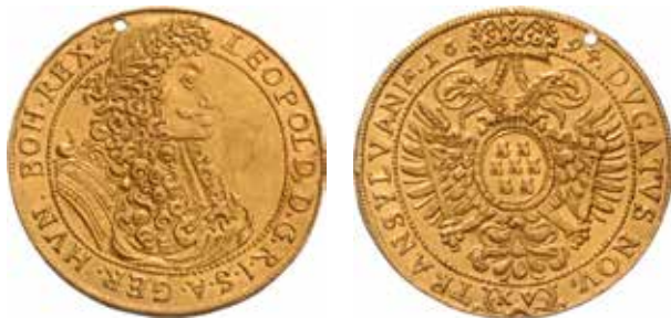
1. Arany ötdukátos I. Lipót képmásával és Erdély kétfejű sasos címerével. Kolozsvár, 1694 Budapest, Magyar Nemzeti Múzeum, Éremtár, ltsz. Jankovich 312

csempékkel díszített kihallgatási teremben, azaz „audiencia házban” 5 – elhelyezik a császár portróját. Sudores et cruces... című önéletrajzában így ír erről: „Hogy a király mintegy jelen volna Erdélyben, ezért [...] a kihallgatás és a tanácskozások színhelye, [...] ahol a baldachin állt a trónszékkel [...] a király számára, mintha ott lankék, üresen álljon, és a császár arcképe ugyanazon mennyezet alatt legyen, ahol azelőtt maguk a fejedelmek ültek, hogy szimbolikusan mindig elnököljön a tanácsban, és alattvalói megismerjék, tiszteljék őt.” 6 Bár minden jel arra utal, hogy a terv végül nem valósult meg, 7 Bethlen sorai jól érzékeltetik, hogy a kancellár imago típusú képként fogta fel az uralkodó portróját. 8 Ezen archaikus képfogalom szerint a kép nemcsak ábrázolja, hanem a szó szoros értelmében reprezentálja, azaz megjeleníti,