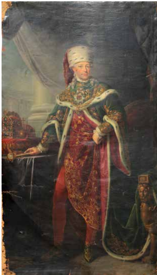
10. Johann Zitterer: II. Lipót a Szent István-rend ornátusában, 1791 Kolozsvár, Kolozsvári Művészeti Múzeum / Muzeul de Artă Cluj-Napoca, ltsz. FD 373