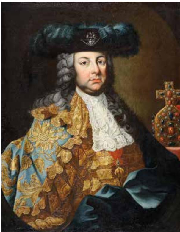
22. Ismeretlen festő: Lotaringiai Ferenc , 1755 körül Kolozsvári Művészeti Múzeum, Itsz. MA 4837