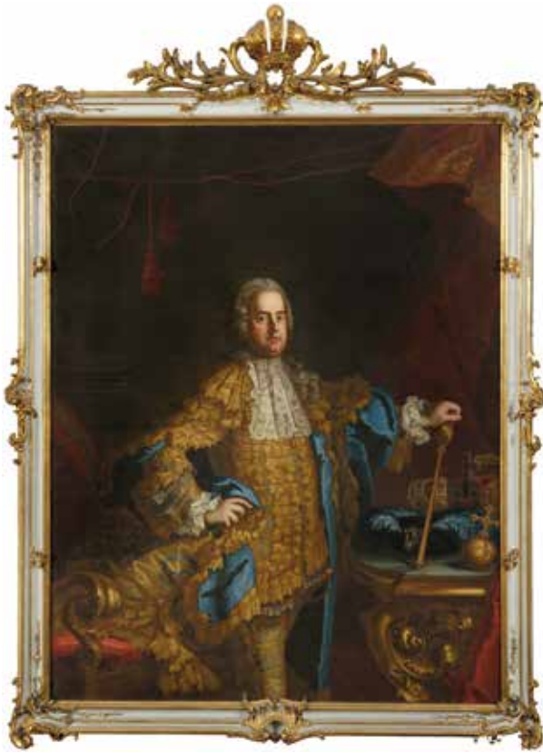
2. Johann Peter Kobler: Lotaringiai Ferenc Mantelkleidban , 1758 Budapest, Budapesti Történeti Múzeum, Fővárosi Képtár, ltsz. KM 64.8.6