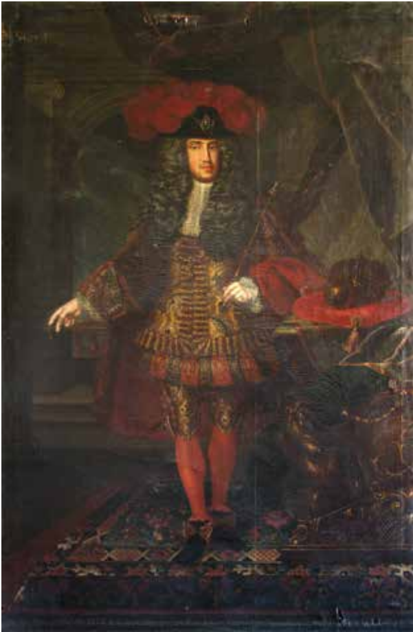
16. Ismeretlen festő: III. (VI.) Károly, 1713 Nagyszeben, Muzeul Național Brukenthal, ltsz. 136