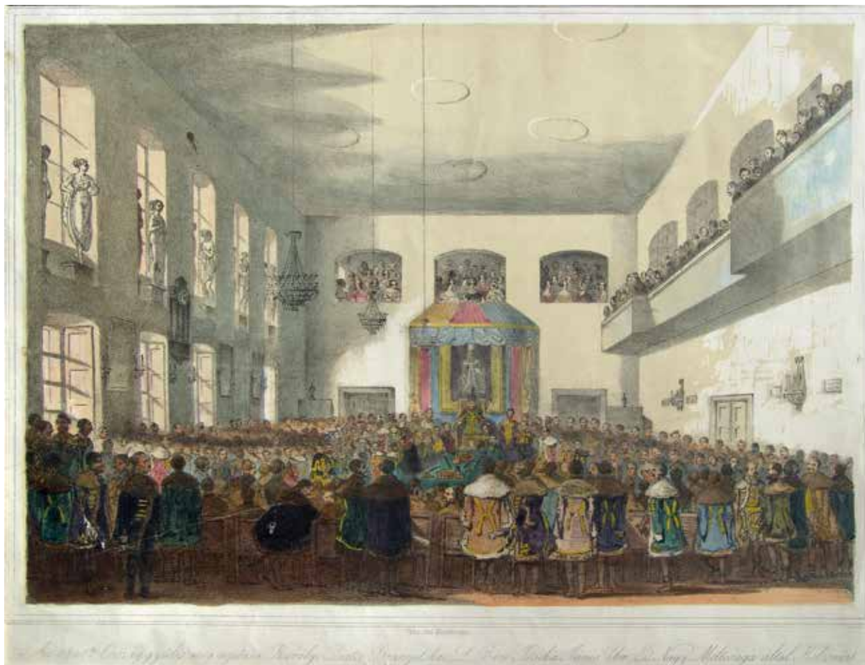
13. Szathmáry Pap Károly: Az 1841. évi erdélyi országgyűlés megnyitása a kolozsvári Redut báltermében, a baldachin alatt V. Ferdinánd portréjával Színezett litográfia

Kolozsvár, Erdélyi Történelmi Múzeum, Itsz. M 3574