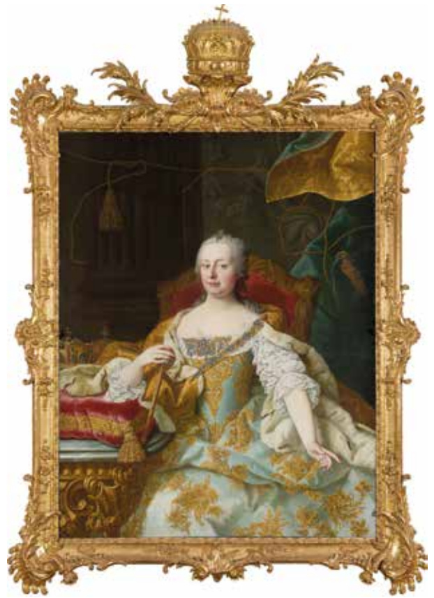
19. Martin van Meytens műhelye: Mária Terézia , 1755 körül Budapest, Magyar Nemzeti Múzeum, Történelmi Képcsarnok, ltsz. 54.2

ismertek, 71 ám feltételezhető, hogy a szászok hódolati szertartása az újonnan trónra lépett uralkodó előtt valamilyen módon az osztrák örökös tartományok ( Erb ) huldigung ceremóniáját imitálta.