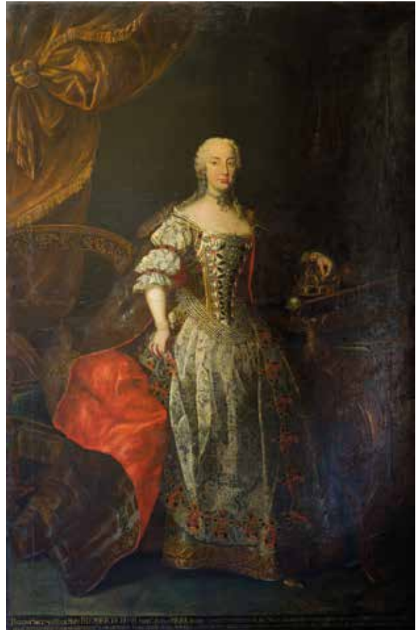
17. Veit Balthasar Henning: Mária Terézia mint magyar királynő, 1742 Nagyszeben, Muzeul Național Brukenthal, ltsz. 1402

ban az országgyűléseket a szokásjog szerint a király személyesen vagy az őt képviselő királyi biztos által nyitotta meg, aki ünnepélyes trónbeszédet követően átadta a rendeknek a királyi előterjesztéseket ( propositiones regiae ). Az erdélyi országgyűléseken a távol lévő uralkodót minden esetben királyi biztos képviselte, aki egy háromlépcsős, baldachinos emelvényen foglalt