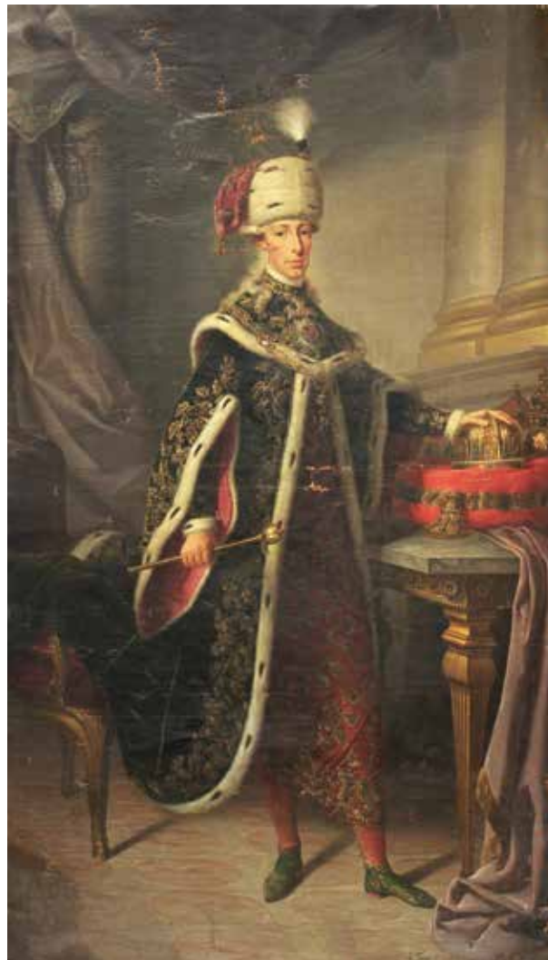
11. Johann Tusch: I. Ferenc a Szent István-rend ornátusában, 1793 Kolozsvár, Kolozsvári Művészeti Múzeum / Muzeul de Artă Cluj-Napoca, ltsz. FD 374

Erdélyi Udvari Kancellária Ferenc József portréját már nem rendelte meg. 1867-ben mindkét Kancellária megszűnt, szerepüket a továbbiakban a Király Személye Körüli Minisztérium töltötte be, amely a volt kancelláriai palotában működött.