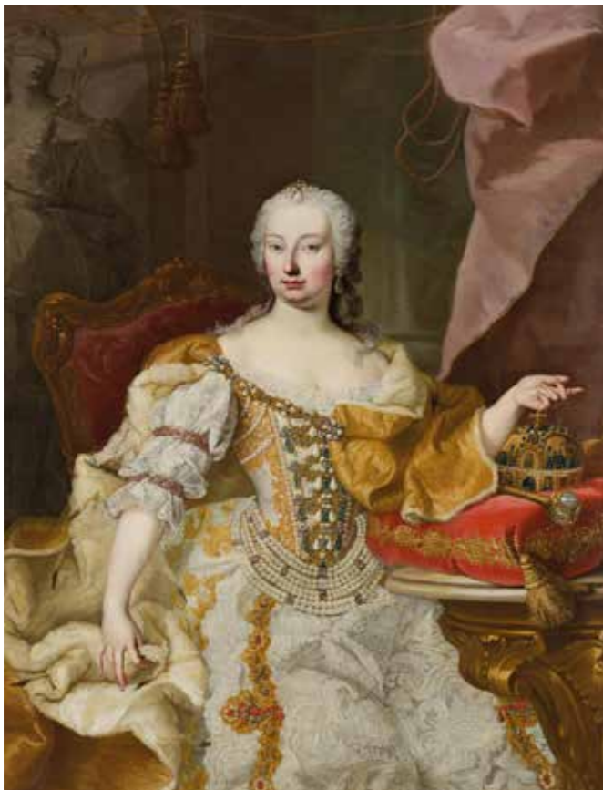
Mária Terézia magyar királynőként