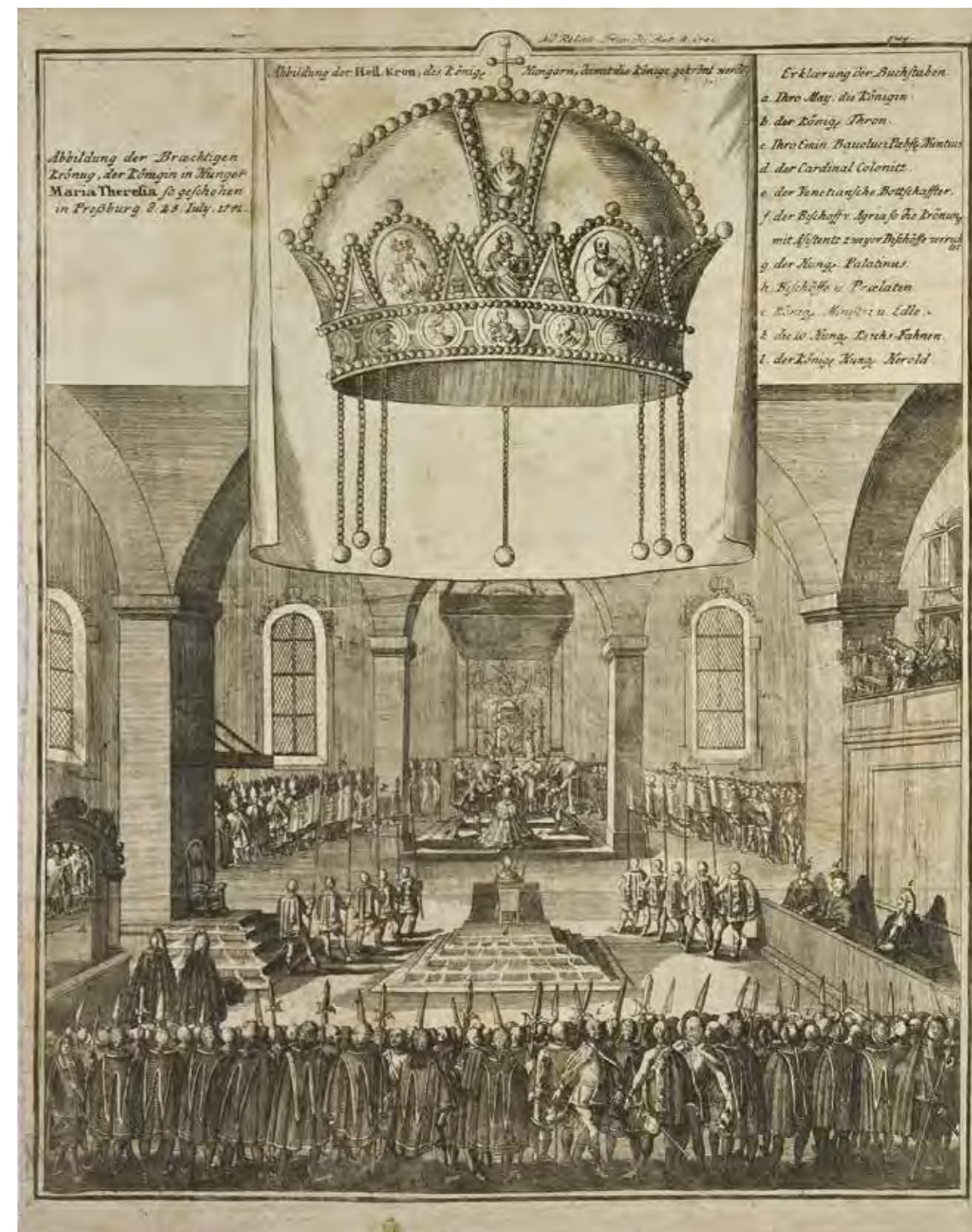
Mária Terézia megkoronázása a pozsonyi Szent Márton-templomban