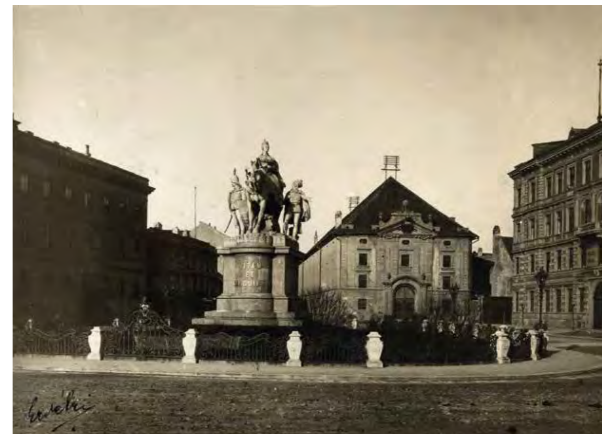
A pozsonyi Mária Terézia-emlékmű 1900 körül

Az emlékmű alig két évtizedig töltötte be rendeltetését: az 1918 óta deszkapalánkkal körülvett szobrot 1921. október 26-án éjjel – néhány nappal IV. Károly második visszatérési kísérlete után – csehszlovák légiósok egy csoportja ledöntötte és összetörte. A töredékek egy részét – a királynő és a két mellékalak fejét – néhány évvel később tisztázatlan körülmények között Magyarországra szállították, s a Magyar