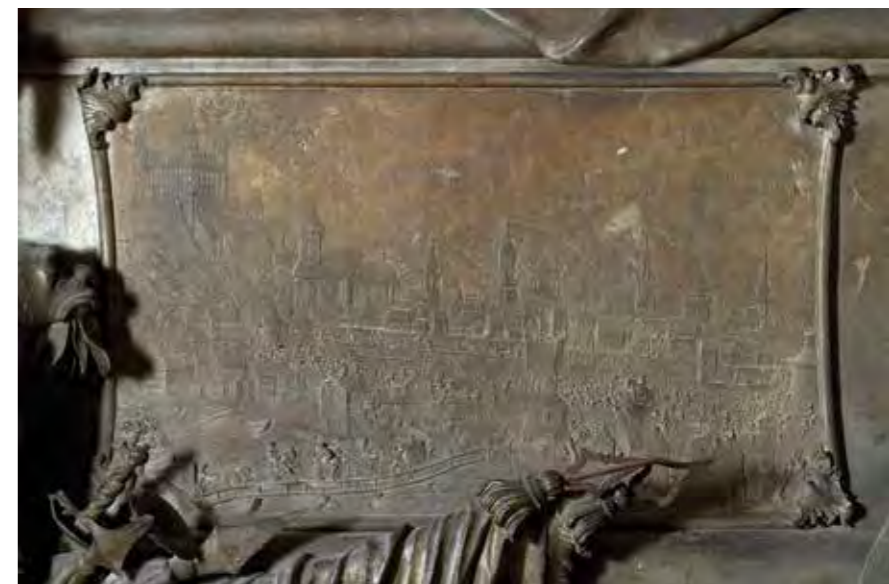
Mária Terézia pozsonyi koronázása Óndombormű az uralkodópár szarkofágján

Mária Terézia magyar királyi címének képi megjelenítésére leginkább a pozsonyi koronázási ceremóniát meglevenítő ábrázolások voltak alkalmasak. Így például egy Frankfurtban fél-évente kiadott hírlap 1741 őszi számában a po-