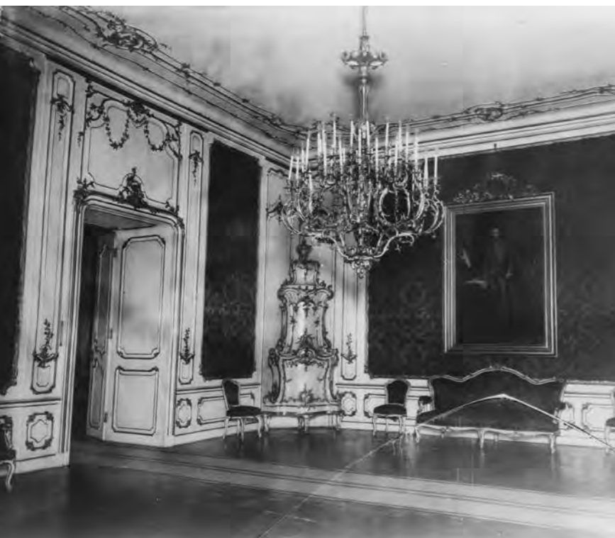
A budai királyi palota egykori királynői kihallgatási terme, 1930 körül

nyoma a retrospektív császárportré-sorozatoknak, ami azzal magyarázható, hogy azok a dinasztia hatalmának fiúági örökösödését hangsúlyozták volna, s ez a királynő számára politikai okokból nemkívánatos volt. 63