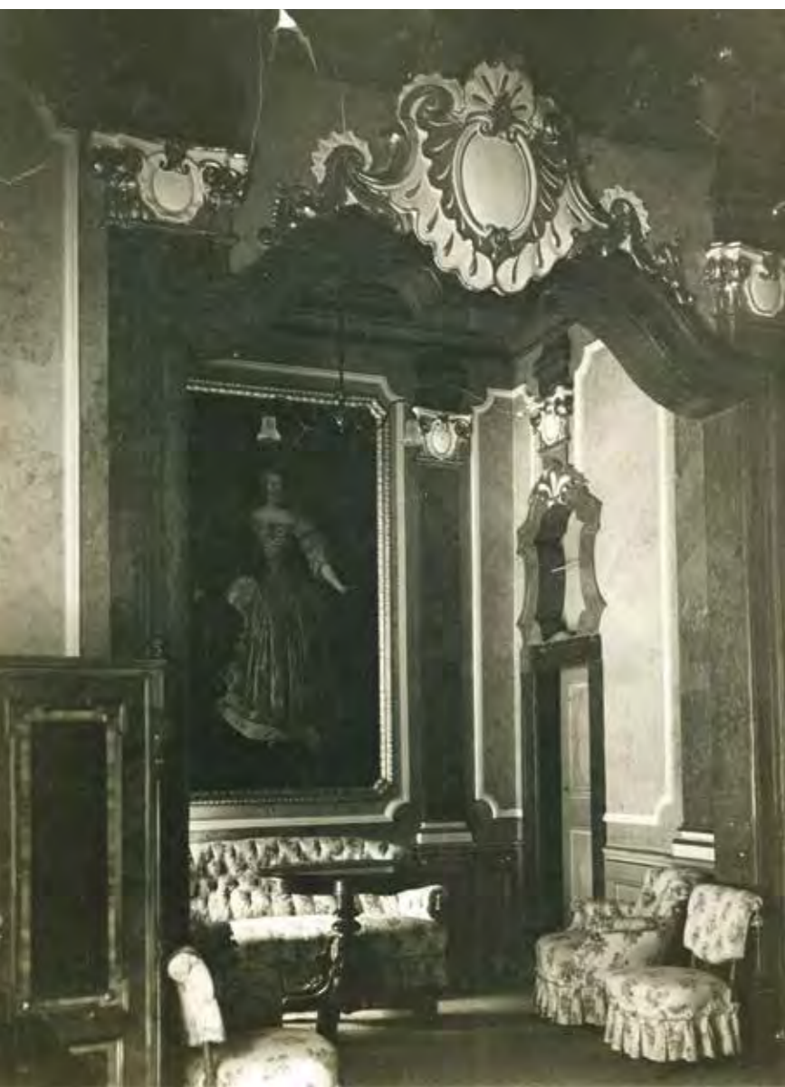
A gödöllői Grassalkovich-kastély Mária Terézia-szobája, 1940 körül

A gödöllőnél még inkább hányattatott sorsa volt az eszterházi kastély Mária Terézia-szobájának. A királynő 1773 szeptemberében látogatott el Esterházy „Fényes” Miklós (1714–1790) herceg nyári rezidenciájába, ahol a házigazda fényűző ünnepséget rendezett a királyi vendég tiszteletére. 97 A látogatást követően itt is megőrizték a királynő hálószobájaként szol-