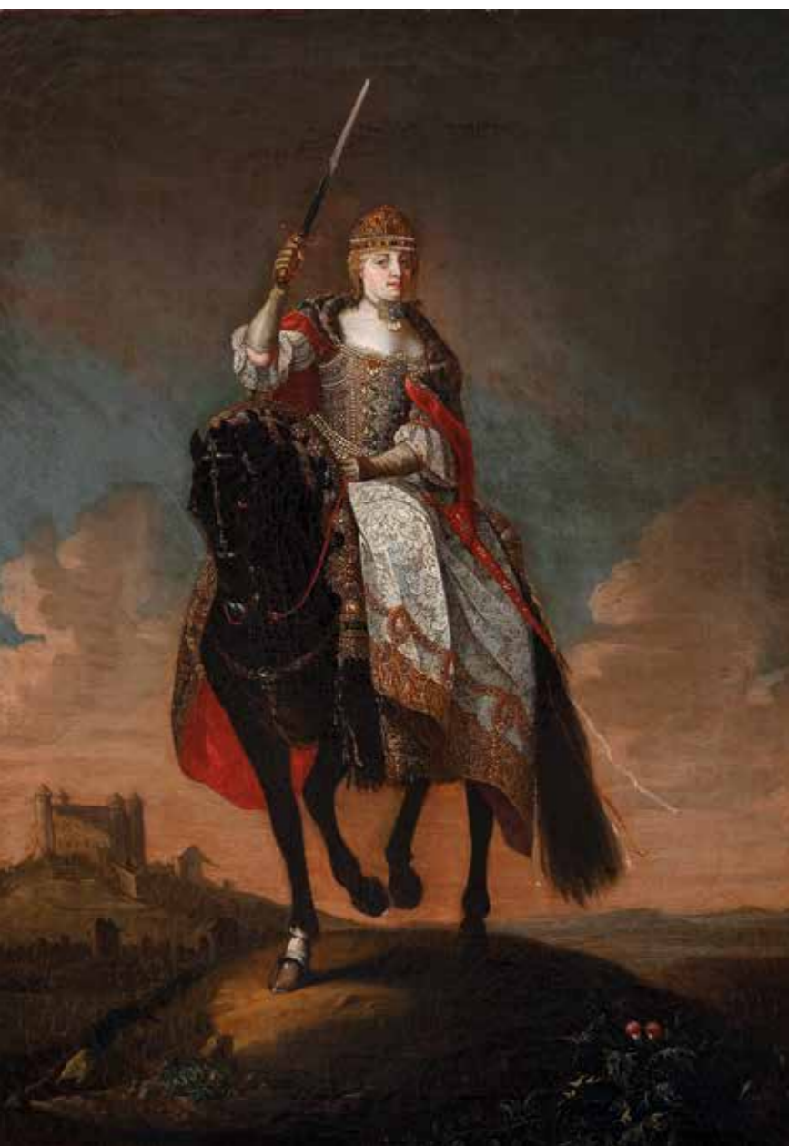
Mária Terézia kardvágása a pozsonyi koronázási dombon

térdelve a királynő Ego Maria Theresia Domina et Rex Hungariae profiteor et promitto coram Deo... szavakkal tett tanúbizonyságot hitéről, majd a szertartás végén a rendek Vivat domina rex noster , 24 azaz „Éljen (úr)asszonyunk és királyunk!” felkiáltással köszöntötték új uralkodójukat. 25