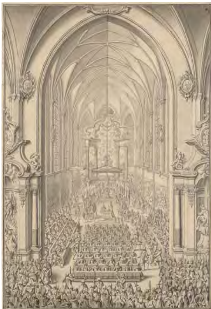
Mária Terézia megkoronázása a pozsonyi Szent Márton-templomban

Terézia pozsonyi koronázásáról, amihez előfizetőket keres. 8 A kötet végül ismeretlen okból nem jelent meg, a felhívás szövegéből azonban kiderül, hogy Kleiner egy hónappal korábban részt vett a pozsonyi koronázáson, s lerajzolta annak jeleneteit. Elképzelhető, hogy ekkor készült az a Párizsban őrzött nagy méretű tusradz, amely a Szent Márton-templom szentélyét ábrázolja Mária Terézia koronázásának jelenetével. (Lásd 209. o.)