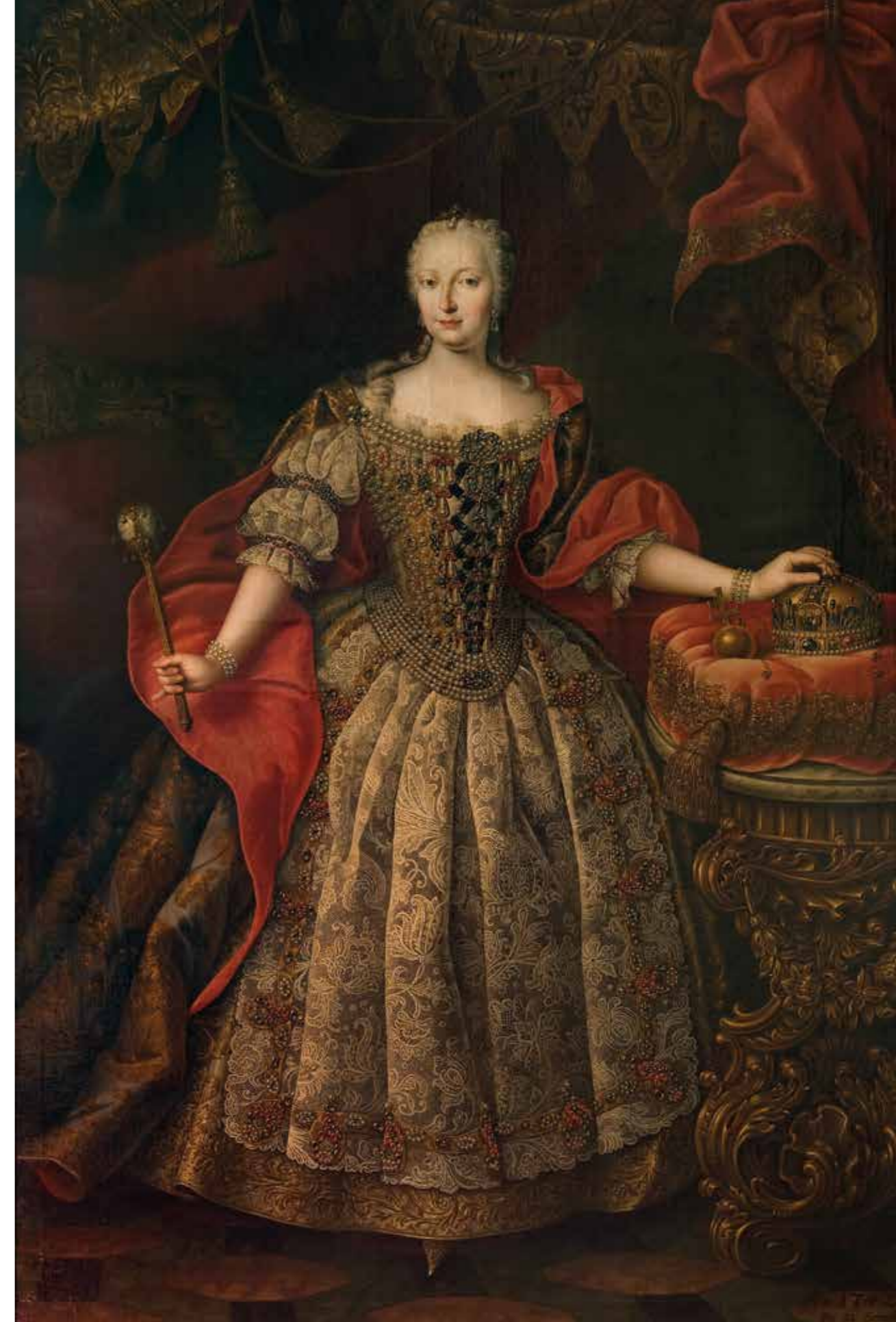
Mária Terézia magyar királynőként

Mária Terézia koronázási portréja az 1740-es években szinte ikonikus kifejezőeszközzé vált a királynő magyar uralkodói címének. A képtípus nemcsak festményeken és rézmetszeteken, hanem pénzérméken és különféle iparművészeti tárgyakon is megjelent. Így például a Körmöcbányán 1741-től vert arany dukáton Mária Terézia álló alakja látható a koronázási díszruhában, fején koronával, baljában országalmával, jobbában jogarral, oldalán karddal. Ugyanez a motívum szerepel egy egykorú damaszterítón is, haditrófeákkal és kétfejű sasokkal körülvéve.