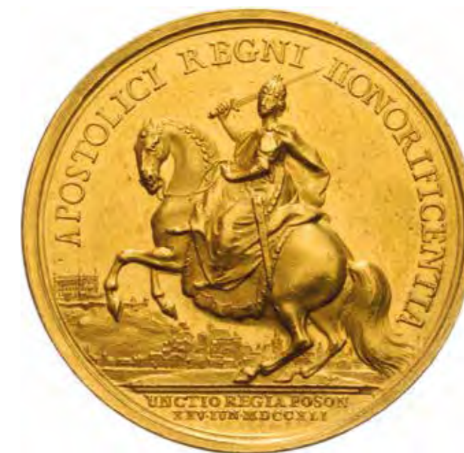
Mária Terézia kardvágása, koronázási emlékérem hátoldala