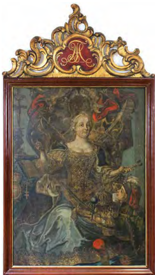
Magyarország hódolata Mária Terézia előtt