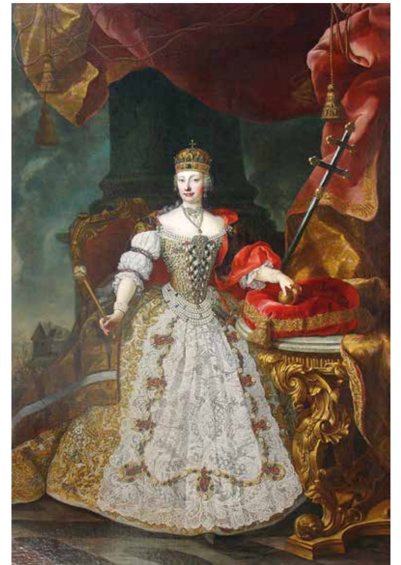
Mária Terézia magyar koronázási ornátusban