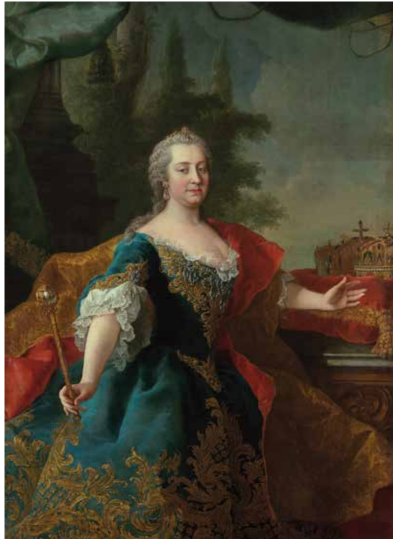
Mária Terézia magyar királynőként

tóber 4-én Lotaringiai Ferencet német-római császárrá koronázták. A város több pontján diadalkapukat emeltek, egyes épületek homlokzatán pedig festett emblémákat és jelképes ábrákat helyeztek el. A Grabenről a Hofburg felé vezető Bräunerstrasse egyik házában egy olyan kép függött, amely Ausztria megmentőjeként, lóháton, huszáruniformisban, kezében kivont karddal, közel életnagyságban ábrázolta Mária Teréziát. 47