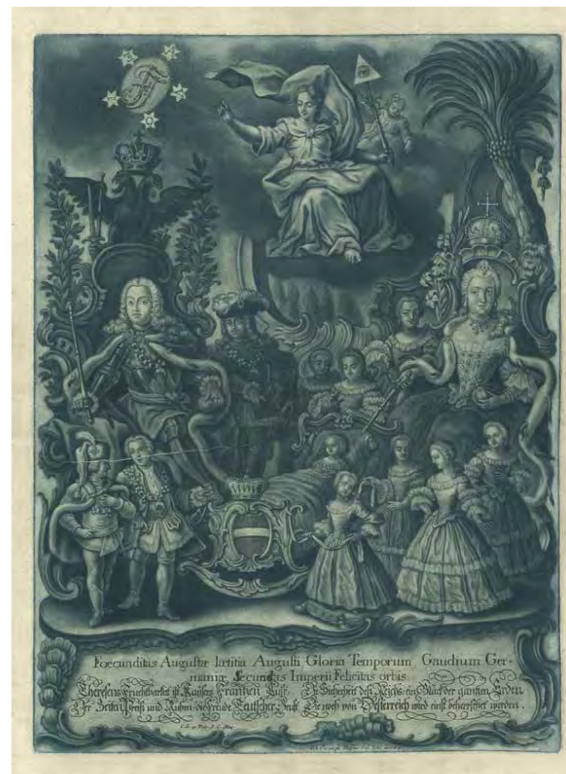
Mária Terézia és családja

Az 1750-es évek elejétől számos Habsburg-rezidenciában elhelyezték a császári családot ábrázoló csoportképeket, amelyek gyermekeiktől körülveve jelenítik meg az uralkodópárt. Lotaringiai Ferenc halálát (1765) követően ezeket fokozatosan a császári család tagjait önállóan ábrázoló portrégalériák váltották fel. Ilyen portrészorozatok kaptak helyet 1760 körül a pozsonyi, 1766-ban a budai, majd 1770-ben az innsbrucki és a prágai királyi palota uralkodói lakosztályának különböző reprezentációs tereiben, amelyek gyakran Familienzimmer néven szerepelnek a korabeli forrásokban. 60 Ezen termek képi programja tehát radikálisan eltért a Habsburg-rezidenciák korábbi „ősgalériáinak” ikonográfiai hagyományától, amelyek a korábbi Habsburg-házi német-római császárok reprezentatív portréinak sorával a dinasztia múltbéli dicsőségét hirdették, s ezáltal egy „múltba tekintő”, azaz retrospektív legitimációs törekvést képviseltek. 61 Hasonló portrészorozatok kaptak helyet az osztrák kolostorok 17. századi Kaisersaal jaiban is. 62 Ezekről eltérően a Habsburg–Lotaringiai-ház családi portrégalériái nem a Habsburg-ház múltját dicsőítették, hanem az új dinasztia felvirágzását hirdették. Mária Terézia rezidenciáiban nincs