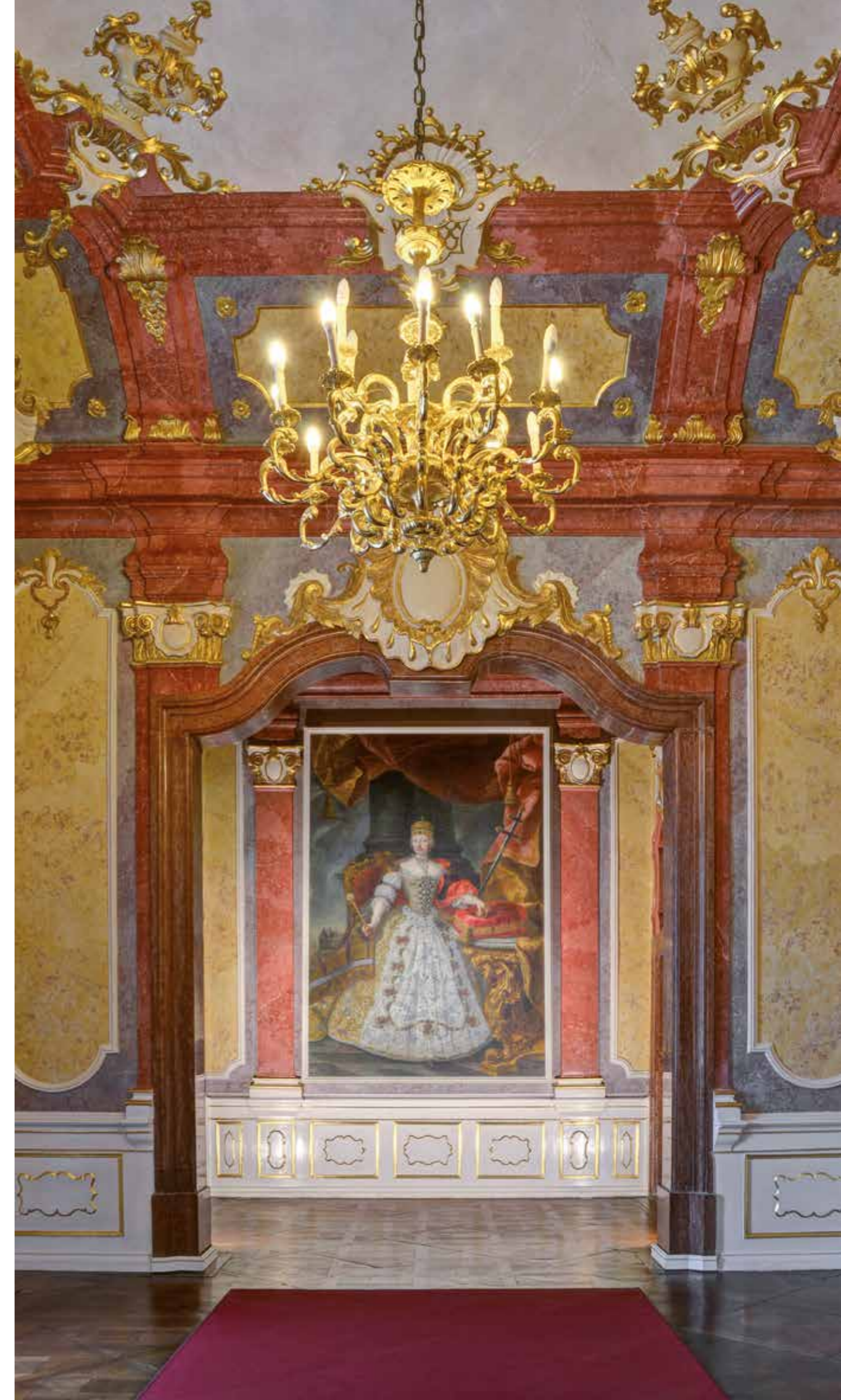
A gödöllői Grassalkovich-kastély Mária Terézia-szobája

Miután a kastély 1867-ben a magyar állam tulajdonába került, s az uralkodópár nyaralókastélyává alakították át, a Mária Terézia-szobában Erzsébet királyné hálószobáját rendezték be. A királynő baldachinos ágyának – amely 1854-ben egy betörésben megrongálódott – ekkor nyoma veszett, helyén Erzsébet királyné „egyszerű vaságyát” helyezték el. 95 Mária Terézia portróját 1867-ben az alkóv falán helyezték el, 96 ám ennek is nyoma veszett 1944/45-ben. (Lásd 238. o.)