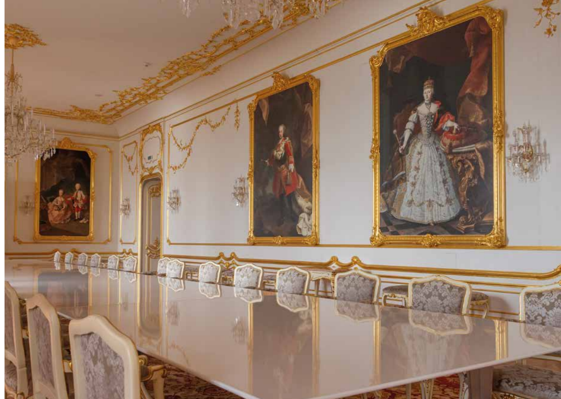
A pozsonyi vár rekonstruált díszterme Mária Terézia családjának portréival

Egy ilyen portrégaléria kapott helyet 1760 körül a pozsonyi vár dísztermében is, amely Mária Terézia és Lotaringiai Ferenc ekkor (1756–1761 között) életben lévő tizenhárom gyermekét ábrázolta. 65 Az 1781. évi leltár szerint a teremben öt egész alakos, életnagyságú képmás, valamint négy csoportportré kapott helyet: önálló portrén jelent meg Mária Terézia (magyar koronázási díszruhában), II. József (a Szent István-rend ornátusában), a császár második felesége, Mária Jozefa főhercegnő, valamint Mária Krisztina főhercegnő és férje, Albert herceg, királyi helytartó. A négy csoportportré az uralkodópár tizenegy további (ekkor élő) gyermekét ábrázolta. A szomszédos kihallgatási teremben az 1765-ben elhunyt Lotaringiai Ferenc császár, II. József 1763-ban