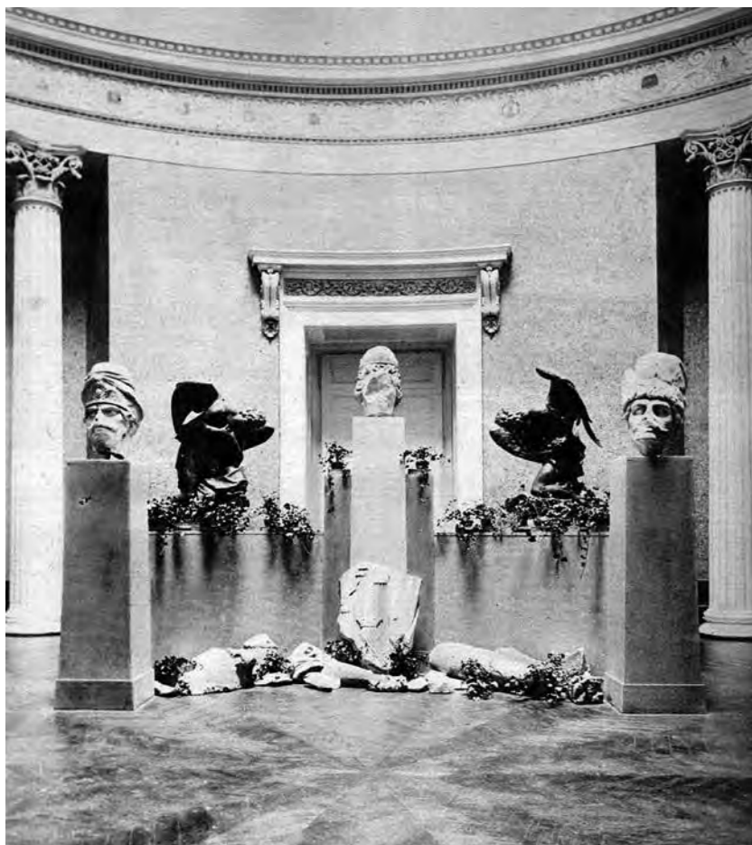
A pozsonyi Mária Terézia-emlékmű töredékei 1928-ban

Nemzeti Múzeum gyűjteményében helyezték el, majd 1928-ban egy új szerzeményi kiállításához kapcsolódóan a múzeum kupolatermében állították ki. 75 Két hónappal később Hóman Bálint, a múzeum igazgatója javaslatot tett arra, hogy „a töredékeket mai csonkaságukban hagyva egy művészien kiképzett stílszerű keretben, a Nemzeti Múzeum kertjében” állítsák fel, mert „ezzel a megoldással a szétdarabolt remekműnek nemzeti és muzeális jellege is kidomborodnék!” 76 A terv végül nem valósult meg, a szobor töredékeit ma a Magyar Nemzeti Galéria raktárában őrzik. 77