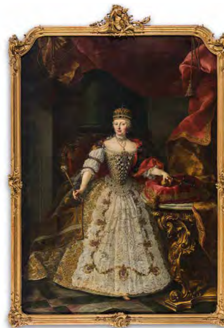
Mária Terézia magyar királynőként

Mária Terézia koronázási portréi nagyfokú hasonlóságot mutatnak, ami arra enged következtetni, hogy azok egyazon őstípus másolatai és variánsai. Ez a feltételezett prototípus talán azzal a portréval azonosítható, amelyik egykor a pozsonyi vár lovagtermében függött, majd 1781-ben – miután Albert Kázmér herceg és Mária Krisztina Pozsonyból Brüsszelbe költözött – Bécsbe szállították, ahol máig őrzik. 36 A rendkívül jó minőségű kép fiatal vonásokkal, a koronázási díszruhában ábrázolja Mária Teréziát, akinek magyar királyi rangját a fején ábrázolt Szent Korona mellett a válláról aláhulló koronázási palást, a jobbáiban tartott jogar, valamint a balján bársonypárnára helyezve látható országalma és koronázási kard is jelzi. A kép párdarabja hadvezérként, mellvértben, még császári jelvények nélkül jeleníti meg Lotaringiai Ferencet. Mindezek alapján a portrétípus az 1741–1745 közötti évekre datálható, s egy szignált prágai félalakos Mária Terézia-portréval mutatkozó stílári hasonlóságok alapján Martin van Meytens (1695–1770) udvari portréfestőnek tulajdonítható. 37 A képek tehát nem sokkal az 1741-es koronázást követően udvari megrendelésre készülhettek, feltehetően a pozsonyi vár lovagterme számára. A portrétípus bal oldali darabja szokatlan módon nem a férjet, hanem a feleséget ábrázolja, ami talán azzal magyarázható, hogy Lotaringiai Ferenc 1745. évi császárrá koronázásáig Mária Terézia magyar és cseh királynőként rangban hercegi rangú férje