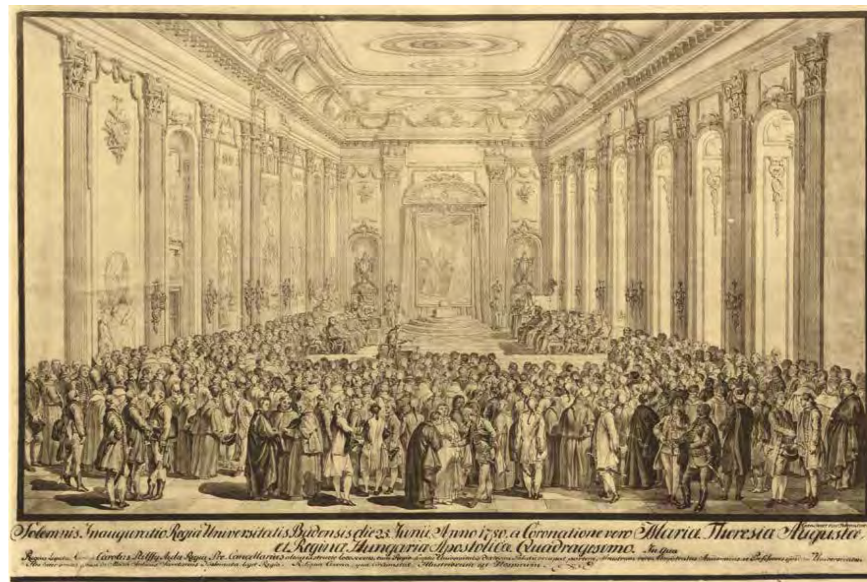
A Budai Királyi Egyetem megnyitó ünnepsége

Az uralkodópár és II. József hasonló módon jelenik meg az innsbrucki Hofburg dísztermének rövidebb falán elhelyezkedő három egész alakos portrén, 56 itt azonban Lotaringiai Ferenc a német-római császári koronázási ornátusban látható. 57