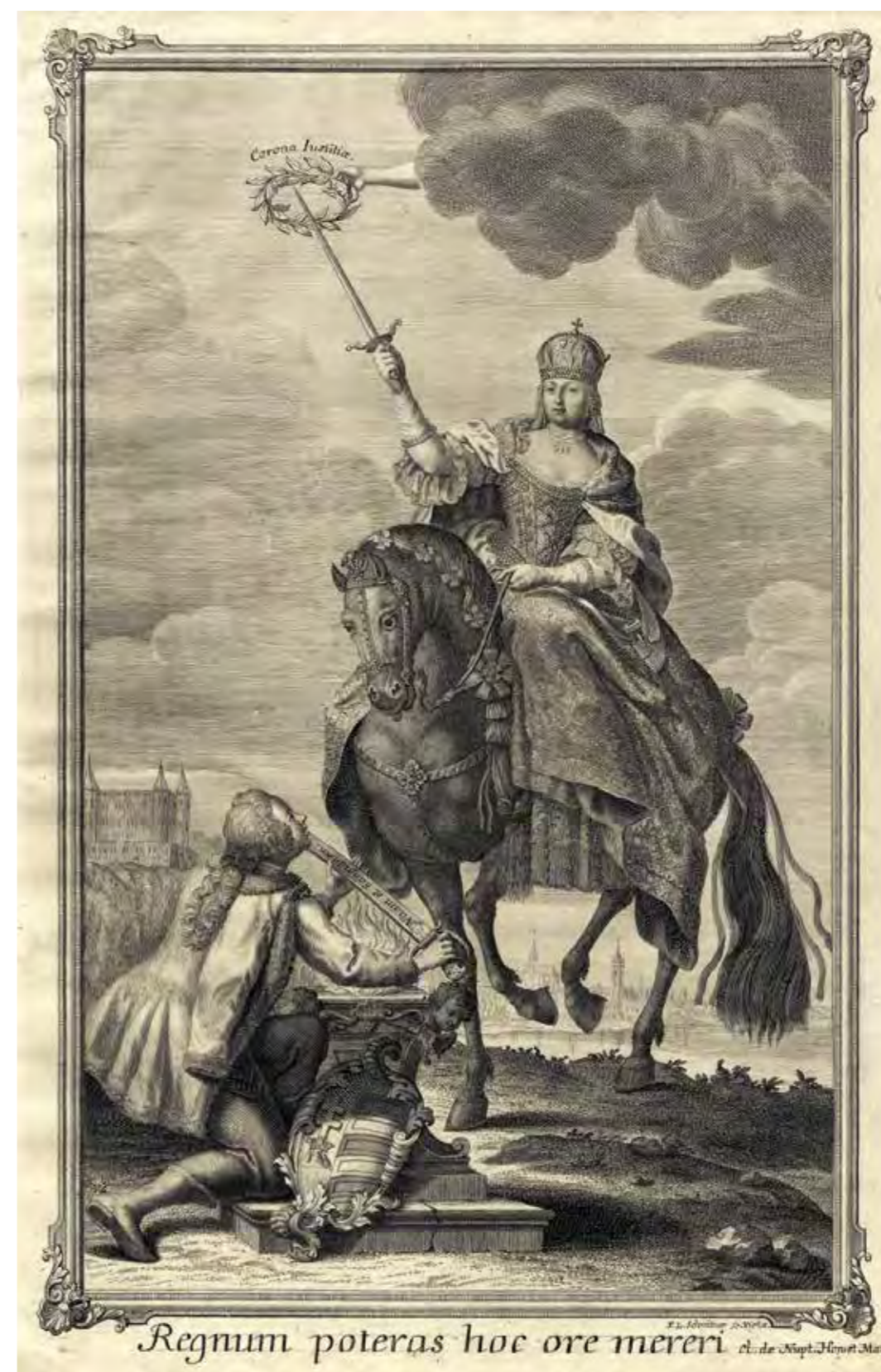
Mária Terézia lóháton, magyar nemesel

Az osztrák örökösödési háború idején készült metszeteken gyakran jelenik meg Mária Terézia lóháton, a császári sereg legfőbb hadúrnökjeként, rendszerint az őt hűségesen szolgáló magyar huszárok kíséretében. A magyar koronázási jogart gyakran lefelé fordítva, mintegy marsallbotként tartja kezében, mint például az augsburgi Johann Elias Ridinger rézmetszetén. (Lásd 94. o.) A királynő hadvezéri szerepét hirdette egy effer dekoráció is 1745. október 27-én Bécsben. Ezen a napon nagyszabású ünnepséget tartottak a császárvárosban abból az alkalomból, hogy az uralkodópár visszatért Frankfurtból, ahol ok-