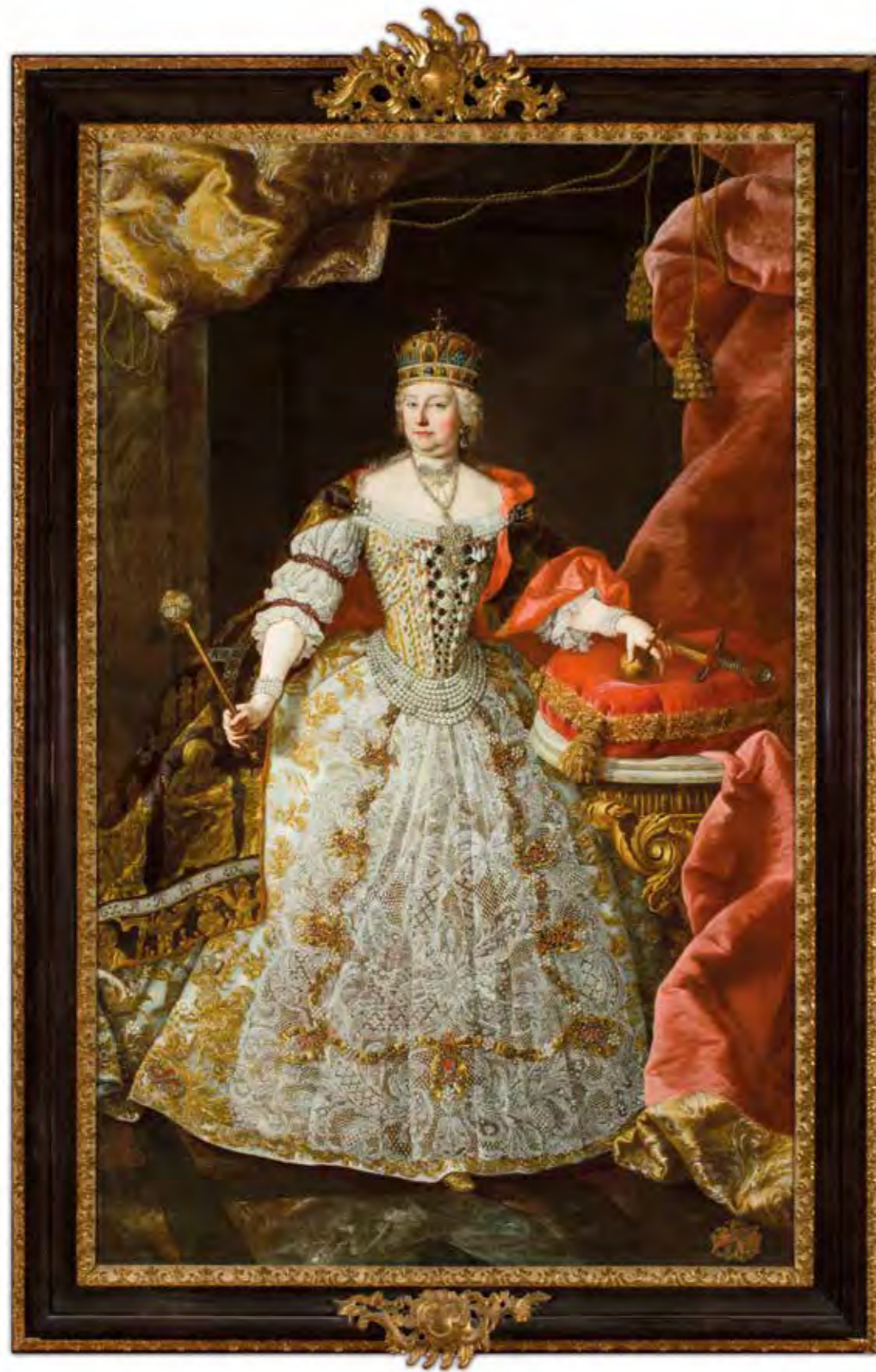
Mária Terézia mint magyar királynő

mény, amely 2008-ban budapesti magántulajdonból került a Gödöllői Királyi Kastély gyűjteményébe. A koronázási jelvények együttese itt a koronázási kereszttel is kiegészült, amely a valóságtól eltérően apostoli kettős keresztként jelenik meg. 40 A koronázási portrék szobrászati adaptációjának tekinthető Franz Xaver Messerschmidt 1766-ban készült szobra. A bécsi mester a Stallburgban elhelyezett császári képtár számára készítette el az uralkodópár életnagyságú ónszobrait, amelyek Lotaringiai Ferencet császári koronázási ornátusban, Mária Teréziát pedig magyar koronázási díszruhában jelenítik meg. 41