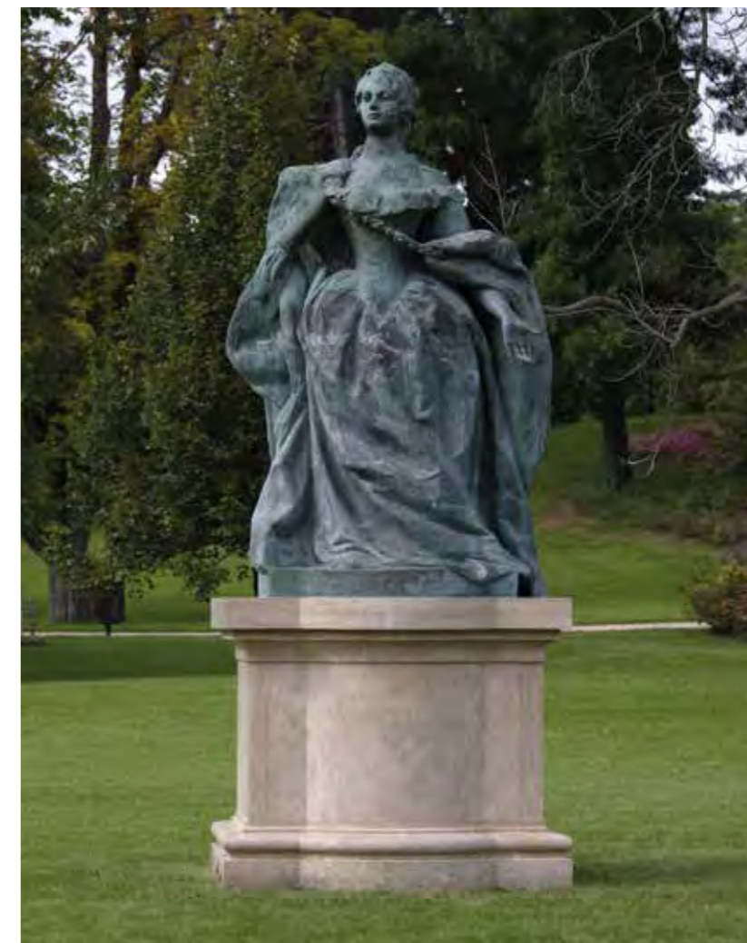
A millenniumi emlékmű egykori bronzszobra