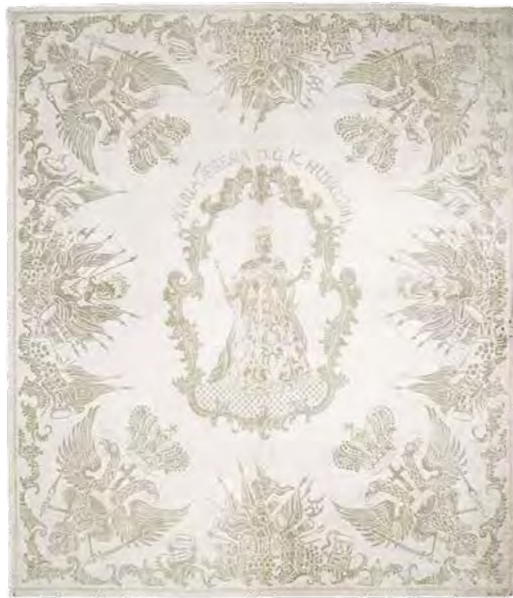
Damaszterítő Mária Terézia alakjával

Mária Terézia koronázási portréiból számos fél- vagy háromnegyed alakos változat is készült. Ilyen például az a festmény, amely egykor a pápai Esterházy-kastély berendezéséhez tartozott, s az 1799. évi ingóságeltár szerint a „vörös stráfos kávézó szoba” falán függött párdarabjával, Lotaringiai Ferenc portréjával együtt. 46