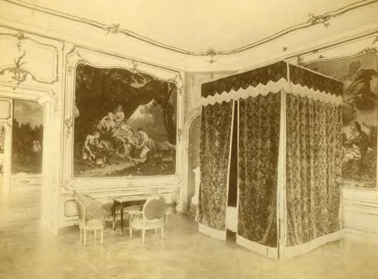
Az eszterházi Esterházy-kastély Mária Terézia-szobája 1894 körül