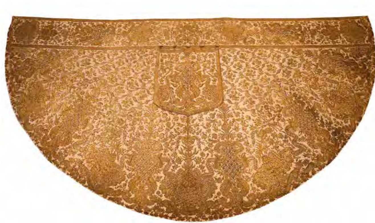
Mária Terézia koronázási díszruhájából készült pluviálé

A királynő koronázási díszruhájához a korabeli magyar nemesi női viselet szolgált modellként. Ennek jellegzetes elemei a bő szabású, sűrűn redőzött szoknya és a csipkekötény, valamint