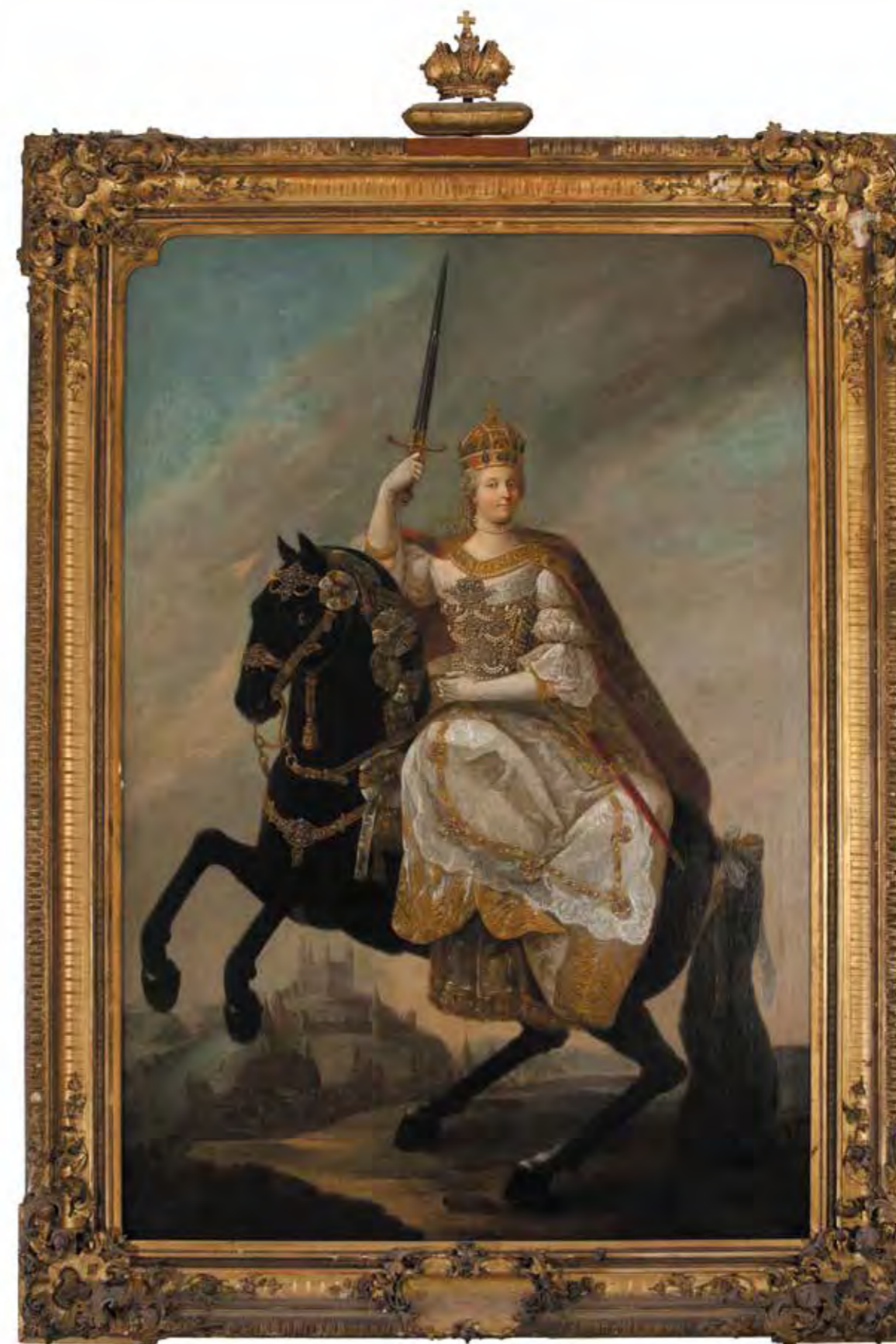
Mária Terézia koronázási kardvágása

Mária Terézia női mivoltának és a királyi hatalom férfias jellegének kettőssége jutott kifejezésre a pozsonyi koronázási szertartás során is: a ceremónia kezdetén, a főoltár legelső lépcsőjén