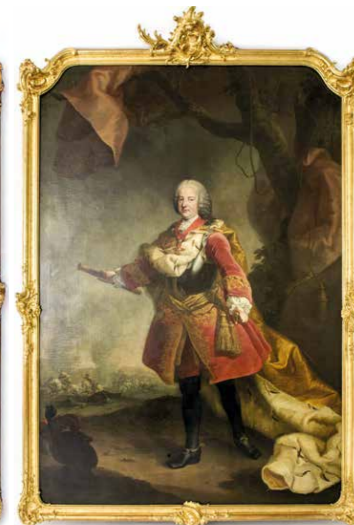
Lotaringiai Ferenc hadvezérként

fölött állt. Az 1745 után festett portrétípusokon Mária Terézia rendszerint már a jobb oldalon jelenik meg.