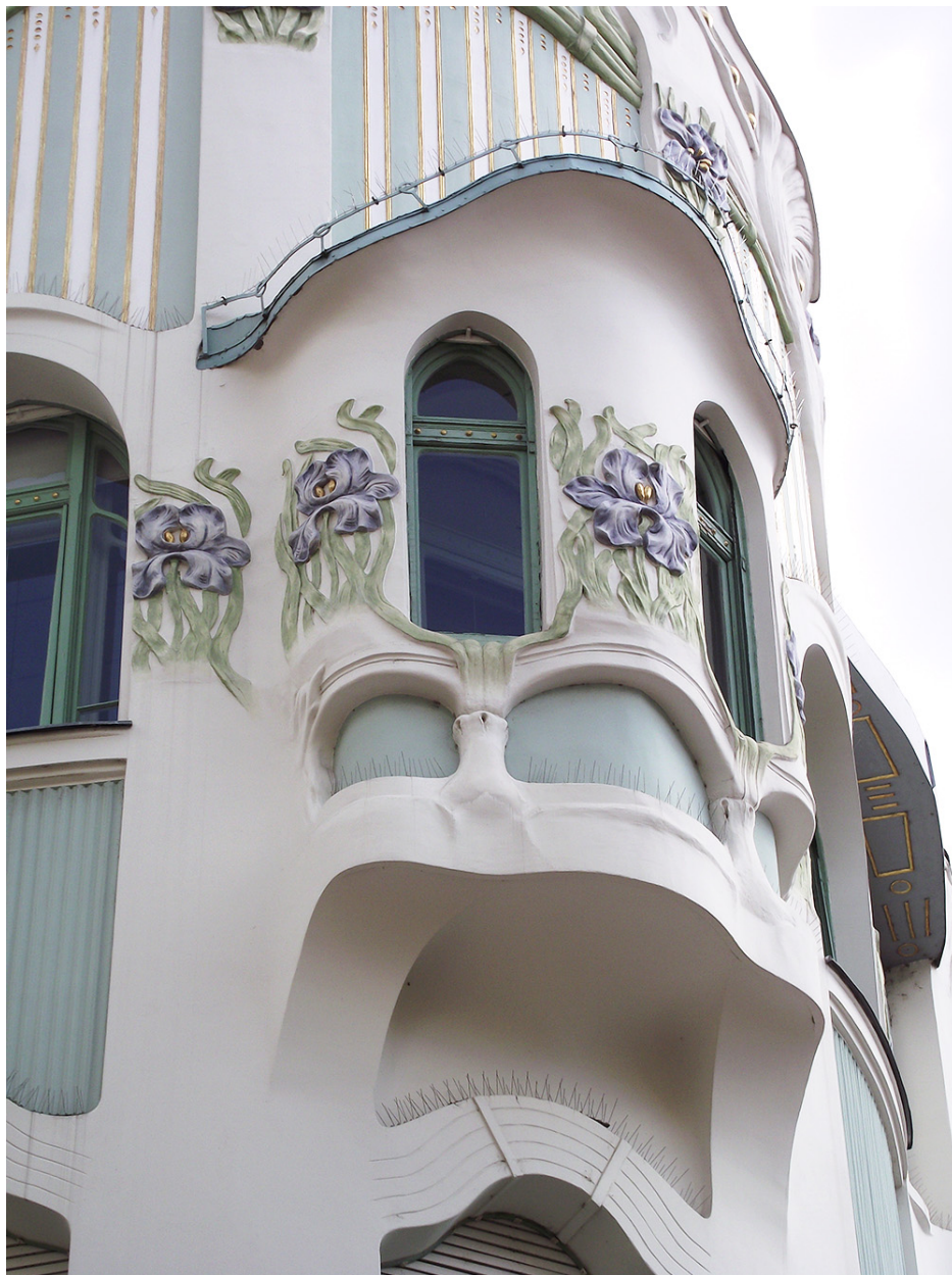
4. kép. A Reök-palota homlokzati részlete, sarokrészlet.

ugyanis már 1907. november 1-én át kellett volna adnia, de – a lakók nem kis zúgolódására – erre egy éven belül sem került sor, s ideiglenesen többször is redőny nélkül állt az épület. A cég 1908-ban elveszítette a Magyarra szemben fennálló követeléséért saját maga által indított pert, és az ítélet kötelezte a redőnyök javítására, mert azokat nem találták megfelelőnek. Magyar leveléből úgy tűnik, a cég kétszer is elküldte Szegedre a javított redőnyöket, de a felszerelést egyik alkalommal sem végezte el, és a javított munkát mindkét esetben vasúton, utánvétellel küldte meg. Magyar azonban így, látatlanban nem vehette át, hiszen azokat az átvétel előtt fel kellett volna szerelni az épületre. (A Reök-palota különleges ablakformái miatt ez nagy körültekintést igényelt, az emeleti szinteken tíznél több, különböző típusú és méretű ablak nyílik, a külső homlokzatra összesen 41 db, többosztatú ablak néz.)