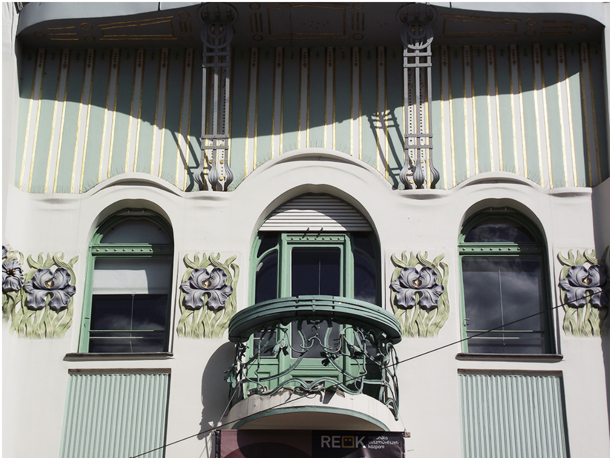
5. kép. A Reök-palota homlokzati részlete, Tisza Lajos körüti homlokzat.