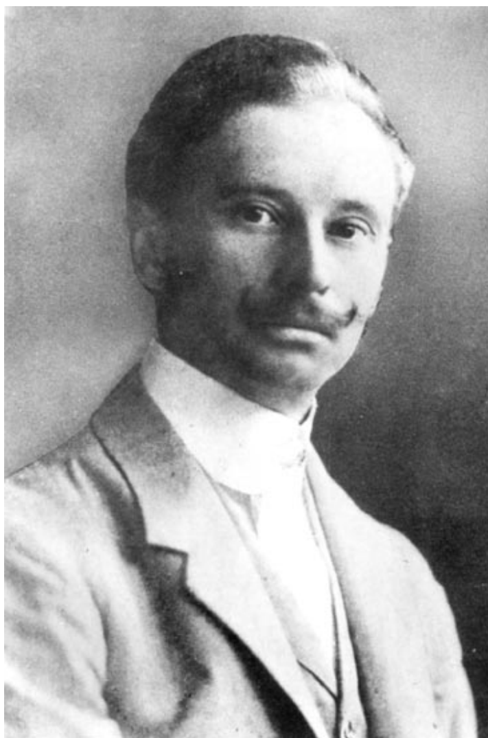
1. kép. Magyar Ede portréja.

Az erről szóló, hét oldalas közjegyzői okiratba szó szerint idézve belefoglalták Magyar Edének az Eckmayer céghez írt, hat oldal terjedelmű felszólító levele szövegét, és az okiratot Magyar maga is ellátta autográf aláírásával. Ennélfogva ez a közjegyzői dokumentum pótolhatatlan, ám mindeddig ismeretlen forrás Magyar Ede életművének kutatásában, forrásértékét pedig növeli, hogy Magyar Ede világszerte ismert művére, a szegedi Reök-palotára vonatkozik. Az épületet az irat Tisza Lajos körút 52. szám alatti kétemeletes saroképületként említi. A korabeli térképek és sajtóbeli említések segítségével az épület minden kétséget kizáróan azonosítható. (Mai címe Tisza Lajos körút 56.)