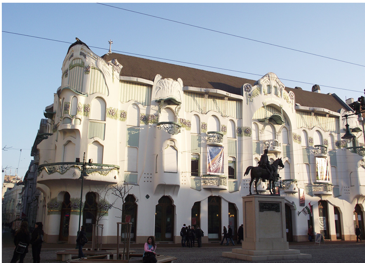
3. kép. A szegedi Reök-palota 1906–1907, Tisza Lajos körút 52.