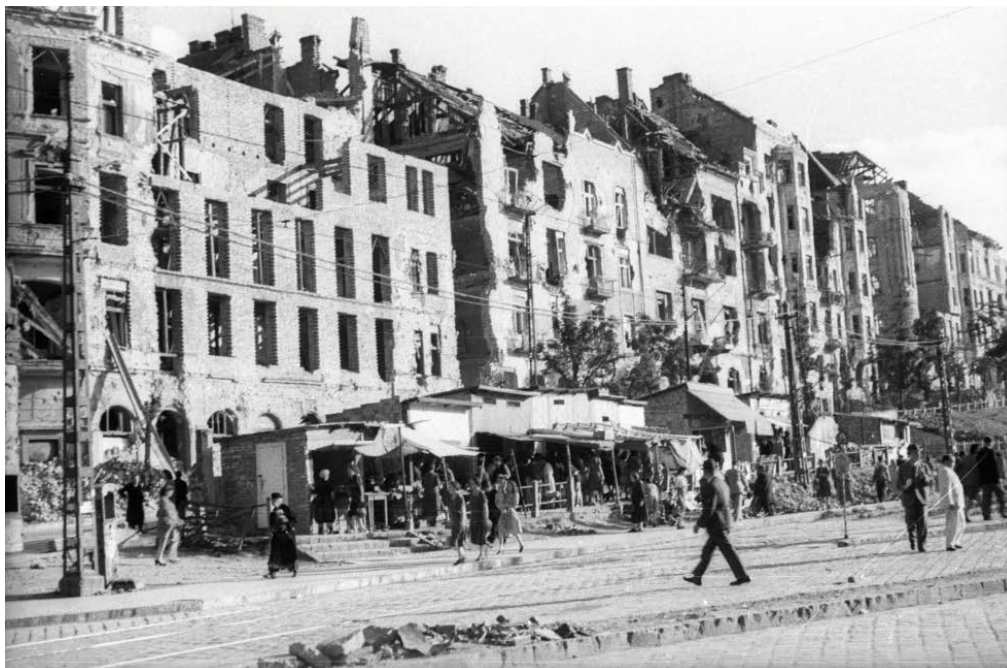
3. kép. Széll Kálmán tér, ideiglenes piac.

változatlan maradt, mivel egyidejűleg 15 millió pengő értékű 200 pengős és 5 millió pengő értékű 500 pengős kölcsönjegyet zároltak.