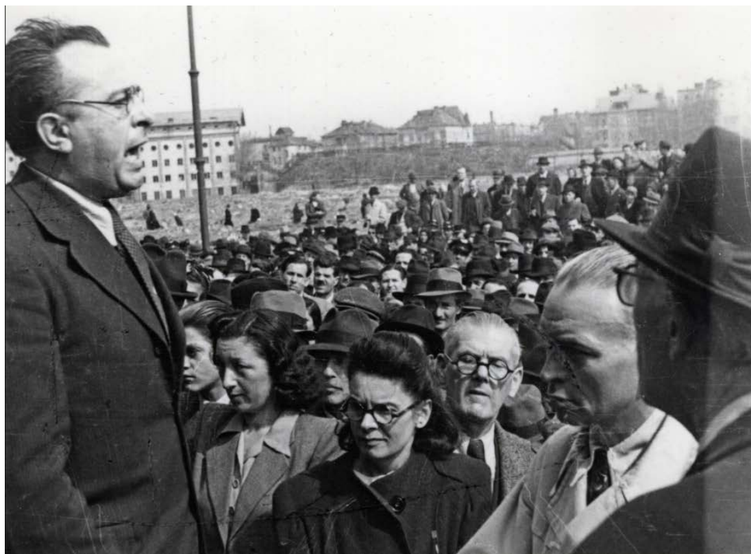
1. kép. Vas Zoltán, élelmezési kormánybiztos beszédet mond. 1945. április 2.

Budapest közélelmezési megbízotti feladataival Vas Zoltánt bízta meg a Debrecenben működő kormány. A széles jogkörrel felruházott közellátási kormánybiztos feladat- és hatáskörét a 256/1945. ME. sz. kormányrendelet határozta meg. Pozíciója ideiglenes volt, elsősorban az élelmiszerek beszerzése, összegyűjtése és szétosztása állt a fókuszban, illetékessége Budapest és vidéke területére, azaz a majd hivatalosan 1950-ben létrehozandó Nagy-Budapestre terjedt ki. (Maga a Nagy-Budapest kifejezés rendszeresen előfordul az 1945-ös iratokban.) Fő feladata a főváros élelmezésének biztosítása volt, ennek végrehajtására a kormánybiztos létrehozta a Budapesti Közellátási Kormánybiztosságot, amely az ostrom befejezését követően február 15-étől augusztus 1-ig működött. Első intézkedései között a főváros élelmiszer készleteinek növelését tűzte ki célul. A Fővárosi Közlönyben külön rovatot nyitottak a „Közellátási kormánybiztos rendeletei” címmel, szigorú rendeletek sora látott napvilágot az élelmezéssel kapcsolatban. A végrehajtáshoz pénz nem állt rendelkezésre, a kormány nem tudott anyagi fedezetet adni, ezért a pénz előteremtésére a város a lakókhöz fordult. Budapest népe állami, hatósági és banki segítség nélkül saját maga mentette meg magát az éhhaláltól – hangsúlyozták a kortársak. További terhet rótt a városra a Vörös Hadsereg Budapestre vezényelt katonáinak ellátása is.