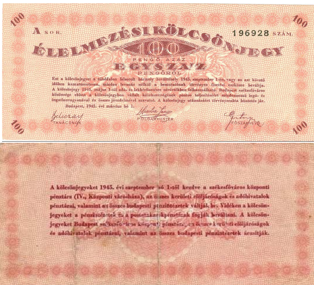
2. kép. Százpengős élelmezési kölcsönjegy elő- és hátoldala.