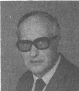
KŐPECZI BÉLA művelődési miniszter

A Művelődési Minisztérium nevében tisztelettel köszöntöm az 50 éves fennállását ünneplő Magyar Könyvtárosok Egyesületét. Az egyesület, melyhez a levéltárosok is csatlakoztak, azért jött létre, hogy tagjainak szakmai és társadalmi érdekeit képviselje, hogy a szakképzést előmozdítsa, hogy a könyvtár és a levéltár közötti kapcsolatokat erősítse, és hogy részt vegyen a nemzetközi szakmai életben. Ezt az 1935-ben elfogadott programot ma is lehet vállalni, azzal természetesen, hogy azóta új társadalmi rendszer alakult ki Magyarországon, amely a könyvtárügy területén is új feladatokat hozott, de új feladatokat eredménye-