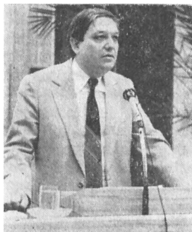
POZSGAY IMRE művelődési miniszter

A III. országos könyvtárügyi konferencia óta eltelt évtized eredményei, tapasztalatai bebizonyították, hogy az akkor kitűzött program alapvetően helyes volt, csak végrehajtása akadozott. Most tehát egy megindult folyamat fenntartása, megerősítése és kibővítése a cél, olyan program kijelölése, amely hosszú időre meghatározza a könyvtárügy fejlődését, de amely természetszerűen folyamatos „karbantartást” is igényel majd. A társadalmi szükségletek tökéletes pontossággal sohasem jelezhetők előre, a tech-