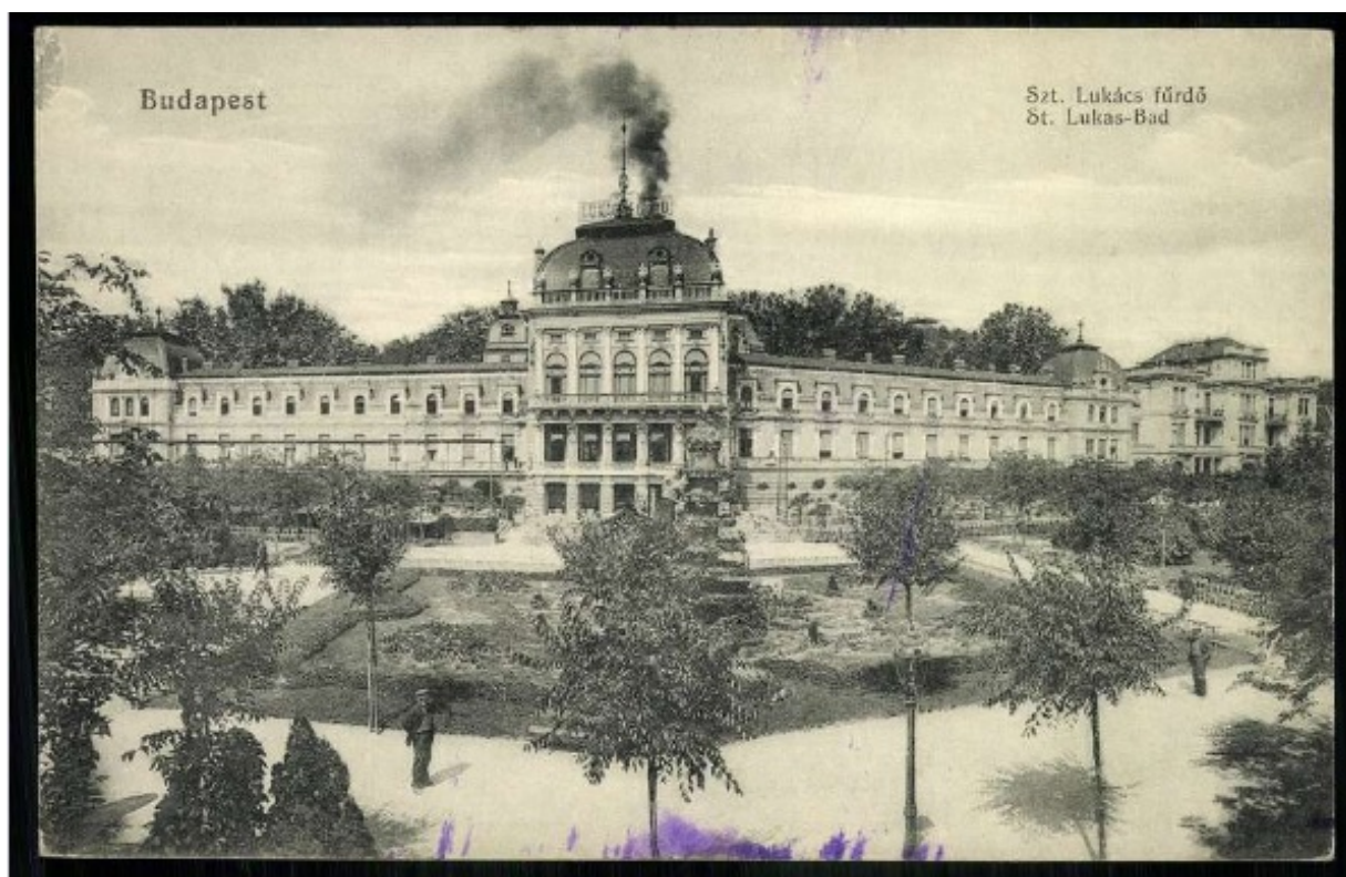
2. kép. A Lukács Fürdő Duna felőli épületszárnya a háttérben füstölgő kéménnyel.