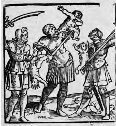
Abb. 3: Hernach volgt des Bluthundts der sychnennedt ein Türkischen Keiser gethaten, 1526