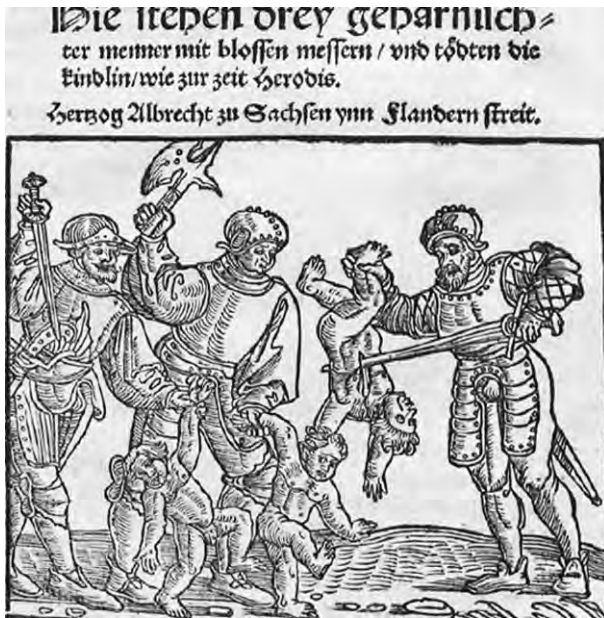
Abb. 8: Die weissagunge Johannis Lichtenber- gers deutsch zugericht mit vleys. Sampt einer nutzlichen vorrede vnd vnterricht D. Martini Luthers, 1527