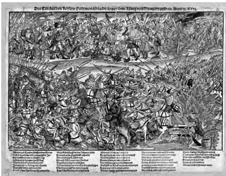
Abb. 1: Die Schlacht bei Mohács, 1526. Des Türckischen Key- sers Solymon schlacht / So mit dem König von Hung- ern gethan, Anno rc. XXVI

militärischen Genremalerei gehörende Holzschnitte, welche oft verwendete allgemeine Bildtopoi enthielten, wie die Bургbelagerung 14 und kleinere Scharmützel. 15 Eine Ausnahme bildet eine in der nahen Vergangenheit aufgetauchte Darstellung, 16 welche unter den in dem Jahr der Schlacht entstandenen Illustrationen die Bataille am ausführlichsten zeigte. (Abb. 1) Der in der Staatsbibliothek Bamberg aufbewahrte Druck, Des Türckischen Keyzers Solymon schlacht / So mit dem König von Hungern gethan, Anno rc. XXVI. , veröffentlichte die 38-zeilige Kurzfassung des 120-zeiligen Liedes von Mert Sporer über die Schlacht bei Mohács. Die anderen zwei Ausgaben des berichtenden Liedes von Sporer wurden von zwei Abbildungen illustriert, welche sich nicht an das Thema knüpften ( Kampf der Landsknechte ). 17 Die zunächst erschienene Ausgabe, genauer deren Probabzug, wird von der Kunstgeschichte Hans (Leonhard) Schäufelin (auch Schäufelein; um 1482/1483 – um 1539/1540) zugeschrieben. Nachdem er zu Beginn der 1510er Jahre in dem unter der Aufsicht Konrad Peutingers (1465–1547) arbeitenden Künstlerkreis Aufnahme fand, fertigte er einen Teil der Zeichnungen zu den Holzschnitten an, die 1517 in den mit Druckgrafiken illustrierten „Romanen“ Weisskunig und Theuerdank erschienen. Die beiden Werke spielten in der kulturellen Selbstrepräsentation, dem Ge-dechtnus , von Maximilian I. (1459–1519) eine wichtige Rolle und stellten das Leben und die Taten des Herrschers dar.