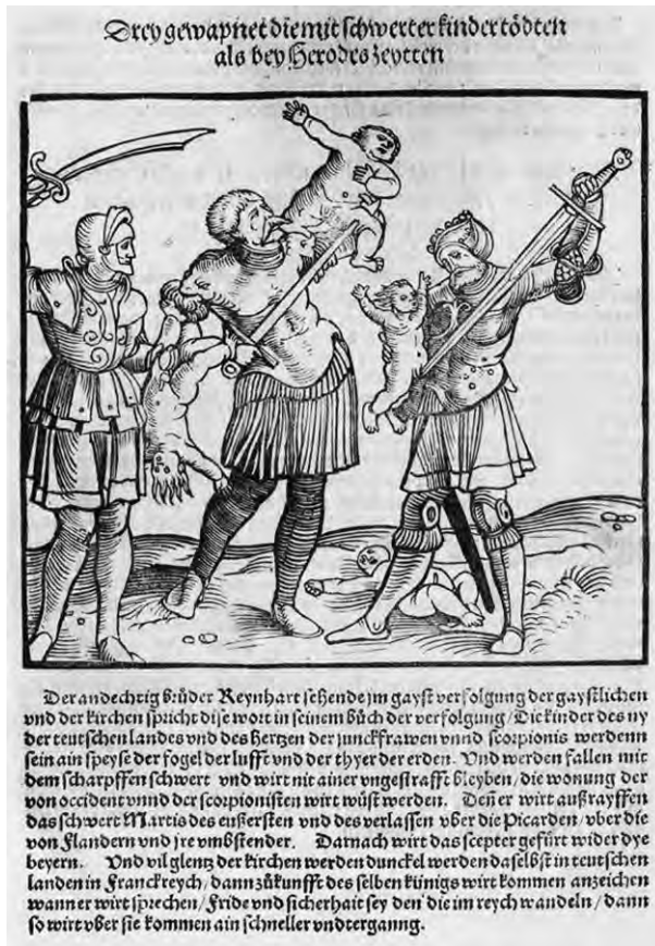
Abb. 10: Dyse Practica vnnnd Prenostication ist getruckt worden zu Mentz im MCCCCXCII Jar vnd werdt biß man zelt M.D.LXVII jar , um 1525

teren (um 1475–1536), 42 welche als Vorbild der Illustrationen jener erwähnten beiden Neuen Zeitungen gedient haben könnte, welche über die Schlacht bei Mohács berichteten. Die Holzschnitte der beiden Bücher von Lichtenberger sind identisch, der Unterschied besteht bloß darin, dass jener von 1526 mit einem zierreicheren Rahmen umgeben ist. (Abb. 11) Es ist beachtenswert, dass man auf dem Holzschnitt von 1488 alle drei Soldaten mit einem europäischen Helmtyp sieht, in der Komposition von Breu aber der rechte Soldat eine turbanförmige Kopfbedeckung trägt. Eine leicht vereinfachte Version dieser turbanförmigen Kopfbedeckung ist auch auf dem rechten Soldaten des