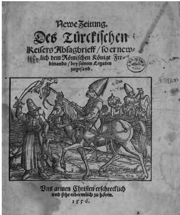
Abb. 15: Neue Zeitung. Des türckischen Keisers Absagbrieff, so er newlich dem römischen Könige Ferdinando bey seinem Legaten zugesand, 1556

von Türken gepfälte Kleinkinder zu sehen. Des Weiteren kann hierzu auch ein Bericht aus 1556 erwähnt werden, der mittelbar nicht einmal auf eine Kampfhandlung beziehbar ist. 54 (Abb. 15)