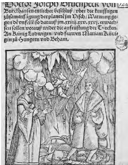
Abb. 7: Doctor Joseph Gruenpeck von Burckhausen entlicher beschluß, 1523

und betonte gleich der Widmung die Notwendigkeit des Kampfes gegen den „grausamen Türkenhund“. Er empfahl dem königlichen Paar, dass sie ihre Siegeshoffnung nicht in Menschen, sondern in die Himmlischen setzen sollten: Mithilfe der heiligen Engel würden sie den Feind besiegen können. Das wird auch durch den Holzschnitt auf der Titelseite der Publikation dargestellt, auf dem ein vom Himmel herunterschwebender Engel Ludwig eine Waffe reicht, vor den Füßen des Königspaares liegt ein toter Türke. Das antitürkische Programm des Textes wird am Ende des Heftes auch von einer der beiden Holzschnittillustrationen betont: Die Darstellung, die zum sehr populären ikonografischen Typ der Zeit gehört, zeigt den Kampf zwischen der christlichen schweren und der türkischen leichten Kavallerie. Im anderen Holzschnitt ist