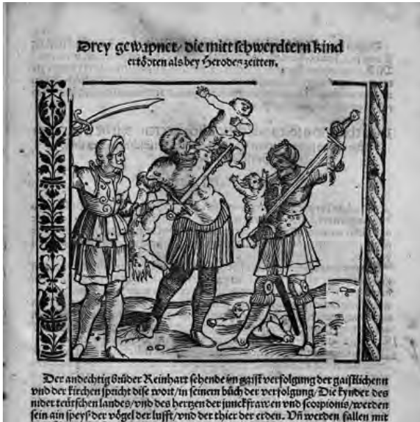
Abb. 11: Dise Practica unnd Prenostication . Ist gedruckt worden zu Mentz im M.CCCC.XCII. Jar Und werdt bisz man zelt M.D.LXVII jar, 1526

Titelbildes einer über die Schlacht bei Mohács berichtenden Neuen Zeitung sichtbar. 43 Die Illustration der Publikation von Lichtenberger aus dem Jahr 1526 erschien auch in den Ausgaben des astrologischen Werks von 1528 44 und 1530. 45 Auf dem Holzschnitt am Ende der Augsburger Neuen Zeitung aus dem Jahr 1526, 46 (Abb. 3) welche über die Verheerung nach der Schlacht bei Mohács berichtet, begegnen wir dem rechten Soldaten mit der Helmform, die auf dem Holzschnitt der Publikationen von Lichtenberger um 1525 und 1526 sichtbar ist.