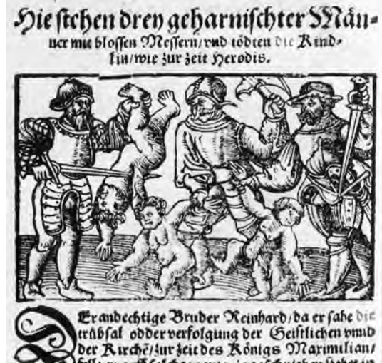
Abb. 6: Die Weissagung Johannis Lichtenbergers Deutsch mit Schönen Figuren zugericht, 1551