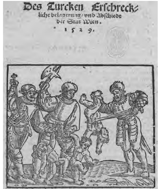
Abb. 4: Des Turcken Erschreckliche belagerung und Abschiedt der Stat Wien, 1529