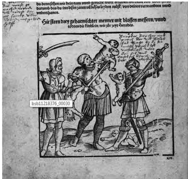
Abb. 13: Dise practica und Prenostication Johannis Lychte[n]bergers, 1530

cher die über die Schlacht bei Mohács berichtende Nürnberger Neuen Zeitung (Abb. 2) und die über die Verheerung nach der Schlacht berichtende Augsburgener Neuen Zeitung (Abb. 3) illustriert, ein senkrechter Streifen fehlt: Jener Teil des aufgehobenen Arms des Soldaten und des Schwertgriffs sind nicht sichtbar, da sie auf der Illustration des Prognostikon aus dem Jahr 1526 außerhalb dieser Linie der Beschädigung dargestellt sind. Da der Holzschnitt der Augsburgener Neuen Zeitung mit Ausnahme des fehlenden rechten Teiles mit der Illustration der Publikation von Lichtenberger um 1525 genau identisch ist, wurde wahrscheinlich derselbe Druckstock zu beiden Werken verwendet, im Falle der Neuen Zeitung legte der Drucker aber die beiden Druckstockteile nicht zusammen, sondern verwendet nur den größeren Teil des Druckstocks. Daraus