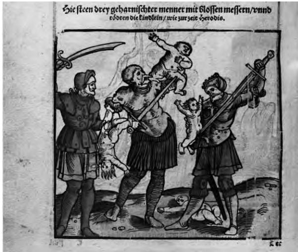
Abb. 12: Djse Practica und Prenostication Johannis Liechte[n]bergers, 1528