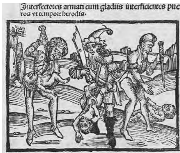
Abb. 9: Hec practica narrat de presenti a[n]no et seque[n]tibus quamplurimis annis de nouis raris et inauditibus rebus et gestis que futura sunt in hoc mu[n]do, 1499

Wir kennen mehrere Variationen der den Kindermord darstellenden Komposition der Pronosticatio , da die neueren Ausgaben nicht immer die Illustrationen des originalen Werkes übernahmen. So begegnen wir zum Beispiel in den 1492 in Mainz verlegten deutsch- und lateinischsprachigen Büchern 37 noch dem Holzschnitt der ersten Ausgabe, dagegen wurde aber die im selben Jahr in Modena verlegte italienischsprachige Version mit einer vom Original einigermassen abweichenden Illustration verziert. 38 Für die