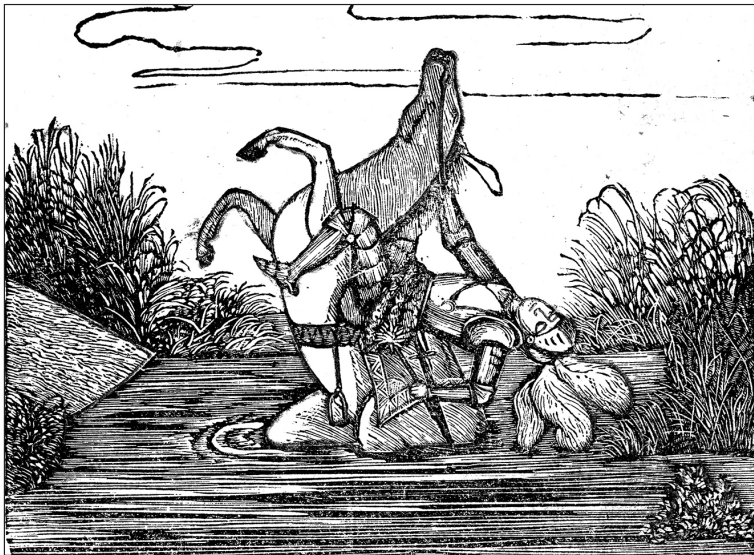
3. kép. II. Lajos halála. Fametszet. In: [Bedeó Pál]: Geschichte Ungarns mit Abbildungen der Anführer und Könige . Preßburg, 1843. Verlag von Alois Bucsánsky. 103.