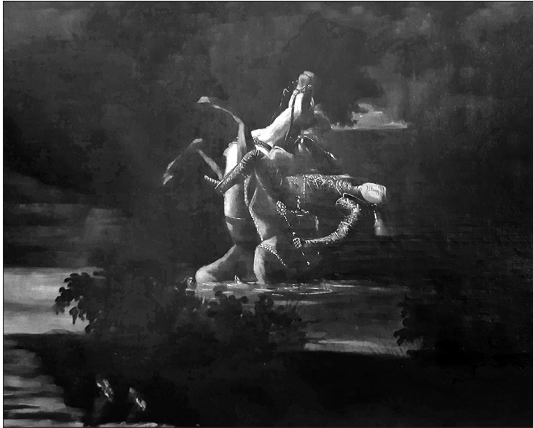
2. kép. Borsos József: Az 1526. évi mohácsi csata (Dorffmaister István festményének másolata). Részlet. Olaj, vászon, 1837. Mohács, Polgármesteri Hivatal