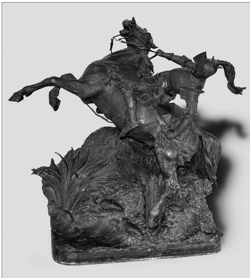
6. kép. Holló Barnabás: II. Lajos halála. Bronzszobor másolata. Mohács, Kanizsai Dorottya Múzeum

és a metszeten egy tuskéssel megtűzdelt harci buzogány, illetve a lótarakó geometrikus mintázatának feltűnő egyezése. Hasonló, a Dorffmaisterétől eltérő mintázatú a két képen a combvért is. Míg Dorffmaister festményén II. Lajos felismerhetően az ő egykori tulajdonának tartott, említett páncélt viseli, Bartalits rajzán és Mihalovits fametszetén a páncél ábrázolása stilizálttá vált. A könyvillusztráció (1843), illetve a ceruzarajz (1846) keletkezési idejéből arra következtethetünk, hogy Bartalits ismerhette a pozsonyi történeti kiadványt, s a II. Lajos halálát ábrázoló illusztrációt előképként felhasznalta emlékműterve elkészítésekor.