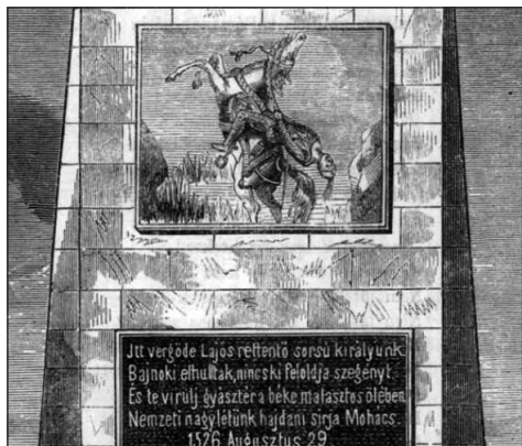
4. kép. A mohácsi csata emlékszobra Mohács mellett. Fámetszet. In: Magyarország és a Nagyvilág, 1874. augusztus 30.