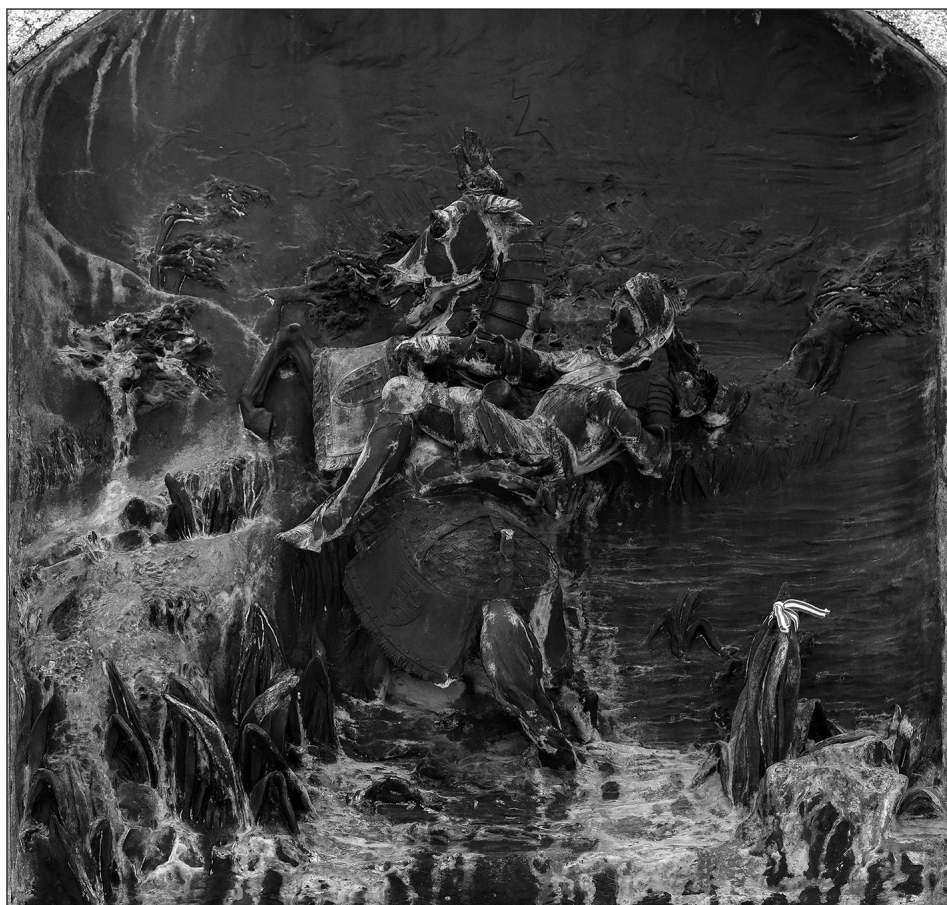
5. kép. Kiss György: II. Lajos halála. Bronzrelief a mohácsi csata emlékművén. 1895 körül, Mohács