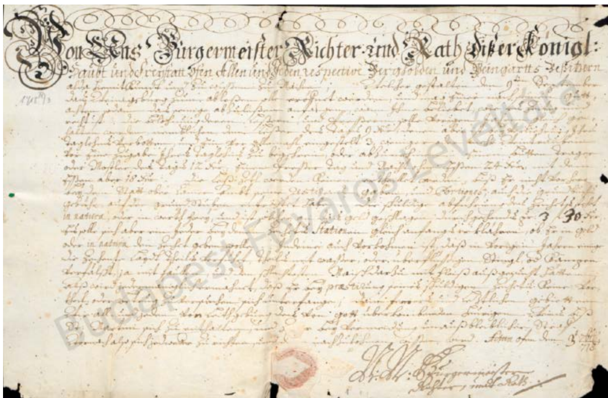
3. kép. Buda Tanácsának szüreti hirdeteménye, 1718. szeptember 3. (BFL IV.1019 Nr. 32b)

A szüret tényleges megkezdése előtt a két város vezetősége leellenőrizte az előző évek adókimutatásait, nincs-e valamelyik szőlőtulajdonosnak hátraléka, majd kötelezték őket a fentebb említett szüreti cédula ( Lesezettel, Maschzettel, szüretelési engedély jegy vagy szüretelési bárcza ) megváltására. 10 A szüreti cédula volt tehát egyszerre biztosíték arra, hogy az adott szőlőtulajdonosának nincs tartozása, másrészt a gazdának adott szüreti engedély (a hátralékokat egyébként a dézsmálás során is ellenőrizték és igyekeztek beszedni).