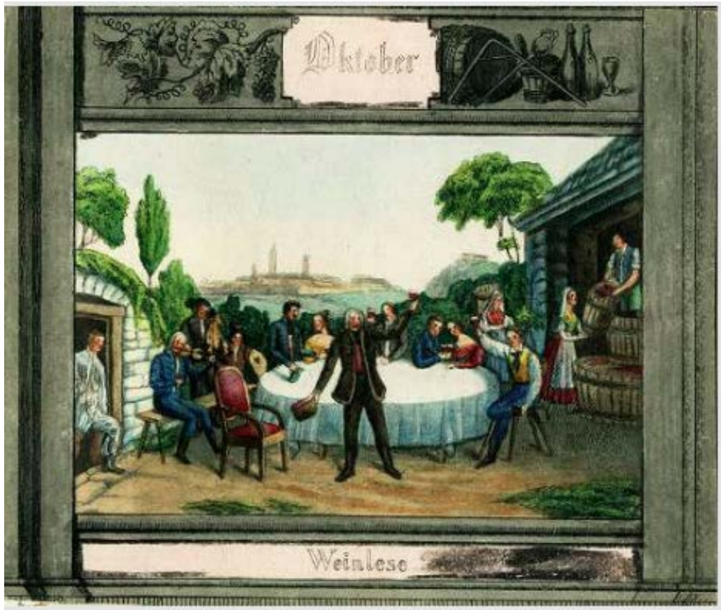
5. kép. Szüret (Moritz Schwindt metszete Carl Schwindt rajza után, 1837–1848 között).

követően lehetett változtatni, aki ezt nem tette meg, 10 konvenciós forint büntetésre számíthatott. 15