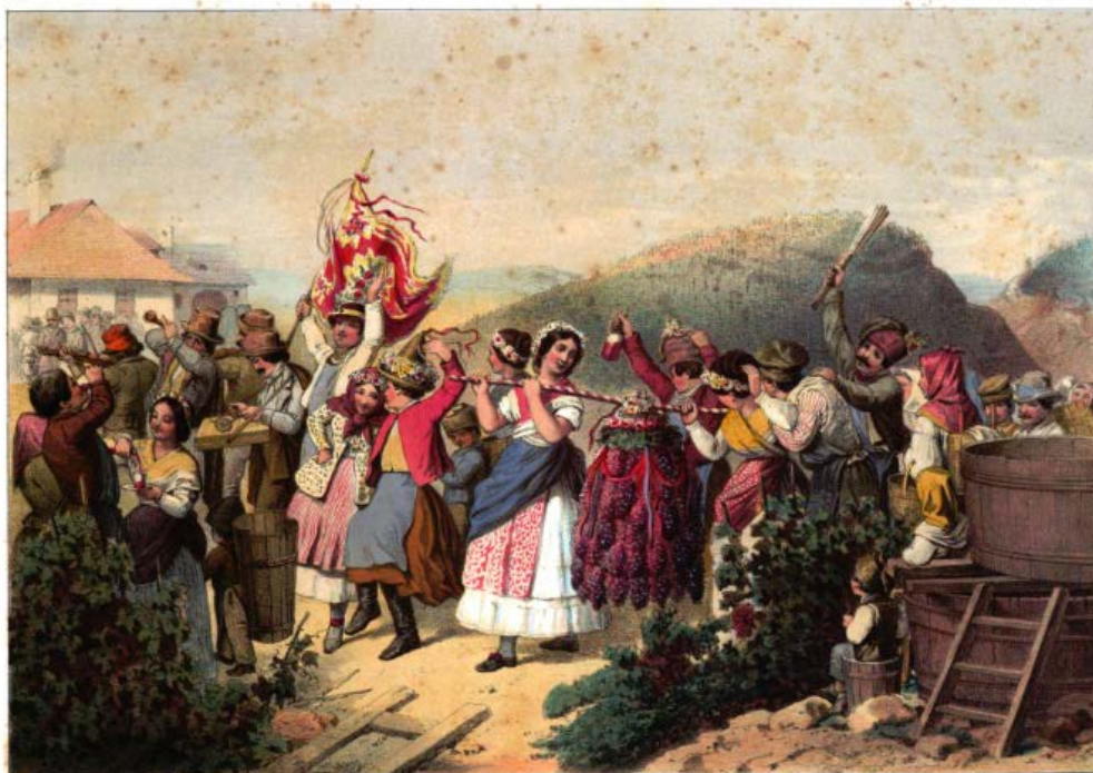
Ofner Winzerfest. Budai szüret-lor. La fête des vignerons à Bude.

Gegenüber Sankt-Miklós, vorwärts des Erdbeeren- & Weinberges, in Pest.