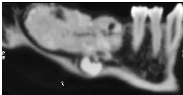
2. kép: A CT felvételen jól látható az odontoma, a diszlokált moláris fog és a canalis mandibulae lefutása

Napjainkban modern radiológiai eljárásokat is alkalmaznak az odontomák pontosabb diagnosztikájához. Ezek azonban legtöbbször csak térítés ellenében vehetők igénybe és az elváltozások pontosabb lokalizációjában (pl. műtét tervezésében) játszanak szerepet. Az odontomák a CT-n, illetve a CBCT-n is radiopaque megjelenést mutatnak, körülöttük radiolucens szegély figyelhető meg (2. kép). A CT hazánkban ingyenes, azonban kevésbé részletgazdag, főként az alsó áll-