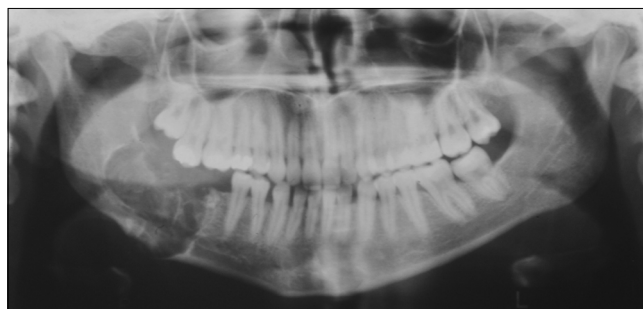
3. kép: Kontroll OPG. A képlet eltávolítását követően a csontdefektust spongiosa forgáccsal töltötték fel.

Az odontomák eltávolítása kétféle módon történhet: intraorális megközelítésből, illetve, ha az elváltozás a mandibulában nagy kiterjedést mutat, akkor az extraorális megközelítés a megfelelő hozzáférés érdekében előnyösebb lehet. A legtöbb enucleatio gyors folyamat és nem igényel speciális előkészítést: a fogorvosi rendelőben, helyi érzéstelenítésben végrehajtható. Azonban kiterjedtebb elváltozásoknál már célszerű általános érzéstelenítés mellett végrehajtani a beavatkozást, majd kórházi ellátásban részesíteni a páciens. Az elváltozások eltávolítása után a kialakult üreget körültekintően át kell vizsgálni, meg kell győződni arról, hogy a tumorszövet teljes egészében eltávolításra került. Ennek