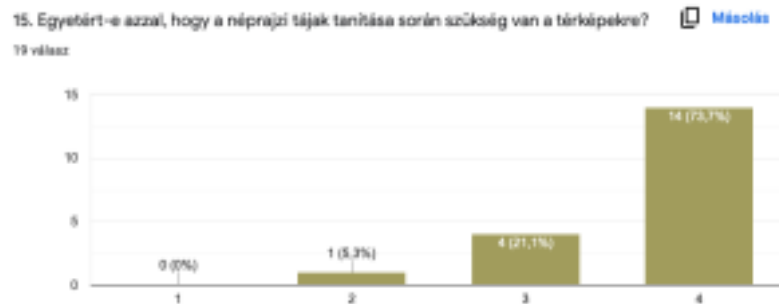
4. ábra: A hallgatók válasza a néprajzi tájak tanításához használt térképek fontosságáról

A kérdőív következő zárt végű kérdésében a néprajzi tájakkal kapcsolatosan a térképek használatára kérdeztem rá. A kérdés, habár kapcsolódik a hagyományhoz, mégis egyfajta kizökkenést is jelent a témakörből. Ugyanakkor kapcsolódik a kérdőívet záró topográfiai feladathoz. Az „Egyetért-e azzal, hogy a néprajzi tájak tanítása során szükség van a térképekre?” kérdésnél az egyetértés aránya 94,8% (4.ábra).