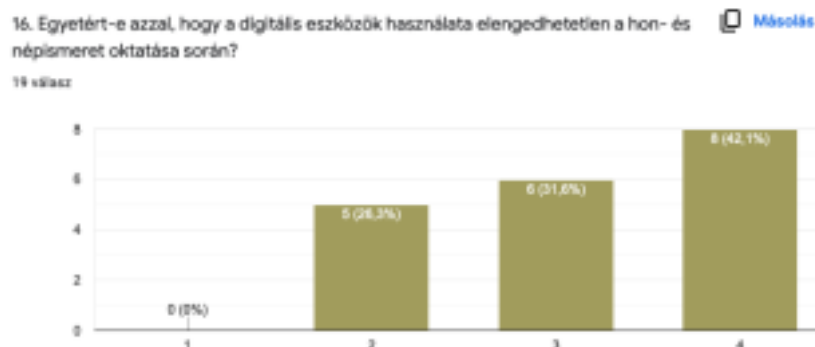
5. ábra: A hallgatók válasza a digitális eszközök alkalmazásáról a hon- és népismeret órákon

A hon- és népismeret oktatásához kapcsolódva a digitális eszközök használatára is kitértem a kérdőívben. Az „Egyetért-e azzal, hogy a digitális eszközök használata elengedhetetlen a hon- és népismeret oktatása során?” kérdés eredménye alapján elmondható, hogy a hallgatók 73,7% egyetért a digitális eszközök használatával a hon- és népismeret órákon, viszont 26,3% kevésbé tartja fontosnak. A kérdőívben itt tapasztalható a legnagyobb mértékű kevésbé egyetértés. Meglepő az eredmény, egyrészt mivel tartalmaz egyfajta ellentmondást a korábbi válaszokkal, másrészt az egyetemi képzés nagy hangsúlyt fektet a digitális eszközök minél szélesebb körű felhasználási lehetőségeire (5.ábra).