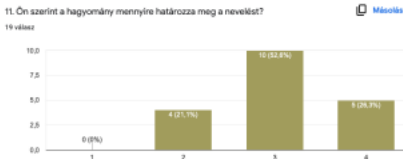
1. ábra: A hagyomány nevelést meghatározó szerepe a válaszadók szerint