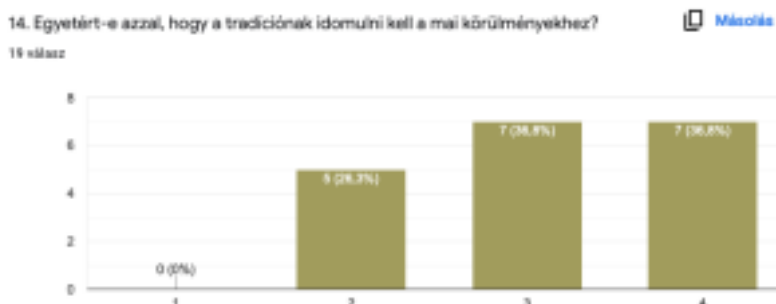
3. ábra: A tradíció idomulásának fontossága a mai körülményekhez a válaszadók szerint

Zárt kérdésként jelent meg a kérdőívben az „Egyetért-e azzal, hogy a tradíciónak idomulni kell a mai körülményekhez?”. A megkérdezettek 73,6%-a jelölte az egyetértést és a teljes egyetértést. Az eredmények is igazolják, hogy a hagyomány nem statikus, sokkal inkább változó, átalakuló jelenség. Erre a folyamatos változásra nemcsak a generációs igény sarkallja, hanem a kultúrával való szoros kontinuitása is. Következésképpen a tradíciónak alapvető követelménye a mai körülményekhez való idomulás (3. ábra).