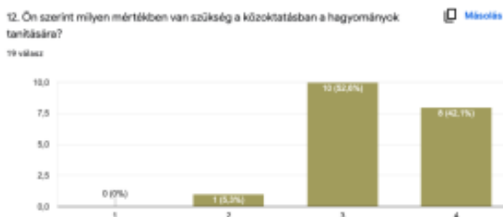
2. ábra: A válaszadók véleménye a hagyományok tanításáról a közoktatásban

A hagyományok tanításának nevelő szerepe mellett az „Ön szerint milyen mértékben van szükség a közoktatásban a hagyományok tanítására?” kérdéssel a hallgatók 94,7%-a ért egyet. A nagymértékű pozitív válasz jelen kérdés esetben nem meglepő, hiszen a hallgatók egyik tantárgyának lényeges témájáról van szó (2. ábra).