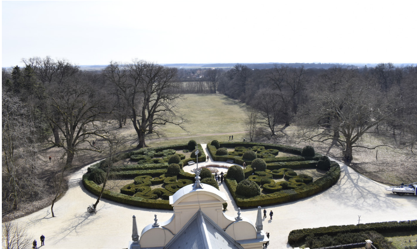
15. kép/Pict. 15: Szabadkígyós, Wenckheim-kastély – kastélypark rekonstrukció / Reconstruction of Wenckheim Castle Garden in Szabadkígyós

a természeti, a teremtett világ tiszteletén alapuló kapcsolatot környezetünkhöz, önmagunkhoz. A szegregálódott gondolkodást, a tudomány, a művészet és a társadalom szétforgácsolódását és öncélúságát ismét összművészeti tenni, humánussá formálni és kozmoökológiai tudatra emelni. Nagyon fontosnak tartom publikálni, szakmai és népszerűsítő könyveket kiadni, konferenciákat szervezni - kezdeményezője és szervezője vagyok a Mőcsényi Mihály nemzetközi konferenciának -, a kertművészet és a többi művészeti ág, a tudomány és társadalmi, turisztikai összefüggésében egyaránt.