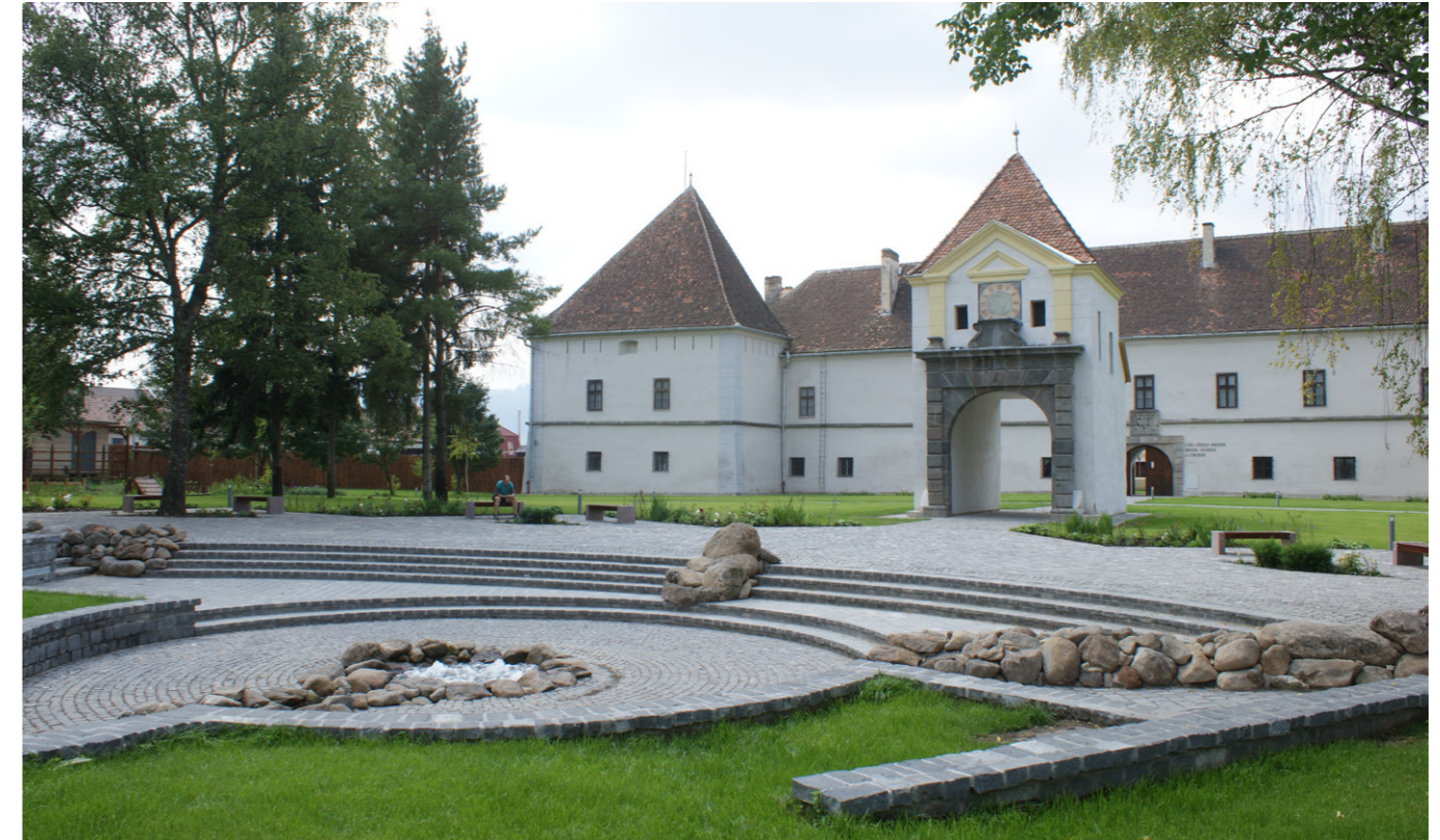
16. kép/Pict. 16: Csíkszereda, Mikó vár – vár környezetének kertépítészeti megújítása / Landscape renewal of the surroundings of Mikó Castle in Csíkszereda, (Miercurea Ciuc)

type of intellectual impulse from the future. Therefore, at an individual level, it is inevitably important to pursue a path of self-awareness and knowledge about the world, alongside high professional skills. To rely not on fashion or trends in the creative process but the presence of the spirit. Hungary has historically had a high garden and landscape culture as part of its cultural and social life. Our task today is to make this heritage widely known in society and cultural life. All this is to foster a humane relationship with our environment and ourselves based on respect for nature and the created world. To humanise segregated thinking, the disintegration and self-sabotage of science, art and society and reinstate into a most diverse artistic environment while raising a cosmo-ecological consciousness. I consider it essential to publish and share professional and promotional books and to organise conferences - I am the initiator and an organiser of the Mihály Mőcsényi International Conference Series - in the context of garden art and other artistic disciplines and science, social and tourism context.