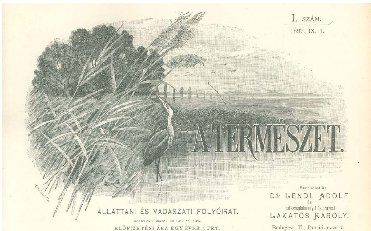
2. kép. A Természet című folyóirat borítója. (A Természet. Állattani és vadászati folyóirat. 1897. szeptember 1. 3. p.)