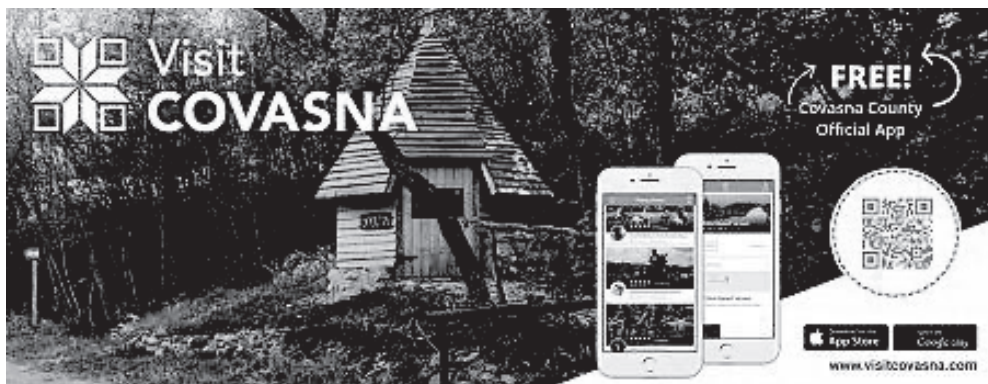
5. ábra: Visit Covasna applikáció – online reklámbanner