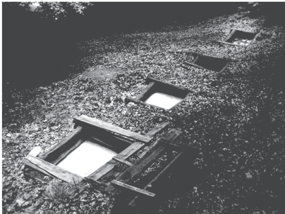
4. ábra: Borvízforrások Háromszéken