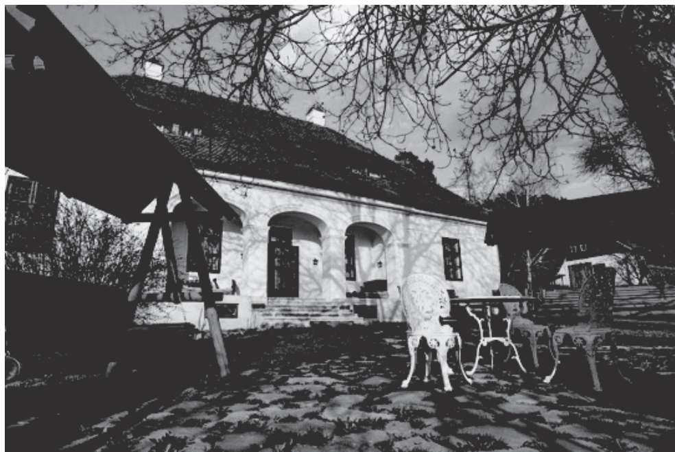
3. ábra: A kúriák földje – Háromszék