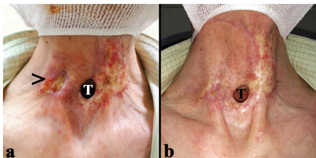
1. ábra Pre- és posztoperatív nyaki status. a) Sugárkezelés okozta kiterjedt fibrosis és fekély a tracheostoma mellett. b) A transzpozíciós lebény teljes beépülése a harmadik posztoperatív hónapban > = fekély; T = tracheostoma

pen csak ritkán alakul ki, azonban az irradiáció hosszú távú mellékhatásaként leírták már emlő-, méhnyak-, endometrium- és húgyhólyagdaganatban szenvedő betegeknél, illetve seminómák és sarcomák esetében is [10, 12]. Mindmáig összesen 3, a fej-nyaki régiót érintő eset található a nemzetközi szakirodalomban: 2 subcutan, 1 pedig retropharyngealis elváltozásként [13–15]. Ritkásága ellenére a kórkép ismerete fontos, hiszen a sugárkezelés az onkológiai betegellátás egyik alappillére [1, 3].