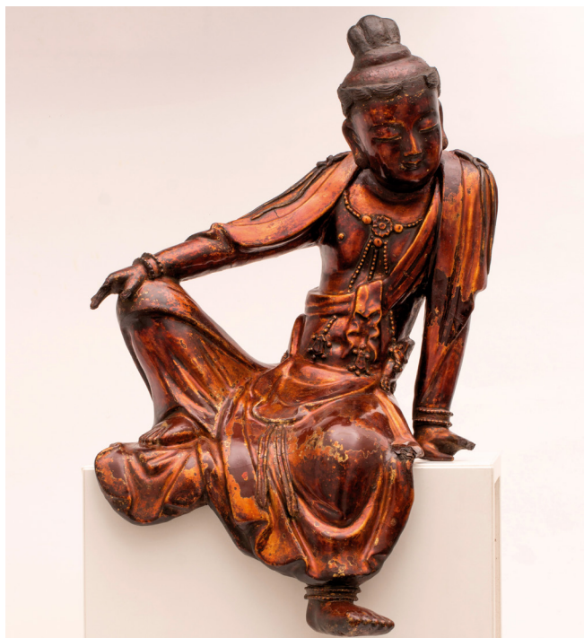
4. kép. Holdat néző Guanyin. Kína, 14. sz., fa, textilre felvitt lakkborítás, M.: 48 cm. Hopp Ferenc Ázsiai Művészeti Múzeum, ltsz.: 20; Schwaiger Imre ajándéka 1936-ban Delhiből. © Szépművészeti Múzeum. Forrás: Kelényi Béla, 2022.