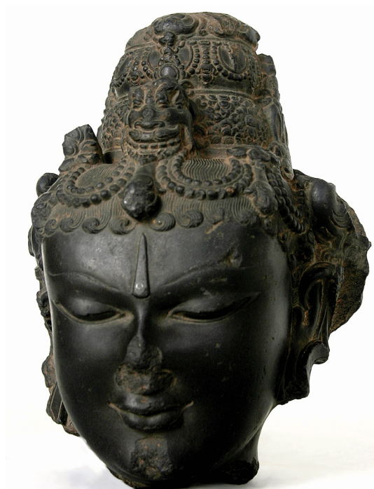
5. kép. „Visnu-fej”. Bihár (Kelet-India), 11–12. sz., fekete pala, M.: 22,8 cm. Hopp Ferenc Ázsiai Művészeti Múzeum, ltsz.: 6351; Schwaiger Imre ajándéka 1939-ben, Londonból.