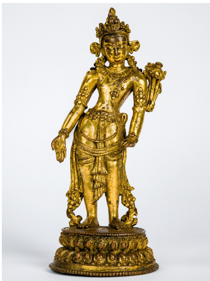
6. kép. Padmapáni Lókésvara. Nepál, 14–15. sz., aranyozott vörösréz, M.: 22 cm. Hopp Ferenc Ázsiai Művészeti Múzeum, ltsz.: 50.113; Schwaiger Imre ajándéka 1939-ben Londonból.