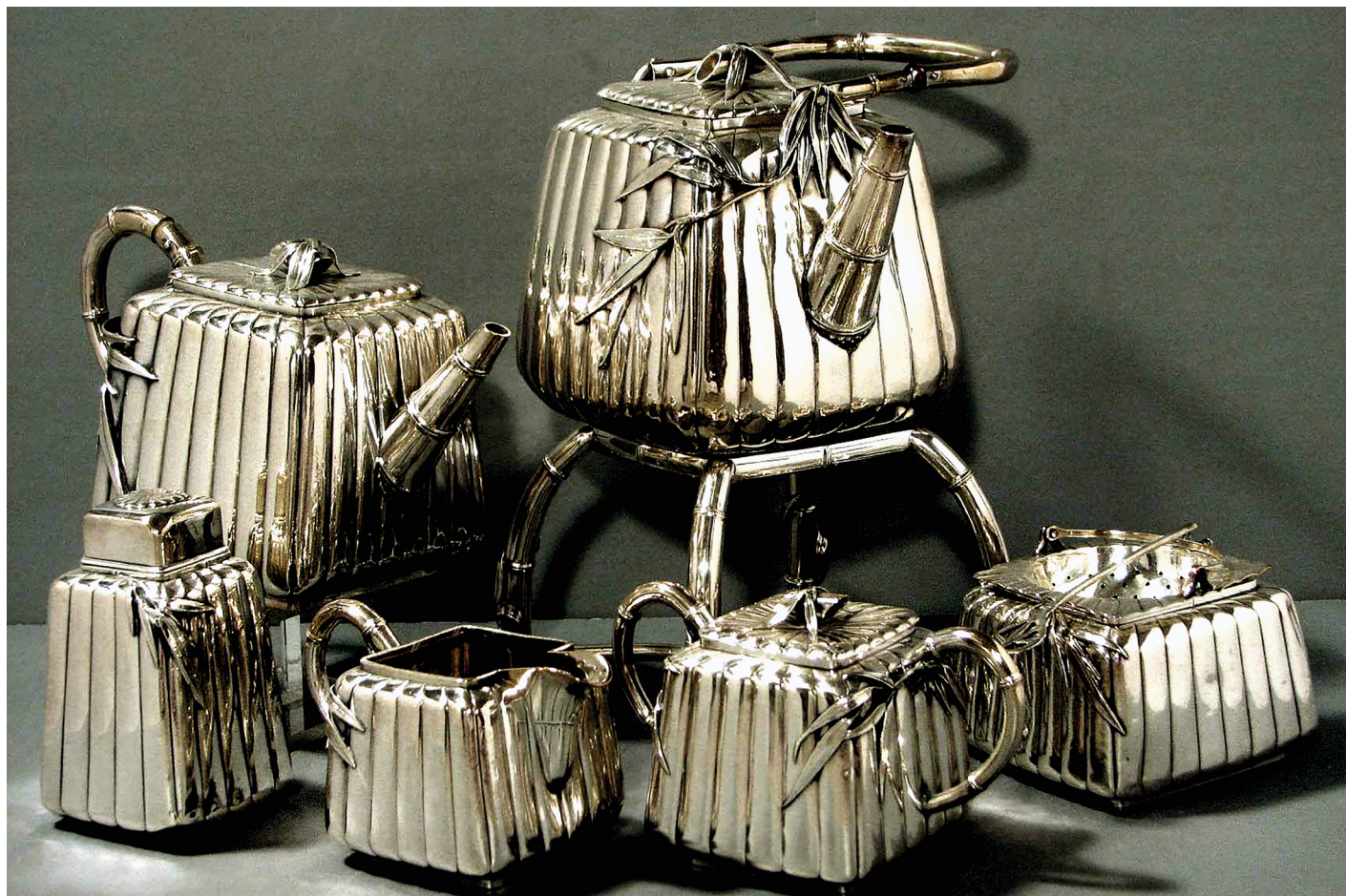
3. kép. A Kuhn & Co. cég teáskészlete, 1909. Forrás: Kiss Sándor gyűjteményéből.

A Kuhn & Komor shanghai üzlete 1905-ben. Forrás: Kiss Sándor gyűjteményéből.