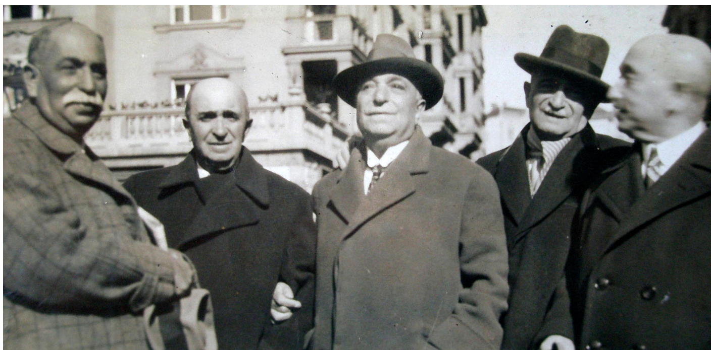
2. kép. A Komorok Budapesten 1932-ben. Forrás: Kiss Sándor gyűjteményéből.

A Komor család Budapesten 1883-ban. Forrás: Kiss Sándor gyűjteményéből..