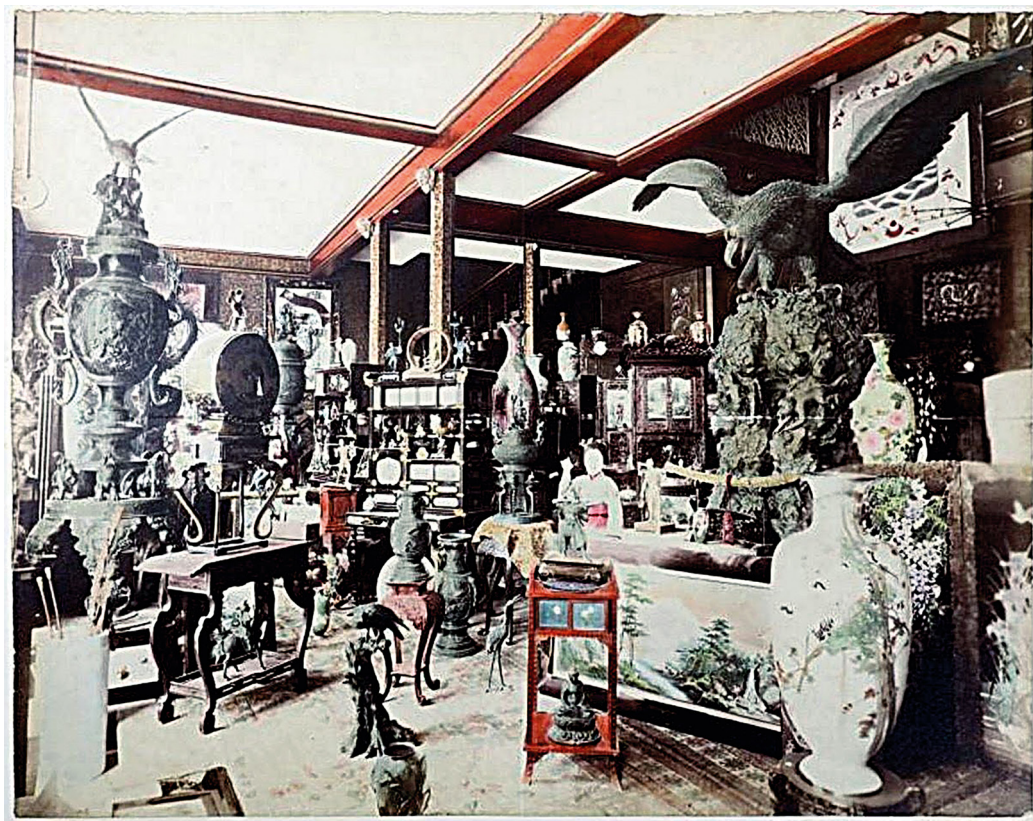
5. kép. A Kuhn & Komor yokohamai üzlete belülről.