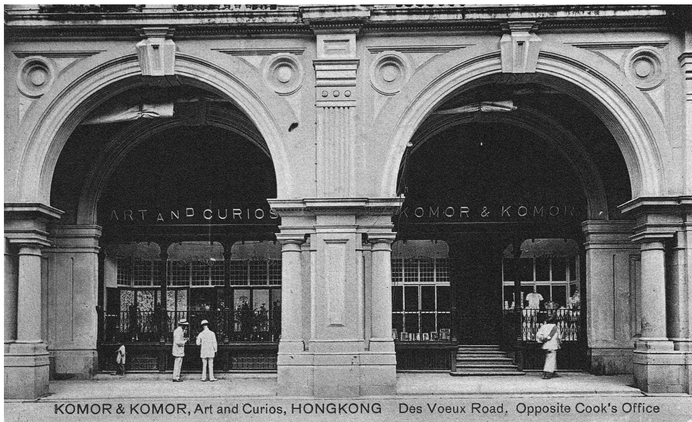
3. kép. A Komor & Komor hongkongi üzlete. Képeslap 1920-ból.