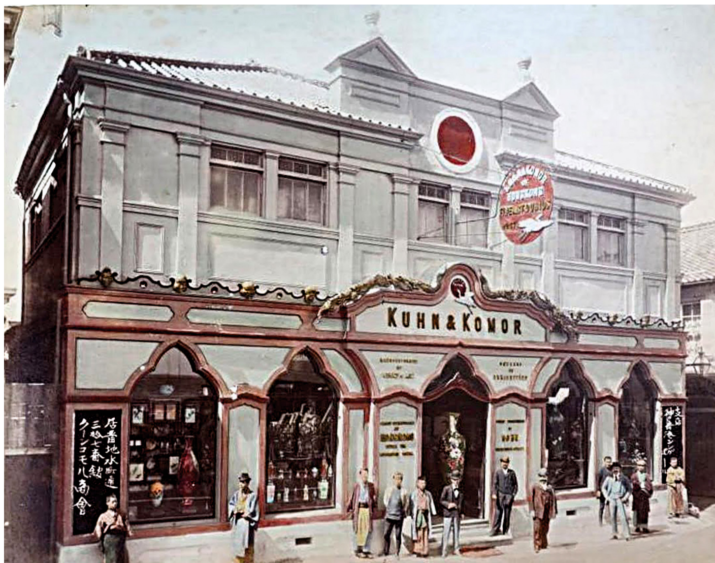
2. kép. Kuhn & Komor curio üzlete. Jokohama No. 37.

Catalogue of Japanese carved wood Furniture . Yokohama: Kuhn & Komor. Yokohama Archives of History, Arcanum, Országos Széchenyi Könyvtár, Hopp Ferenc Ázsiai Művészeti Múzeum