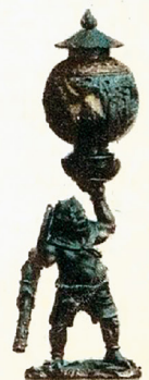
Fine lacq. Carving