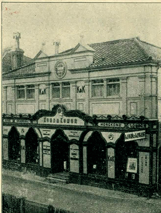
Please remember this building Front view of K. & K.'s store, Yokohama, Opposite the "GRAND HOTEL."