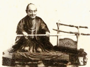
Modern Ivory Carving