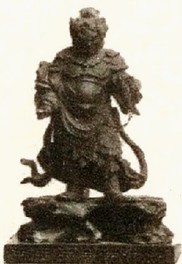
Ancient Bronze Idol

EXHIBITS of The earliest and latest faience.