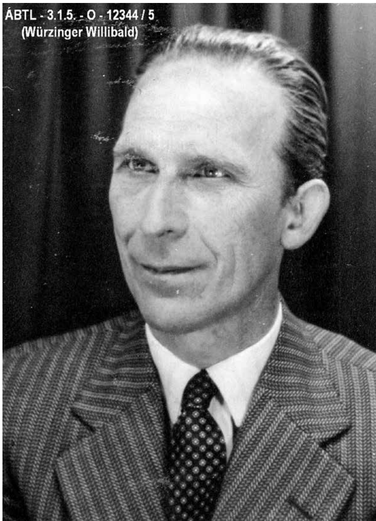
8. kép: Würzinger Willibald, a náci Németország hírszerzésének balkáni rezidense a világháború idején.