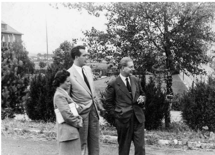
7. kép: Herbert Schellpeper a magyar hírszerzés által begyűjtött (vagy készített?) fotón.