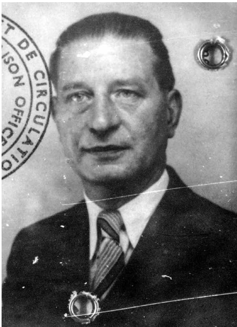
6. kép: Herbert Schellpeper, a nyugatnémet Szövetségi Gazdasági Minisztérium (Bundesministerium für Wirtschaft) külkereskedelmi ügyekkel foglalkozó részlegének magyar kapcsolatokért felelős referense.