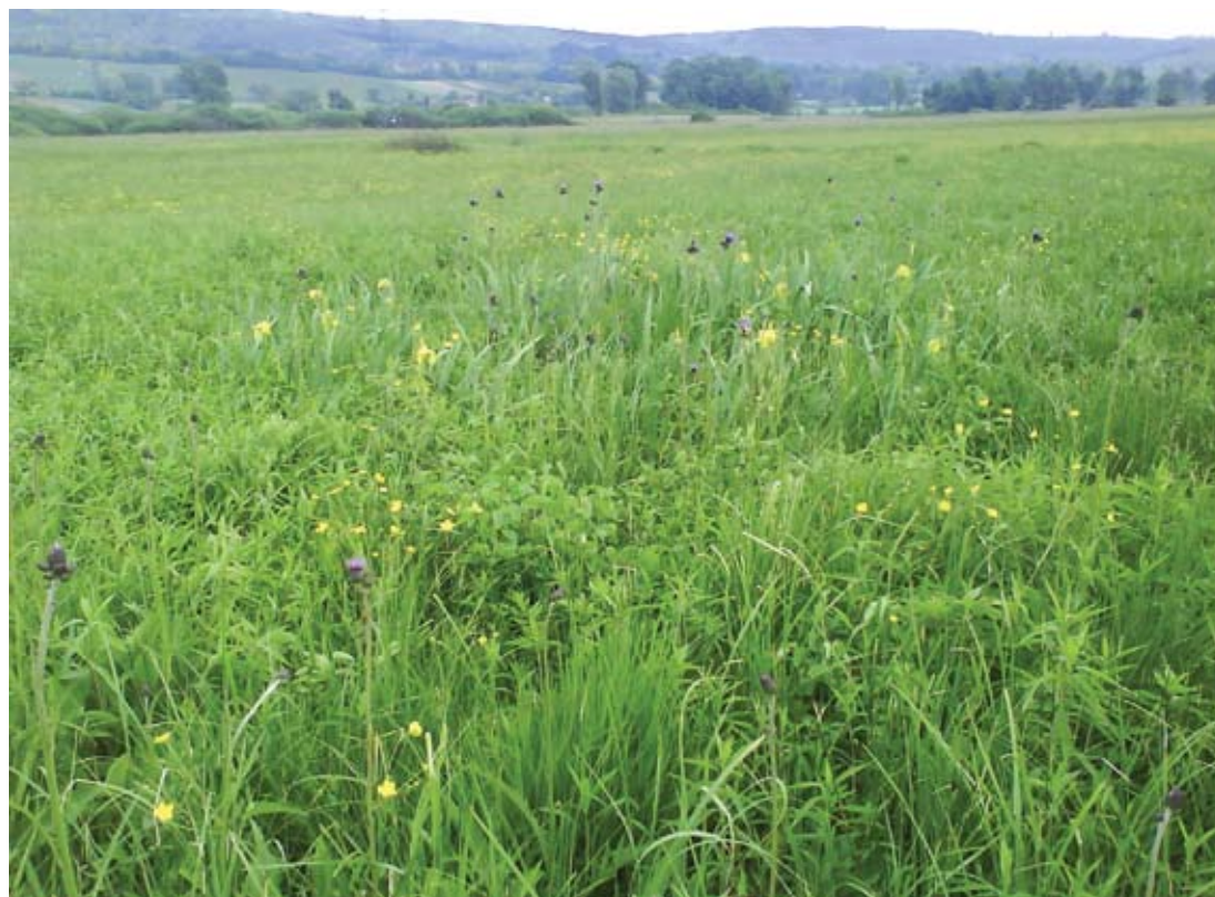
3. ábra. Fajgazdag kiszáradó láprét.