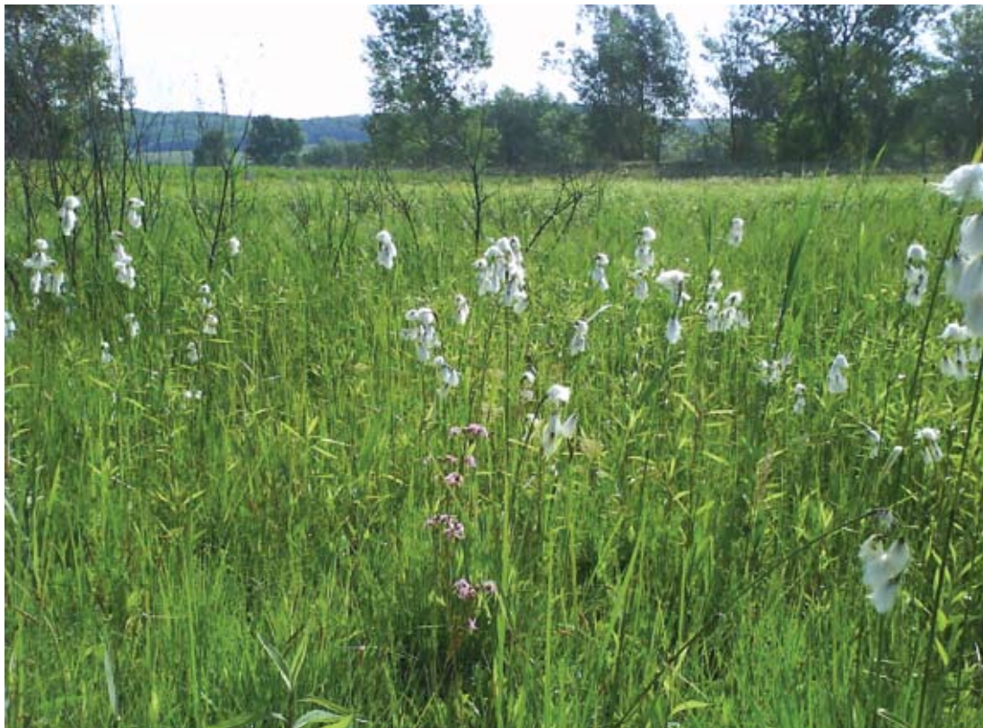
2. ábra. Meszes láprét Eriophorum latifolium -mal.