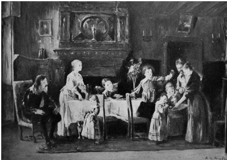
Munkácsy Mihály egyik tanítványa: Kölyökkutyák II. 1890 körül, olaj, fa, 70,5×101,5 cm (aukció-méret 73×108 cm) SZM. Chorin Ferenc letéte. Ernst aukció XLIII.