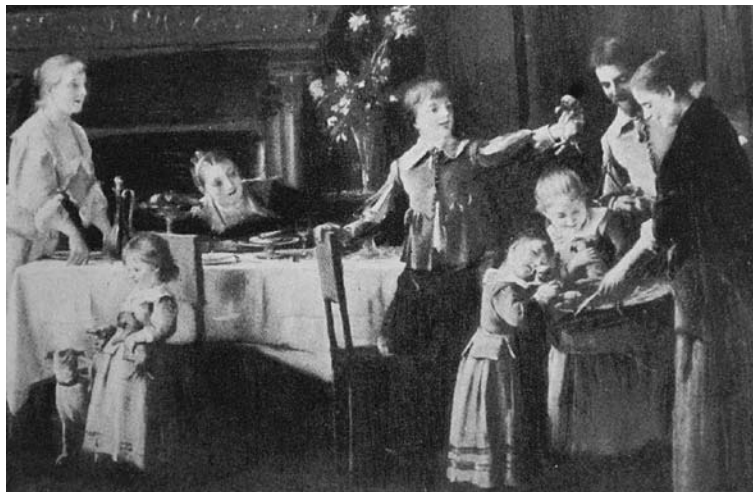
Részlet. Munkácsy Mihály: Kölyökkutyák I. 1890 körül, olaj, fa, 131×200 cm Azelőtt Cullock – gyűjtemény, London. Wawra Au. Bécs, 1923. máj. 14-15., 15. sz. Repr.: Sedelmeyer, 115.