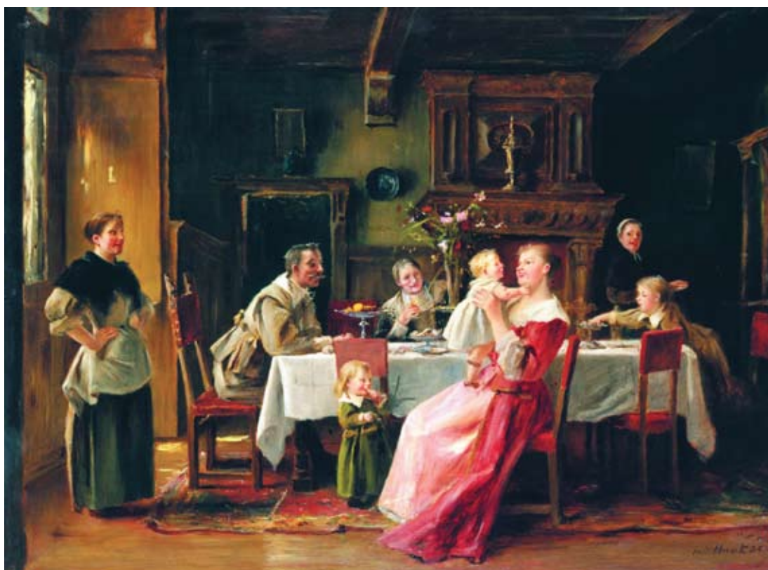
Munkácsy Mihály: Ebéd után – Anyai boldogság, 1892. olaj, fa, 109×150 cm Magyar Nemzeti Galéria tulajdona