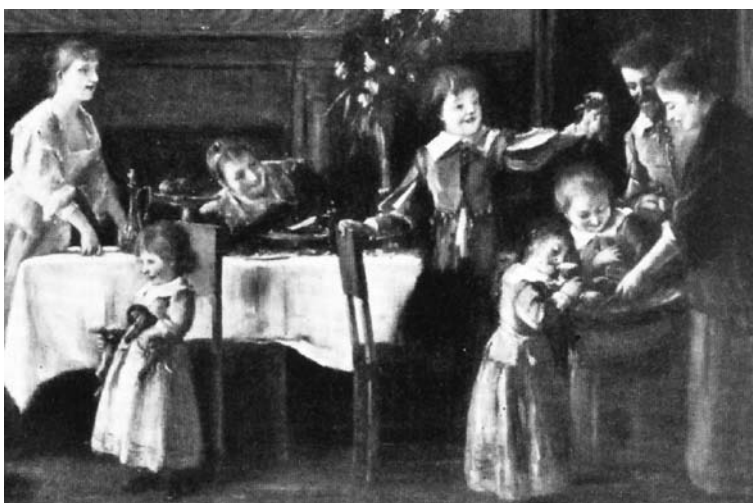
Részlet. Munkácsy Mihály – Rippl-Rónai József: Kölyökkutyák III., 1890 körül, (a kutyák anyja nélkül) olaj, fa, 95,5×128 cm Békéscsaba, Munkácsy Mihály Múzeum tulajdona