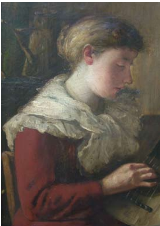
Rippl-Rónai: Gítározó nő