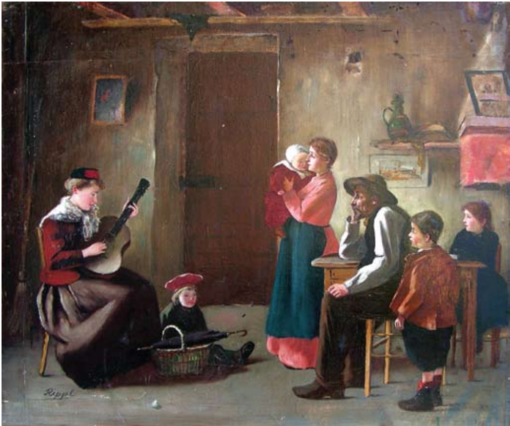
Rippl-Rónai: Külvárosi szoba belseje Párizsban