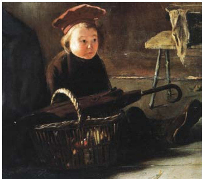
Rippl-Rónai: Ülő gyermek kosárral