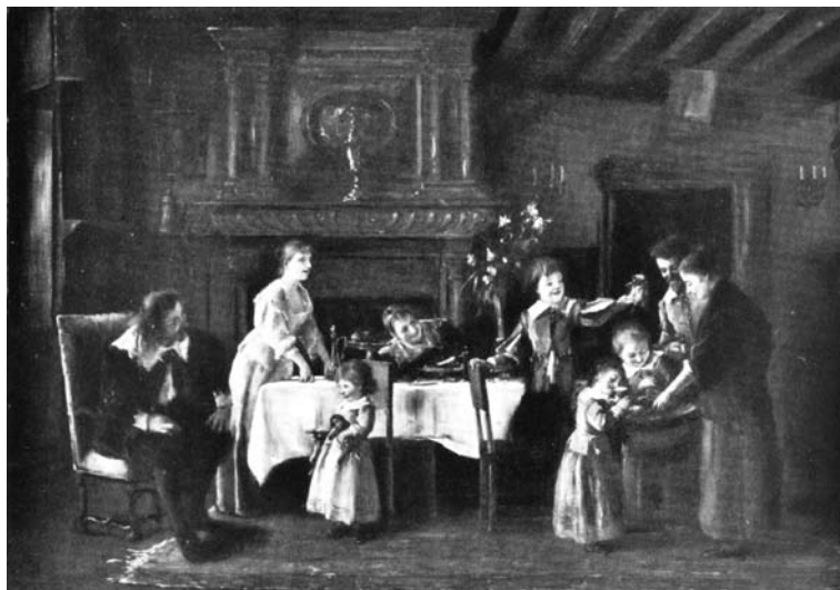
Munkácsy Mihály – Rippl-Rónai József: Kölyökkutyák III., 1890 körül, (a kutyák anyja nélkül) olaj, fa, 95,5×128 cm Békéscsaba, Munkácsy Mihály Múzeum tulajdona