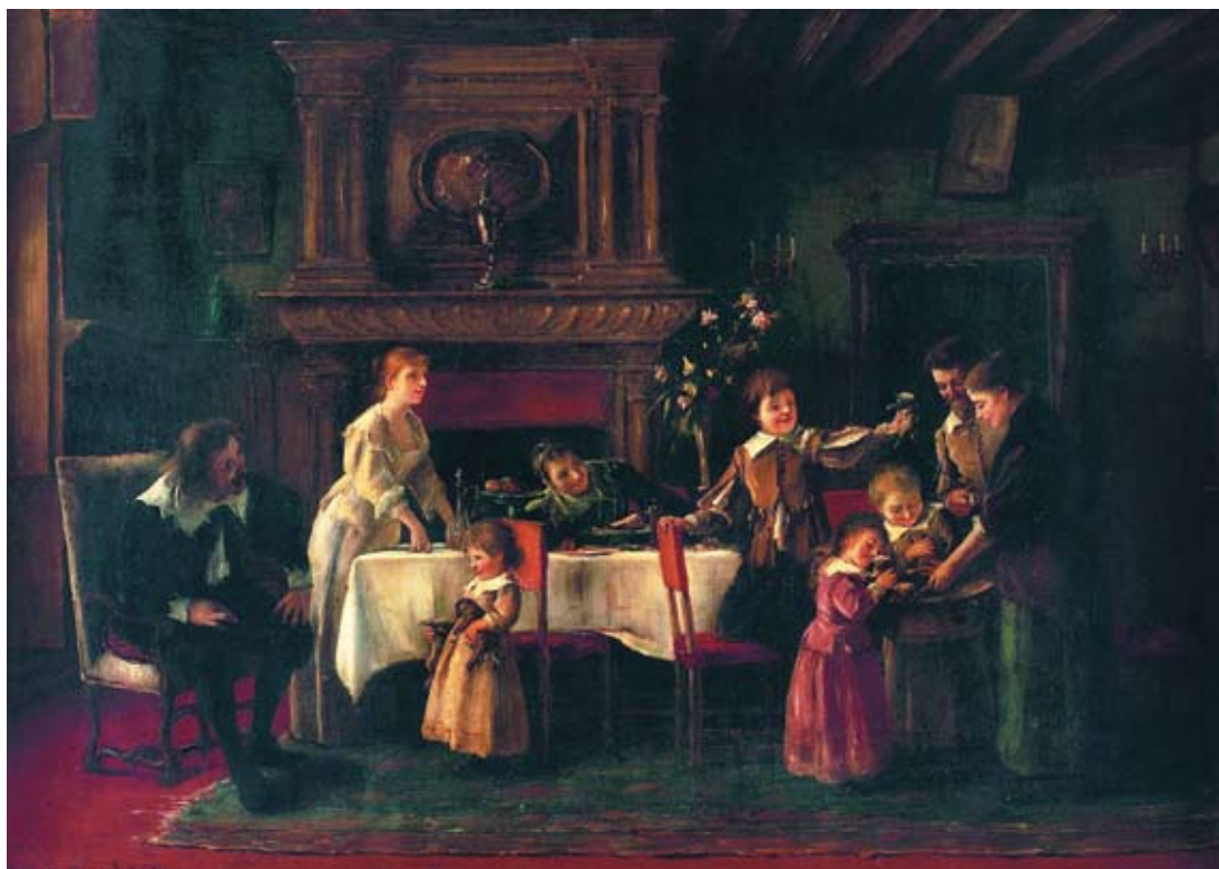
Munkácsy Mihály – Rippl-Rónai József: Kölyökkutyák III., 1890 körül, (a kutyák anyja nélkül) olaj, fa, 95,5×128 cm Békéscsaba, Munkácsy Mihály Múzeum tulajdona