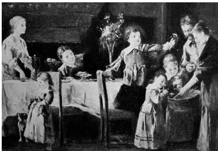
Részlet. Munkácsy Mihály egyik tanítványa: Kölyökkutyák II. 1890 körül, olaj, fa, 70,5×101,5 cm (aukció-méret 73×108 cm) SZM. Chorin Ferenc letéte. Ernst aukció XLIII.