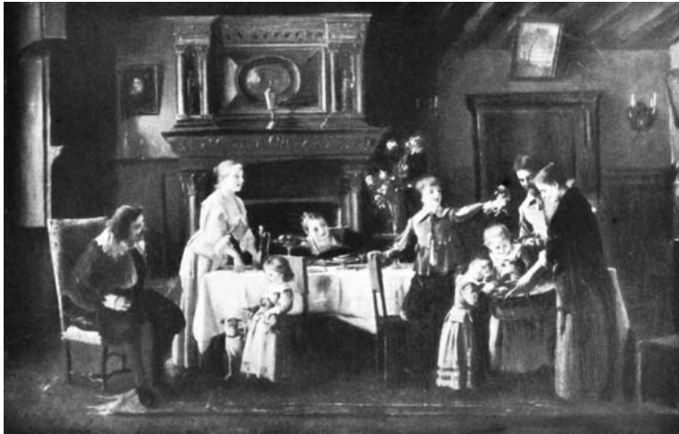
Munkácsy Mihály: Kölyökkutyák I. 1890 körül, olaj, fa, 131×200 cm Azelőtt Cullock – gyűjtemény, London. Wawra Au. Bécs, 1923. máj. 14-15., 15. sz. Repr.: Sedelmeyer, 115.