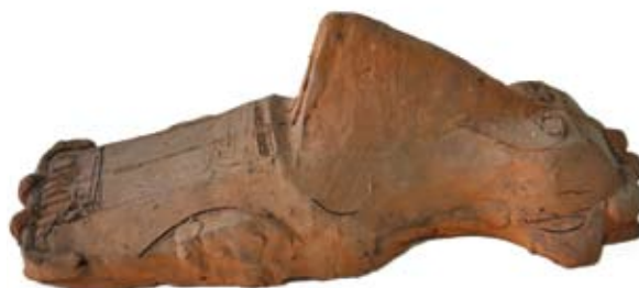
19. ábra: Autó-formaterv (Fekvő fej) terrakotta, 11×9×30 cm