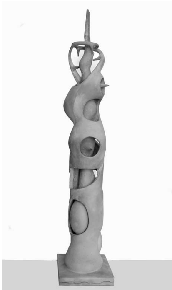
6. ábra: Vízparti formák VI., 1964 k. gipsz, 97×14×19 cm