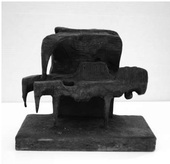
9. ábra: Pieta variáció I. viasz, 13×18×8,5 cm