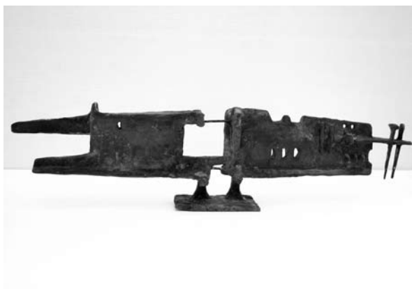
13. ábra: Falu-variáció II. 10,5×43×4,5 cm