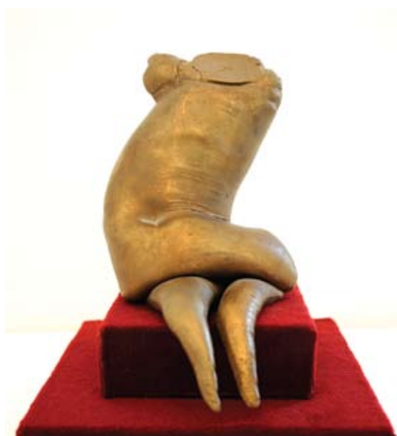
20. ábra: Trónus, 1972. 22×18×13 cm