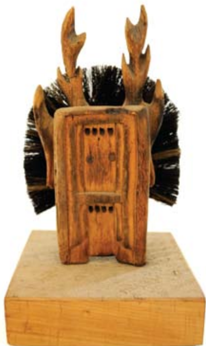
18. ábra: Az ellített, 1973. fa, kefe, fém csavar hajlított drót, 15×9×3,5 cm