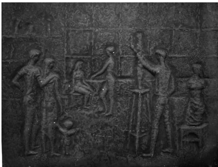
1. ábra: Műteremben, 1955-1960 k. rész domborítás, 46,5×59 cm