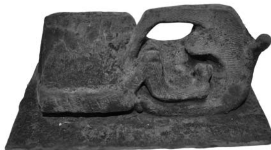
8. ábra: Fekvő nő gyermekkel 5×13×5 cm