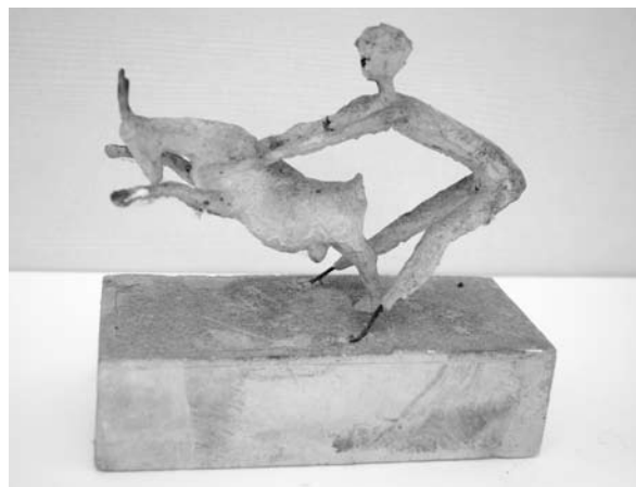
3. ábra: Fiú kecskével, 1963. gipsz, 11×17×6 cm