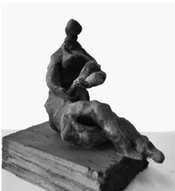
7. ábra: Anya gyermekkel I. viasz, 9×10×5,5 cm