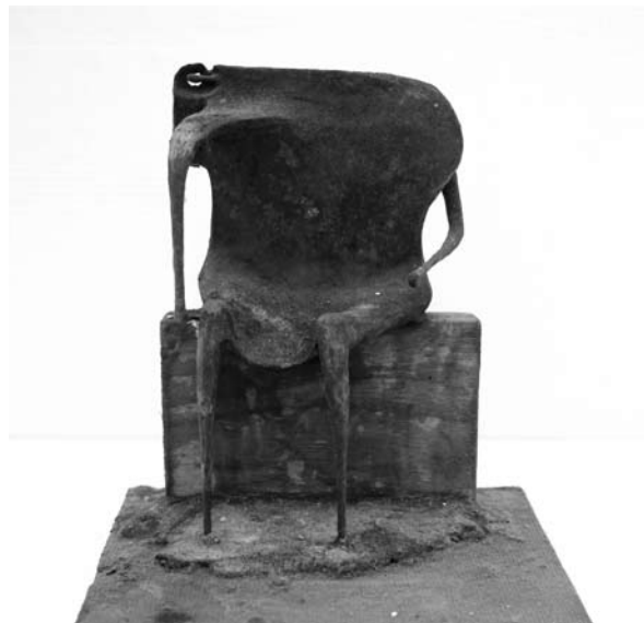
10. ábra: Ülő asszony viasz, 16,5×11×7 cm