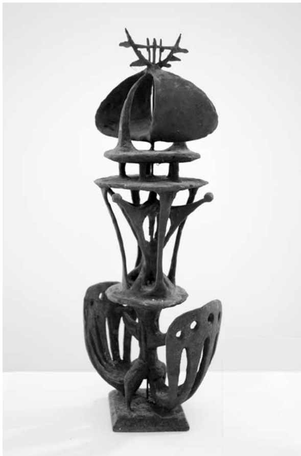
5. ábra: Vízparti forma II., 1963. viasz, 34×12×9 cm