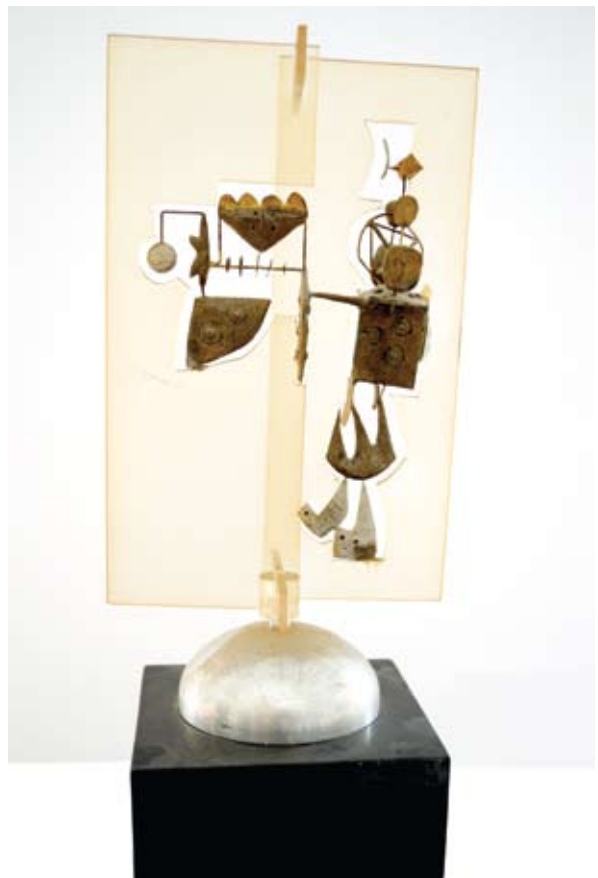
17. ábra: Gyermekrajzok I. 1975 k. fém, plexi, rézdrót, viasz, 30×16×9 cm