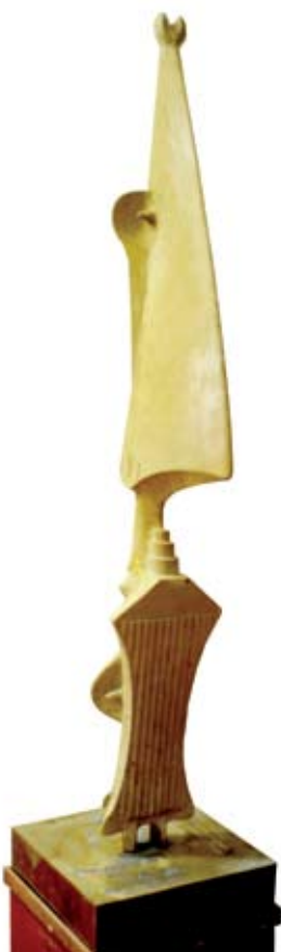
21. ábra: Bálvány, 1974 k. műanyag, 166×24×37 cm.