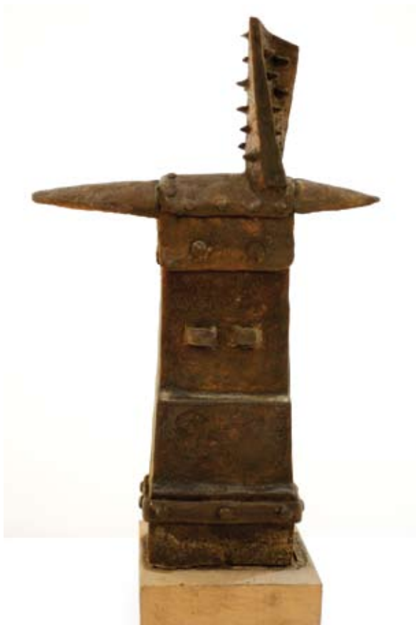
16. ábra: Kereszt, 1971. viasz, 30,5×20×5 cm