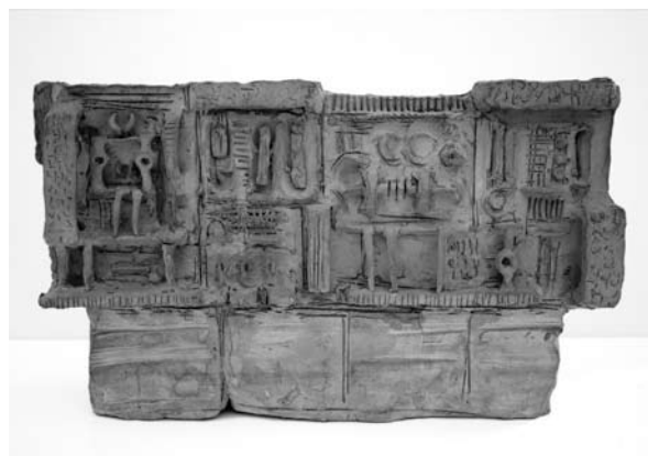
14. ábra: Kétoldalas relief , 1965. terrakotta, 21×39×10 cm