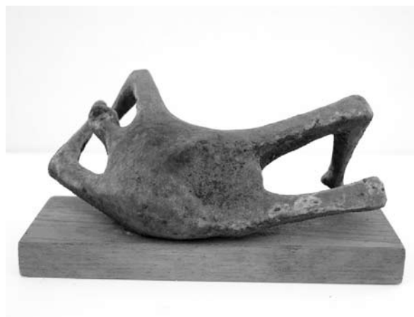
4. ábra: Fekvő alak, 1963 k. viasz, 6,5×15,9 cm