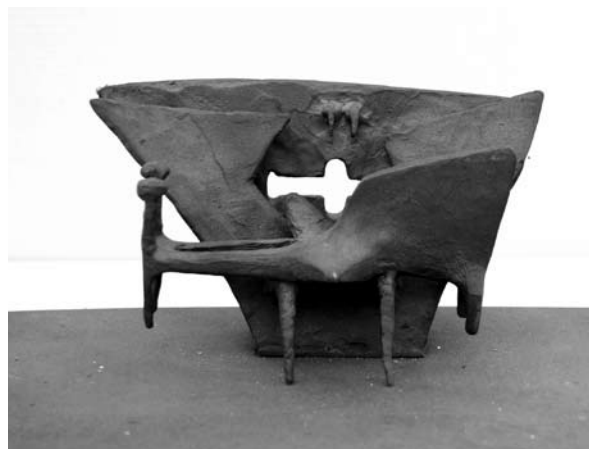
12. ábra: Acél Pieta , acél, 1967. 8×14×6 cm