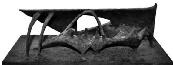
11. ábra: Fekvő forma III. viasz, 5,5×19×4,5 cm