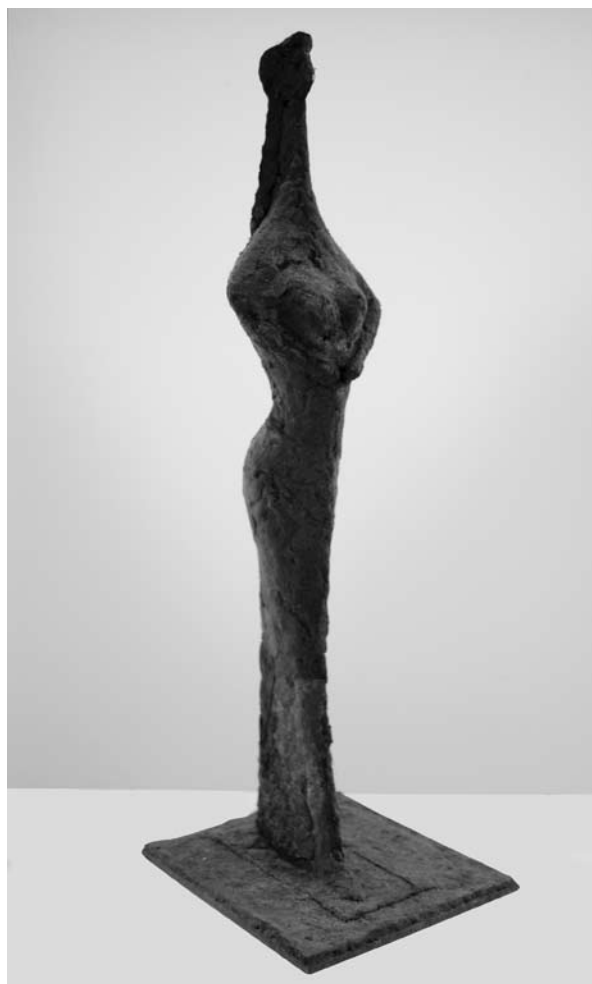
2. ábra: Koré viasz, 38×8,5×8 cm