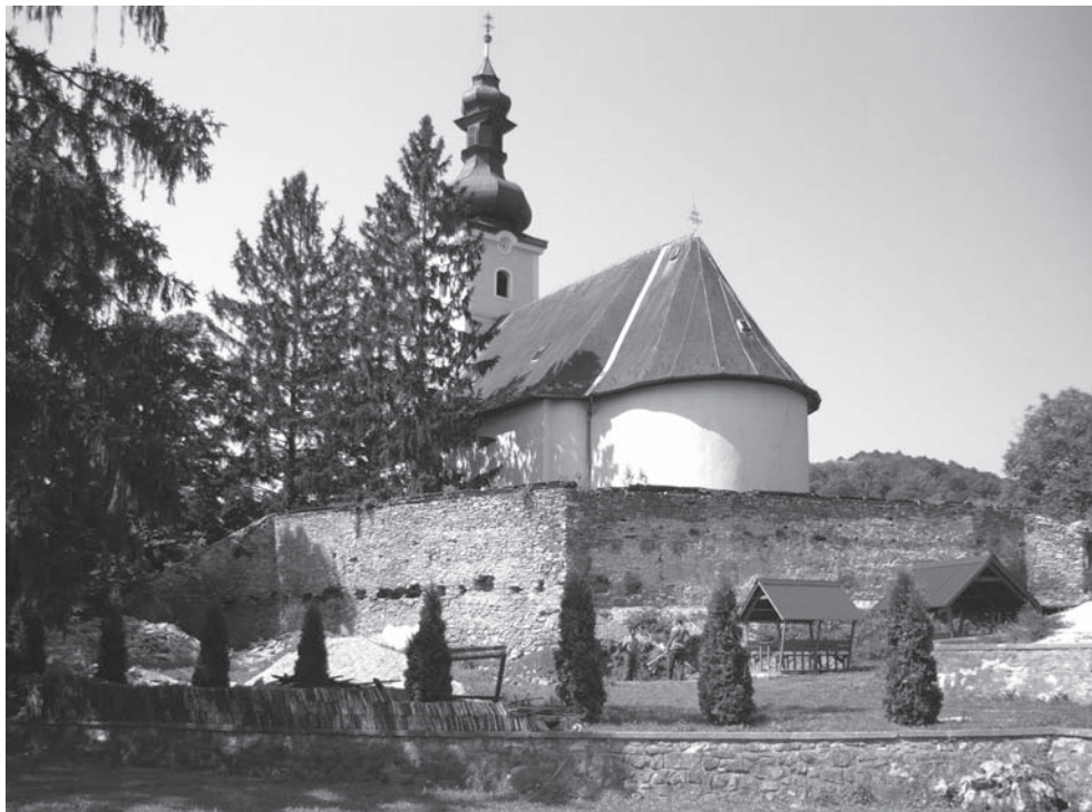
1. kép: A templom és a körítőfal északkeleti-keleti oldalának külső képe, rajta a keleti és délkeleti támpillérek

A Bódvaszilás központjában lévő dombra épült az a barokk kori római katolikus templom, amelynek omladozó körítőfalát 2010 óta állagmegóvó és különböző fokú rekonstrukciós munkálatokkal kívánják megőrizni. Ennek első fázisával párhuzamosan, kizárólag az erődített fal mentén folytak a kis felületű régészeti kutatások, amely során sikerült némileg árnyaltabbá tennünk, és bővítenünk eddigi ismereteinket a településről, templomának történetéről (1. kép).