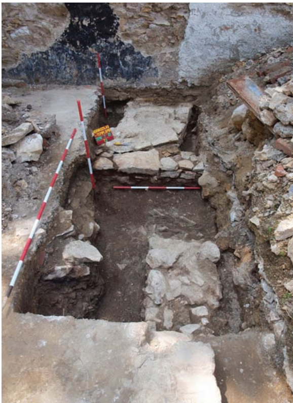
5. kép: A feltételezett középkori falak a délkeleti területen