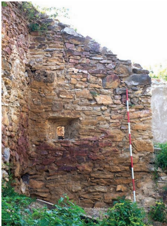
4. kép: Az északi védmű keleti lőrése a külső oldalról