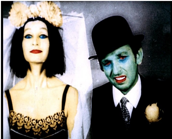
A szex fogságában.

A szex fogságában stilisztikai ereje a filmes technikák káprázatos kombinációjában rejlik. Ismételten rá lehet mutatni Urbański egyik filmjére, amelyik megihlethette Antonisz. Az, ahogyan utóbbi használta az élőszereplős felvételt, megfelel az idősebb kolléga által alkalmazott módszernek az Édes ritmusokban (Słodkie rytmy, 1965), amely méhrajok valós idejű felvételének, a vibráló formáknak, a közvetlenül a filmszalagra égetett és pecsételt mintáknak a meghatározhatatlan kollázsa. Lényegében ugyanezt a technikát – nevezetesen a már előhívott élőszereplős felvételeket tartalmazó filmre történő közvetlen beavatkozást – alkalmazva Antonisz bizonyos módon összekuszálta a visszaélést a mechanikus másolattal, és az eredetiség auráját állította helyre. Az az égető szükséglet, hogy megszabaduljon a sokszorosítás átkától (ami elég szokatlan vágy egy filmkészítő részéről), már Antonisz legkorábbi filmjeiben is látható volt, és végső soron ez vezette el őt radikális fényképellenes fordulatához. Amint egyik interjújában fogalmazott: