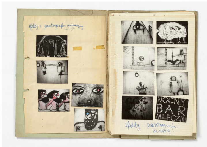
Az Ötlekönyvek lapjai a Fóbia című filmhez. Forrás:

Antonisz jegyzetei, vázlatai és kivágott kollázsai töltenek meg) szóló elemzéseiben találunk, továbbá Lukasz Wojtyszko megjegyzései a rendező filmjeinek nyelvészeti rétegeiről. Sajnálatos módon a könyv csak kevés példányszámban jelent meg, így jelenleg gyakorlatilag lehetetlen beszerezni.