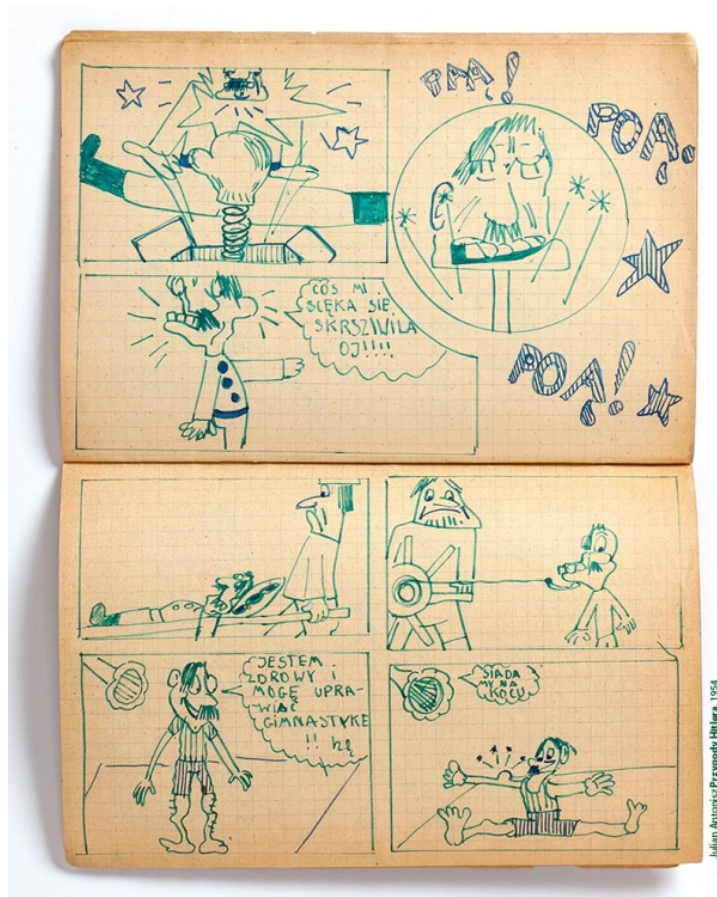
Hitler kalandjai.

Az antoniszi életmű hazai és nemzetközi fogadtatása közötti aránytalanság a kritikai és a tudományos szakirodalomból egyaránt kiviláglik. Az angol nyelvű animációtörténeti könyvek szerzői bizonyosan nem tekintik Antonisz filmjeit azon lengyel animációs kánon szerves részének, amely nagy elismerésre tett szert a nemzetközi kritikusok és tudósok körében. Közülük egyet felütve, tünetértékű, hogy Giannalberto Bendazzi Animation: A World History című könyvének második kötete huszonnégy oldalas fejezetet szentel a lengyel animáció 1960 és 1991 közötti időszakának, de Antonisz neve csak egy lábjegyzetben szereplő rövid szövegben jelenik meg ezzel a megjegyzéssel: „Egyértelműsítés szükséges a kutatók számára” [a szerző itt arra utal, hogy két Antoniszczak volt, Julian és testvére, Ryszard – a szerk.] (Bendazzi 2016: 245). Az egyetlen jelentős angol nyelvű kiadvány a témában az Antonisz: A technológia számomra a művészet egy formája című kiadvány fordítása (Kordjak Piotrowska és Homely 2013), mely nemcsak művészeti könyvként értékes, amely tele van a kiállításon bemutatott műtárgyak (főleg Antonisz találmányainak és kézírásos feljegyzéseinek) nagyméretű másolataival és részletes leírásaival, hanem tudományos forrásként is releváns.