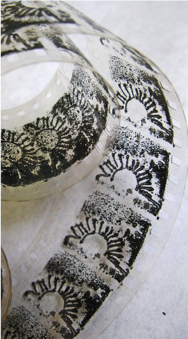
Közvetlen animáció A nap című filmben.