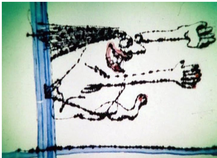
Fény az alagútban (1986).

hogy a szokásos narrátorhangot sokkal absztraktabb hangdizájnnra cserélte, melyen a filmszalag borotvával előidézett zaját és sercegését halljuk (Antonisz ehhez természetesen a saját, Unikális borotvapenge hangkovács / Dźwięnkownica unikalna żyletkowa nevű szerkentyűjét használta), jelentősen meghatározta a két film alaphangulatát, ami sokkal sötétebb és fárasztóbb, mint Antonisz többi rövidfilmjéé, közelebb áll azokhoz a kísérleti filmekhez, amelyeket a félig üres művészmozikban szoktunk nézni.