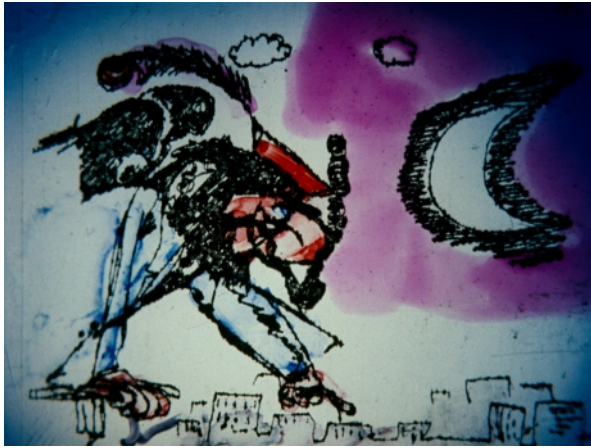
Lengyel Filmkrónika No. 9. (1985)