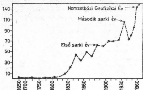
2. ábra. Mágneses obszervatóriumok száma az utóbb 300 évben

valamennyi résztvevő az oroszországi Központi Fizikai Obszervatórium (a mai Arktisz és Antarktisz Kutatóintézet elődje, Leningrád) archívumába küldte. A tudományos hasznosítást megnehezítette, hogy a program lebonyolítása után az IPC 1891-ben feloszlott.