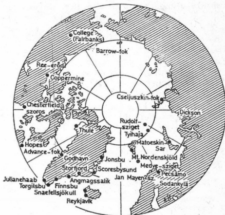
3. ábra. A Második Sarki Év állomásai. Közülük néhány már az Első Sarki Évben is működött. Ezeket külön megjelöltük

Az északi félgömbre eső állomásokat a 3. ábra mutatja be. Számuk jóval kisebb 41-nél. A déli félgömbön tervezett állomások közül pedig csak kettő működött a teljes észlelési időszakban, 1932. aug. 1. és 1933. szept. 1. között. A mágneses obser-