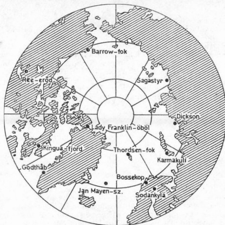
1. ábra. Az Első Poláris Év állomásai az Északi-sark körül

szerelését határozták el. Az Északi-sarki körüli állomásokat az 1. ábra mutatja be. Végül — a Déli-sarki körüli két állomással és a Dijmphna dán kutatóhajóval együtt — 15 állomás működött.