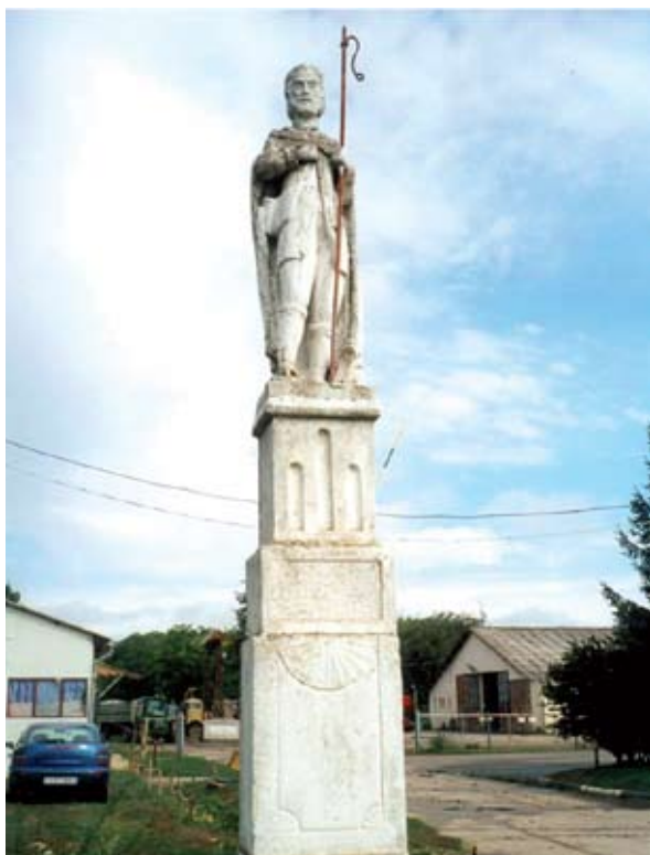
3. ábra: Szent Vendel szobra. Szentgáloskér, Somogy m. Lukács László felvétele, 2013