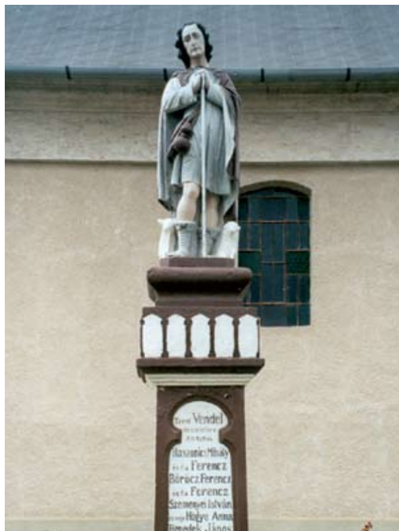
4. ábra: Szent Vendel szobra. Ráksi, Somogy m. Lukács László felvétele, 2013