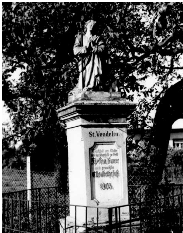
14. ábra: Szent Vendel szobra. Szulok, Somogy m. Sási János felvétele, 1978. A Rippl-Rónai Múzeum néprajzi fotótára. Lelt. sz.: 22.780