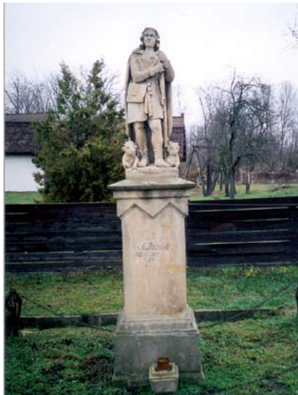
6. ábra: Szent Vendel szobra. Buzsák, Somogy m. 2004