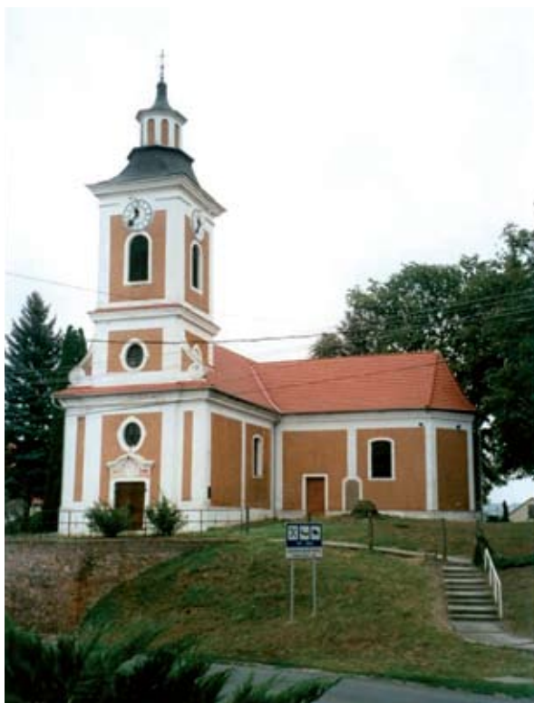
1. ábra: Sárkány Boldogasszony temploma a hozzá- épített Szent Vendel-kápolnával. Mernye, Somogy m. Lukács László felvétele, 2013