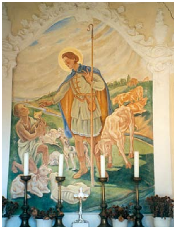
11. ábra: A Szent Vendel kápolna oltárképe Göllében. Lukács László felvétele, 2013