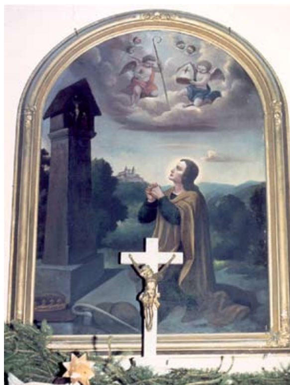
2. ábra: Oltárkép a mernyei Szent Vendel- kápolnában. Lukács László felvétele, 1989