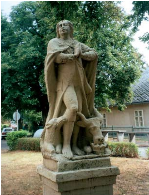
5. ábra: Szent Vendel szobra. Igal, Somogy m. Lukács László felvétele, 2013