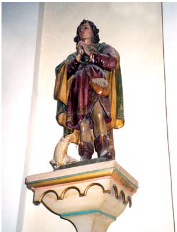
7. ábra: Szent Vendel szobra a törökkoppányi templomban. 2013