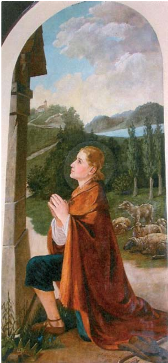
9. ábra: Szent Vendel főoltárkép a pusztaszemesi templomban.