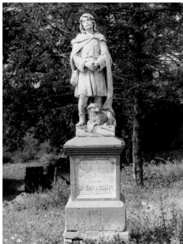
13. ábra: Szent Vendel szobra. Lad, Somogy m. Sási János felvétele, 1978. A Rippl-Rónai Múzeum néprajzi fotótára. Lelt.sz.: 22.714