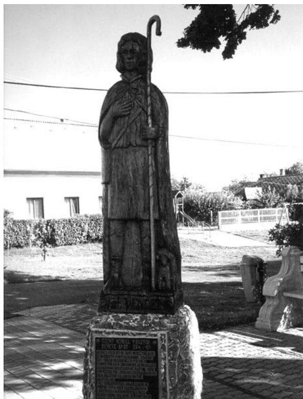
12. ábra: Szent Vendel faszobra Göllében, állították 2011-ben. Lukács László felvétele, 2013