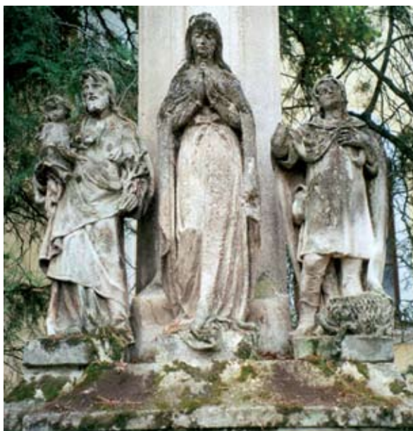
8. ábra: Szentháromság-szobor rajta mellékalakként Szent Vendel. Törökkoppány, Somogy m. Lukács László felvétele, 2013