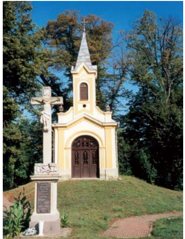
10. ábra: Vendel-kápolna (1928) feszülettel (1750). Gölle, Somogy m. Lukács László felvétele, 2013