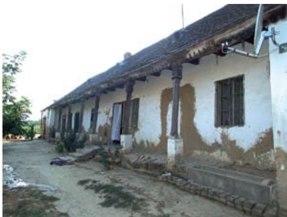
3. ábra. 19. sz. végi lakóház, istállóval (Fonó, Petőfi utca)

Figure 3: Detached house with a shed at the end of the 19th century (Fonó, Petőfi Street)