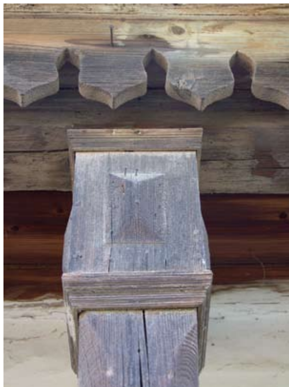
4. ábra. Faragott oszlop (Fonó, Petőfi utca) Figure 4: Carved column (Fonó, Petőfi Street)

Figure 3: Detached house with a shed at the end of the 19th century (Fonó, Petőfi Street)