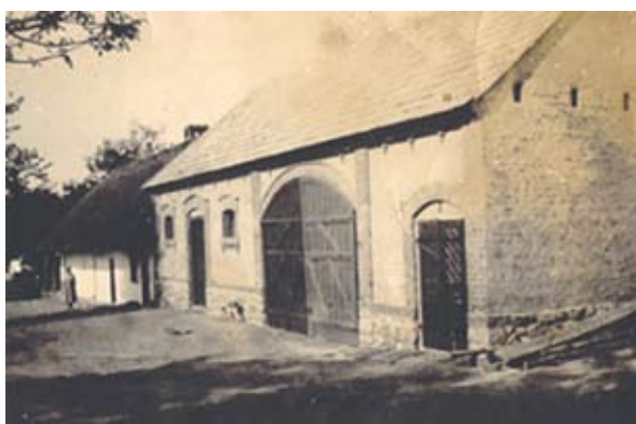
5. ábra. Istállós-pajta, és a zsúpos ház kontrasztja (Kisgyalán, Árpád utca)

Figure 5: Contrast of a thached house and a shed (Kisgyalán, Árpád Street)