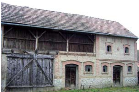
6. ábra. Emeletes magtár (Kisgyalán, Árpád utca) Figure 6: Multi-storey barn (Kisgyalán, Árpád Street)

Figure 5: Contrast of a thached house and a shed (Kisgyalán, Árpád Street)