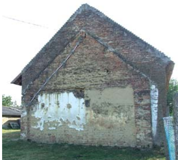
12. ábra. Istállón látható a lebontott ház sziluettje (Fonó, Petőfi utca) Figure 12: The silhouette of the remains of a house on the shed's wall (Fonó, Petőfi Street)