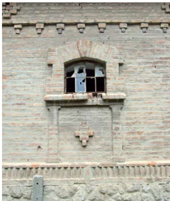
15. ábra. Ablak díszítés (Fonó, Petőfi utca) Figure 15: Window decoration (Fonó, Petőfi Street)

A gazdasági épület nagyobb rangot kapott, mint a ház ezt bizonyítja, hogy az istállók tetőgerinc magassága több esetben magasabb a házénál. A fotó, az istálló hangsúlyozott szerepét bizonyítja, a lebontott ház tetőszerkezetének nyomai, jól láthatóak a gazdasági épület csúcsfalán (12. ábra).