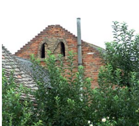
13. ábra. Istálló oromfal a kőműves monogramjával (Fonó, Petőfi utca) Figure 13: Gable of a stable with the builder's initials (Fonó, Petőfi Street)