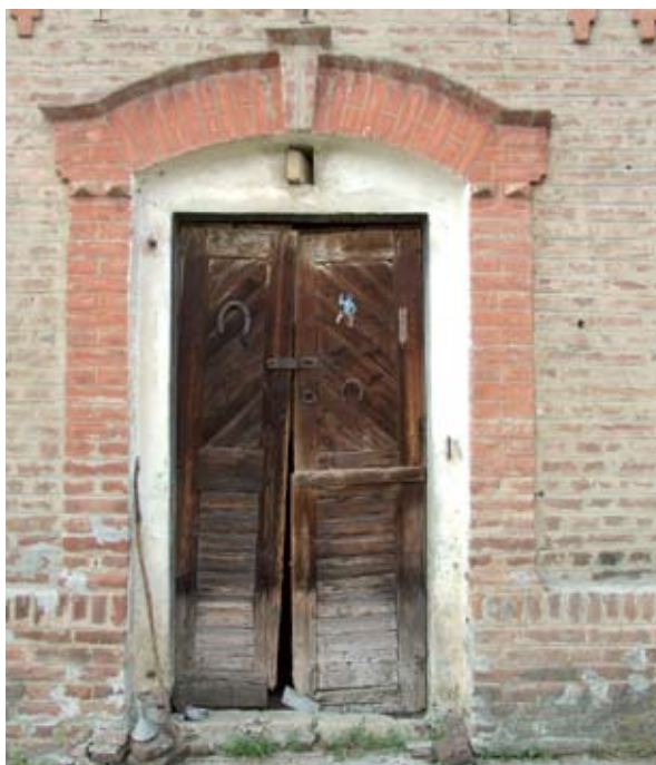
14. ábra. Hármasszattú ajtó (Fonó, Petőfi utca) Figure 14: Tripartite door (Fonó, Petőfi Street)