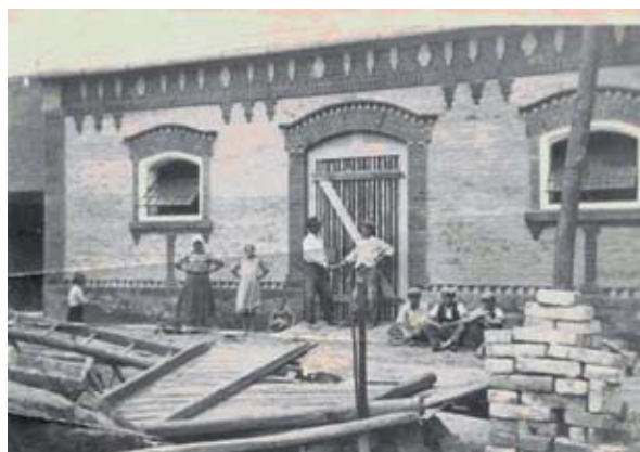
10. ábra. Az új istálló átadása (Fonó, Petőfi utca) Figure 10: Opening of a new shed (Fonó, Petőfi Street)