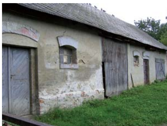
7. ábra. Kettős istálló (Kisgyalán, Árpád utca) Figure 7: Twinstable (Kisgyalán, Árpád Street)