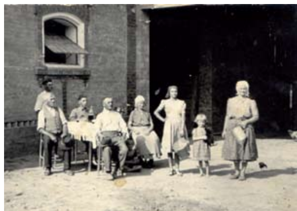
11. ábra. Az új istálló ünneplése (Fonó, Petőfi utca) Figure 11: Celebration of the new shed (Fonó, Petőfi Street)