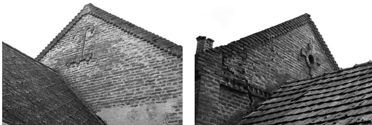
16.-17. ábra. Oromdász (Fonó, Petőfi utca) Figure 16-17: Gable decoration (Fonó, Petőfi Street)

land tulajdonos. 38 Az 1900-ban magtár uradalmi épületnek épült, ezért a lebontás szele megérintette, amikor a II. világháborút követően a volt gazdasági cselédek számára az uradalom gazdasági épületei lebontásra kerültek. A kiskisgyaláni gazdák szépen megfogalmazott levelet írtak a magtár érdekében, amely levél ma a Nagyberki Levéltárban található. A levélben az a kérelem olvasható, hogy a gazdaközönség számára a magtárra szükség van, más épületeket bontsanak le lakóépület építése céljára. Kicsit több mint félszázad elteltével, bontás nélkül a magtár maga vált lakóépületté.