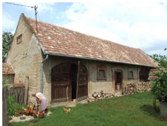
8.-9. ábra. Istállós-pajta (Fonó, Petőfi utca) Figure 8-9: Shed (Fonó, Petőfi Street)