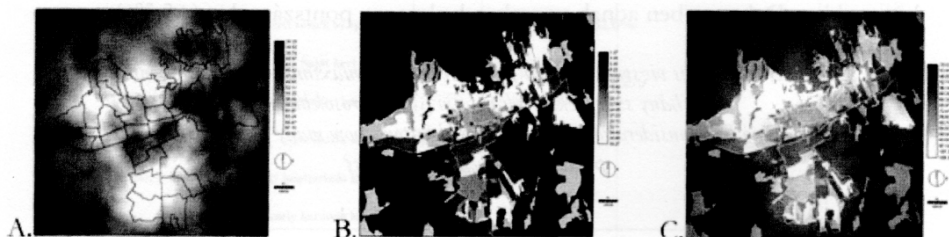
Figure 3: Different types of settlement qualifying layers – on the example of Pécs (see explanation in the text)

3. ábra: Különböző típusú településminősítő rétegek - Pécs példáján (magyarázatot ld. a szövegben)