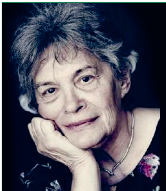
1. ábra: Dr. Polcz Alaine (1922–2007)

alkotások. Nehéz témákat érintett, tabukat döntött le. Folyamatosan hirdette, hogy vissza kell adni az embereknek a haldoklás és a halál méltóságát. Hivatása során ledöntötte a fájdalom, a szenvedés, a haldoklás és a halál tabuját. Hirdette, hogy a halált sem húzni, sem sürgetni nem kell. A halál az élet természetes része, el kell fogadni (URL1).