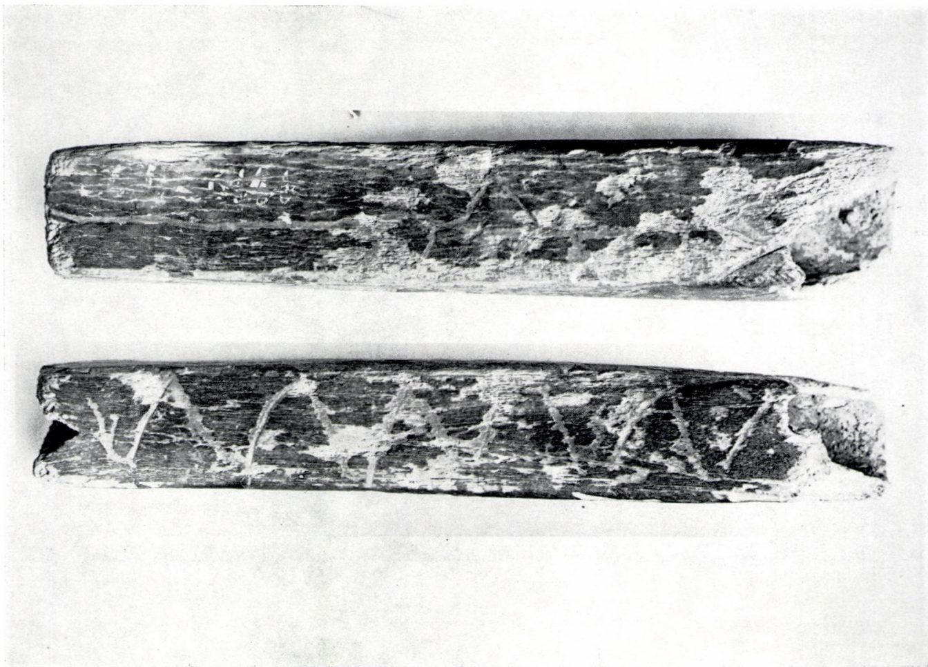
1. kép. A jánoshidai tűtartó 1. (alul) és 4. (felül) oldala