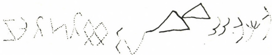
6. kép. A jánoshidai tőtartó 4. oldalán bekarcolt felirat átmásolással készült rajza

A két iq/qi betűtől balra és ferde tengelyük irányában egy v-alakú írásjel látható = {}^1l . Ez után (azaz balra) egy függőleges zeg-zug vonalra emlékeztető betű vehető ki, amely négy vonásból áll. Ez az {}^0nč írásjel egyik változata lehet. Eddig tartanak a többé-kevésbé világosan kivehető írásjelek. A fényképet nagyítóval megvizsgálva azonban azt a benyomást nyerhetjük, hogy még ezek után is állott néhány az előzőknél sokkal gyengébben bekarcolt betű. Lehetséges, hogy itt az írásjelek előkarcolásával van dolgunk s ezeket a betűket később nem vették be véglegesen. Összesen hét írásjel sejthető ezen a részen s közülük