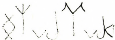
4. kép. A jánoshidai tűtartó 2. oldalán bekarcolt felirat átmásolással készült rajza

kisebb, mint a 3. oldalon olvasható rovásjeleké. Összesen 8 rovásjel vehető ki itten. Jobbról balra haladva ismét egy háromszögalakú jel, azaz qī , amelynek függőleges jobboldali szára azonban eltűnt a tűtartó falának elkopása következtében. A 2. jel világosan olvasható ʰb/ʰw . Jól kivethető függőleges szára és alsó, balra néző hurokja. A 3. jel v-alakú, bal szára jól látszik, jobb szára elmosódott. Ez a jeniszeji feliratokban az ʰl jele. A 4. betűnek elsősorban a feje vehető ki felül a 2. oldal szélénél. Ez fordított kettős w-re emlékeztet, amelynek a közepéből függőleges szár nyúlik lefelé — ez inkább csak sejthető, mint látható. A fej alapján azonban a jel biztonsággal azonosítható a jeniszeji feliratok ʰγ betűjével. Ezután függőleges betűszár nyomai vehetők ki, amelyek alul mintha balra néző körben végződnének. Így az írásjel leginkább ʰb/ʰw betűnek értelmezhető. Utána ugyanolyan magasságban, mint az első ʰb után, még egy v-alakú jel látszik, amely szintén ʰl lehet. Ezután az oldalfelület felső szélén egy írásjel v-alakú feje vehető ki, amelyet függőleges vonal oszt ketté. Függőleges alsó szára erősen kitérődedett. Ez az orchoni-jeniszeji rovásírás ič/ij írásjele. Az ič után még egy rombusz-alakú betű maradványai figyelhetők meg, amelynek meghosszabbított oldalai keresztezik egymást. Ez a jeniszeji feliratokban az e betű.