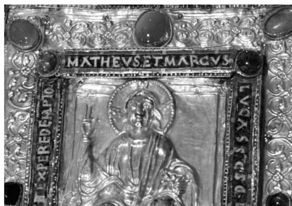
10. ábra. Sioni/Sitteni könyvtábla (1140-1150, Trier?)

Ezek a rövidítések a Meuse/Maas-vidéki és német ötvöstárgyakon is előfordulnak. Feltűnő, hogy a betűket 1–1 tárgyon is többféle írásmóddal jelenítik meg, mintegy átmenetet képezve a maiuscula és a kurzív írásmódok között. Ugyan nem ötvöstárgy, de hasonló írásmódot találunk a pécsi székesegyház Szt. Bertalan apostolt ábrázoló relief feliratánál is. (11. ábra) Érdekes az ábrázolásmódban (szembeforduló alak, jobb