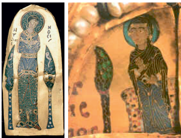
18. ábra. A Monomachos korona Alázat alakja és a Khalkuli triptichon