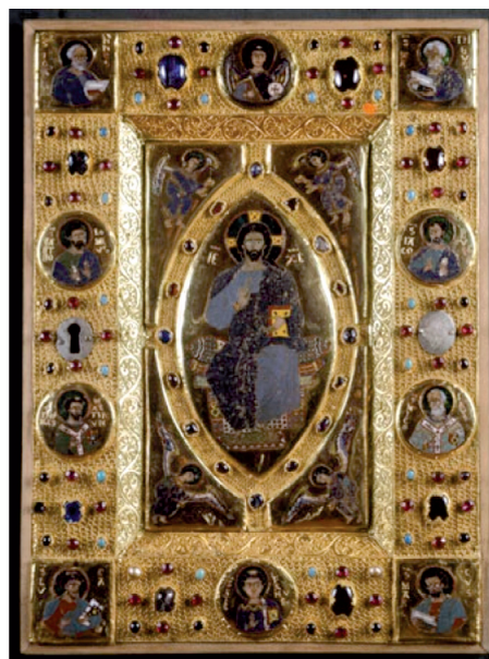
24. ábra. A capuai könyvborító Pantokrátor ábrázolása