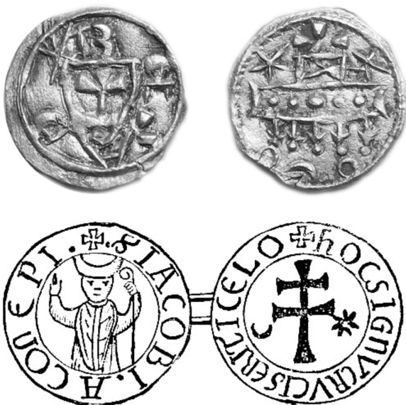
17. ábra. III. Béla dénárja 1189-1190 k. (CNH 263) és Jacques de Vitry pecsétje (1214-1225)

Nálunk II. András idejében jelenik meg ez az ábrázolásmód az uralkodói pecséteken (pl. második nagypecsétje 1216 előtt, aranybulla), ahol a király jobbján a nap, míg bal felől a hold és felette a csillag helyezkedett el. Ez az ábrázolásmód a szlavón báni dénár kettős keresztje mellett még a 13. század derekán is használatban volt. Meg kell azonban említeni ennek előzményét III. Béla 1189–90 közé datált, előlapján pajzsba foglalt kettős keresztrel ellátott dénárjában, ahol a hátlapon felül két csillag-, alul egy félholdábrázolás között talán egy stilizált koronát láthatjuk, kereszttel, függőkkel.