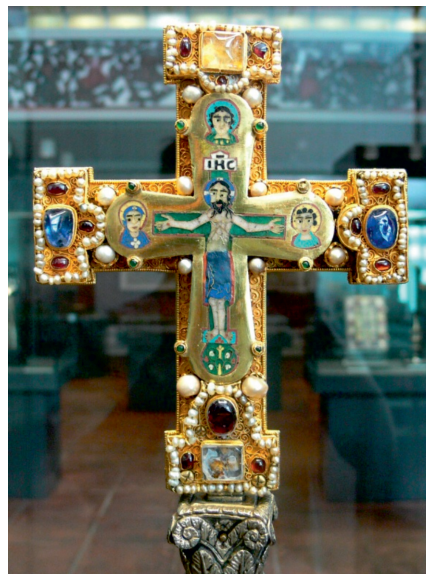
22. ábra. A Szt. Oswald korona trapéz alakú lemezei és a Welfi kereszt előlapja