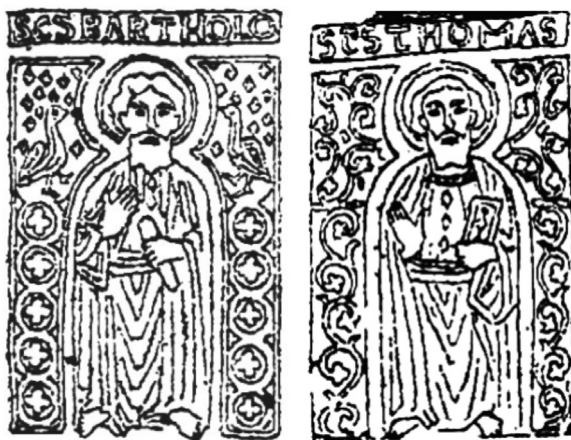
8. ábra. Szent Bertalan és Szent Tamás, Rauscher Lajos rajza

a könyvtábla felirata több ponton is párhuzamosságot mutat az apostollemez feliratával, pl. az A betű formai kialakításában, míg a ScS rövidítés mindkét emléktábla anyagában előfordul. 15 (10. ábra) A Pala d’Oro Szt. Lőrincet ábrázoló lemezén, Szt. János apostolt ábrázoló képhez hasonlóan a név előtt és után körbe foglalt négykaréjos díszítést találunk. Ugyancsak a koronán található névhez hasonló módon rövidítették János nevét a Pantokrátort övező evangélikusok ábrázolásánál. (9. ábra)