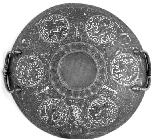
12. ábra. Az ún. Artukida tál hátoldala

mozgalmassága a korona szembenező alakjainak statikusságától idegen. A zománctechnikával díszített tál ábrázolásmódja mindenesetre utal a Bizánci birodalom és a környező királyságok közti kulturális hatásra. Hasonlóképpen a teljes díszítettségre törekedtek a Figdor gyűjtemény részét képező, aranyozott vörösréz ládika fedelén és oldalán, az indákkal és madarakkal sűrűn körülölelt 6 egész és 2 csonkított medalionba, György Ágota, Mária, Jézus, Keresztelő Szt. János, Simon, Júdas és Demeter mellképe került. Az alakok mozgalmasságát, mely a hajak ziláltságában is megnyilvánul, a ruharedők finomsága és változatossága is alátámasztja. A szentek nevének hibás, részben latin formái egy Bizáncon kívüli műhely létre utalnak. (13. ábra)