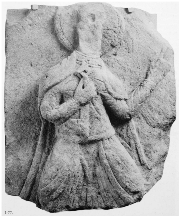
7. ábra. A somogyvári Szt. Péter relief

a könyvtábla felirata több ponton is párhuzamosságot mutat az apostollemez feliratával, pl. az A betű formai kialakításában, míg a ScS rövidítés mindkét emléktábla anyagában előfordul. 15 (10. ábra) A Pala d’Oro Szt. Lőrincet ábrázoló lemezén, Szt. János apostolt ábrázoló képhez hasonlóan a név előtt és után körbe foglalt négykaréjos díszítést találunk. Ugyancsak a koronán található névhez hasonló módon rövidítették János nevét a Pantokrátort övező evangélikusok ábrázolásánál. (9. ábra)