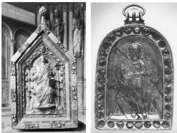
20. ábra. Szent Szerváciusz ereklyetartó (1160 k.) és 12. sz.-i kis ikon a Saint-Denis katedrális kincstárából