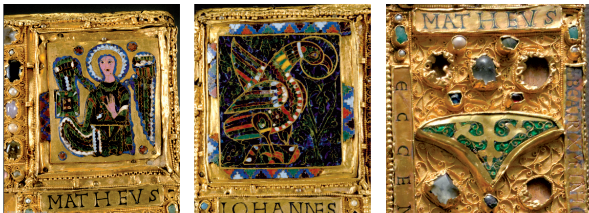
4. ábra. Máté és János evangélista és háromszög veret a Maastrichti könyvborítóról

Bár az apostollemezek teljes felülete díszített, nem egyforma módon tagoltak, van ahol a lemez keretén kívül csak a feliratot elválasztó sáv és az alak körvonala van kiemelve, míg Pál és Jakab esetében a felső, állatpárral történő díszítés hasonló módon, tagoló sávval válik el az oldalsó geometrikus díszítéstől. Szt. Péter esetében ezt az elválasztást egy egyszerű rekessel oldották meg, amelyen egyben a szárnyas állat (griff?) áll (ez a földet jelző vonal Jakab apostol esetében is megfigyelhető), míg a másik négy esetben ez is hiányzik.