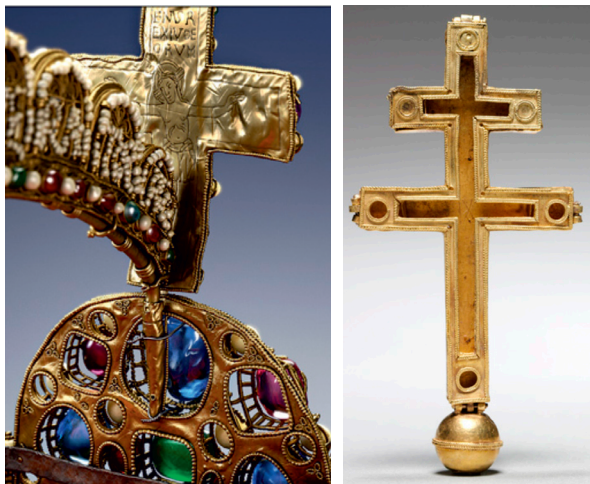
21. ábra. Kereszt a német-római császári koronáról és ereklyetartó kereszt a jeruzsálemi királyságból (12. sz.)

szítés hosszú időszakon keresztül való alkalmazása, némely apró részlet megfigyelése talán segíthet annak datálásában. A felezett szív alakú filigrán felső vége szinte teljesen kör alakban visszahajlik, míg belsejében egy vele ellentétes tájolású kisebb felezett szív alakú filigrán található alul visszahajló körrel, illetve a kettő között elhelyezkedő oldalággal. A nagyobbik filigránból felfelé egy vele ellentétes ívű, visszahajló ágacska nyúlik ki. Ez a motívum mind függőlegesen, mind vízszintesen tükrözött, ezek közé helyezték el felváltva a drágakő berakásokat. 28 Egy másik különlegessége, hogy a drótok nem folyamatosak, minden hajlított darabot egyenként forrasztották fel az alaplemezre. A filigrán kiképzésére talán legközelebbi párhuzam a székesfehérvári királysírokban talált lemezekén, a gyermek III. László sírjából (+1205) előkerült aranyleleteken és a jogar fején fordul elő. 29 A drágakövek elrendezése egyértelműen utal az Árpád-ház címerére, amelynek címerként való használata először Imre uralkodása alatt (1202-től) jelenik meg. Úgy tűnik, hogy a filigrános keret megalkotóját mindenképp a III. Béla idejében már működő ötvösműhely egyik aranyműveséhez kell kötnünk. Kovács Éva szerint a párhuzamként adódó Szt. Oswald fejereklyetartó koronájának trapéz alakú lemezei a 12. század második felében a magyar királyi udvar ajándékként került a Welfek birtokába, amit a fehér gyöngy és piros gránát keret is alátámasztani látszik. 30 A Welf kincsek részét képező, a 12. század