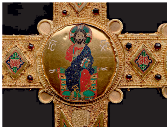
23. ábra. Az ún. Dagmar mellkereszt és a cosenzai ereklyetartó kereszt részlete