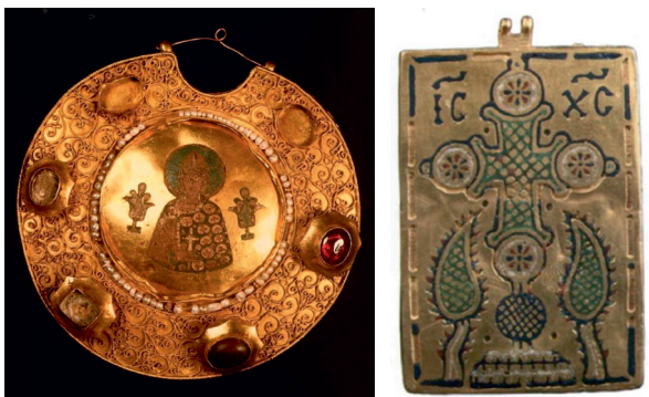
19. ábra. Növénytárral övezett szent alakja Rjazanyból és bizánci ereklyetartó hátoldala cipruspárral egy 12. századi sírból

királyság közvetítésének köszönhető, hiszen a Palermói Cappella Palatina mozaikjain már a 12. század közepén megjelennek, aminek hatása mind a velencei (Szt. Márk székesegyház kupola), mind pedig a római (S. Paolo fuori le Mura apszis) művészet felé kisugárzott.