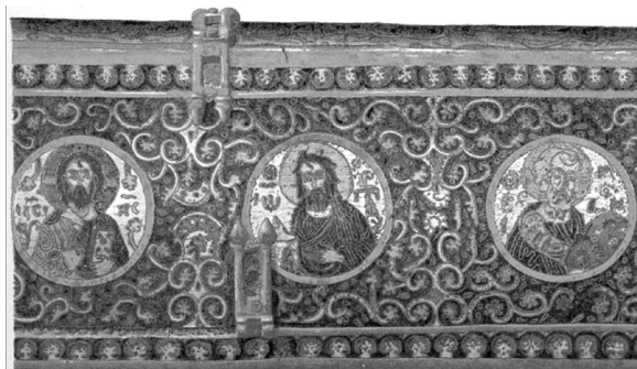
13. ábra. Láda a Figdor gyűjteményből

Hasonlóképpen a teljes felület díszítésére törekedtek a már Deér által is az apostollemezék párhuzamként megjelölt Herakleiai S. Theodore ábrázoláson. Ennek az új stílusnak talán legkifejlettebb formáját a Velencében őrzött, részleteiben plasztikusan kiképzett, a 12–13. század fordulójára keltezhető Szt. Mihály ábrázolás jelenti. Ennek, már a velencei zománcművészeire jellemző, kis drágakő vagy üveggerakásokkal díszített külső keretezése, Bizánc keresztetek általi kirablását követő időben készült.