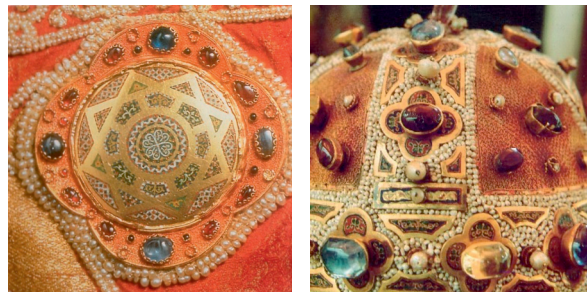
2. ábra. Zománcdíszítés II. Roger király palástjáról és részlet Konstancia koronájáról

Az apostolokat ábrázoló lemezek átmenetet képeznek az ún. cloisonné és a későbbi champlevé zománctechnikák között, vagyis a 10. századtól Bizáncban elterjedt technika mellett – mikor az arany alapba kalapált díszítést töltötték ki másodlagosan vékony drótból hajlított rekeszekkel – a 11. század végétől fokozatosan tért hódít az a megoldás, mikor a későbbi zománccal díszítendő részeket az alapba vésik, ami a rekeszek szerepét váltja ki. Így az arany alap egyes részletei a felszínen is láthatóak. Az így kialakított sávok, körök közeit általában az aranylemezre ráapplikált rekeszek díszítették. A korábbi nagyobb arany háttérrel párhuzamosan beszűkül, geometrizálódott. Ez a technikai újítás Bizáncban fejlődött ki a 11–12. szá-