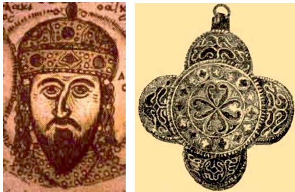
3. ábra. II. Izsák Angelosz kamelaukionnal a fején és enkolpion III. Béla sírjából

zad fordulóján, de végül a nyugati művészetben éri el csúcspontját, elég itt a Meuse-vidék fémművességére utalnunk. A vegyesen alkalmazott technológia ott sem volt ismeretlen. A 11–12. század fordulójától úgy tűnik, hogy divatba jött a korábbi zománccok újrafelhasználása, újabb zománccokkal való elegyítése, így nem egyszer a kétféle zománctechnika egyazon alkotáson jelenik meg. Ennek talán legismertebb példája a méretek és levágott zománcclemezek tanúsága szerint másodlagosan egybeszerkesztett Vercelli evangeliárium fedele. Hasonlóan másodlagosan elhelyezett elemekből készítették a Chiavennai könyvborítót, melyet feltehetően 1176-ban Cristiano de Magonza püspök ajándékozott a Chiavennai templom számára. Bár a bizánci művészetben még alapvetően a rekeszdíszítés dominál, de már megjelennek a keretezésnél, a díszítések elválasztásánál a szélesebb, alapba mélyített formák, először a császári, majd a helyi műhelyek munkáiban. A két részből álló, középen üreges homlokfüggőt két oldalt egy karikával a hajba fonták vagy a fejdíszhez rögzítették. A bizánci arisztokraták viseletét később a kijevi Rusz helyi műhelyeiben is utánozták és Kolty néven nagyon elterjedté vált. Sajátos módon, többet egybekapcsolva viselték, és a díszítésekben is megjelentek a helyi változatok, madarak, griffek, szentábrázolások. Némely darabon az eredeti gyöngykeretezés is megmaradt. 7 (1. ábra)