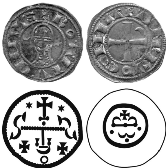
15. ábra. Antióchiai III. Bohemond (1163-1201) dénár és III. István érme (CNH 122.)

Nálunk II. András idejében jelenik meg ez az ábrázolásmód az uralkodói pecséteken (pl. második nagypecsétje 1216 előtt, aranybulla), ahol a király jobbján a nap, míg bal felől a hold és felette a csillag helyezkedett el. Ez az ábrázolásmód a szlavón báni dénár kettős keresztje mellett még a 13. század derekán is használatban volt. Meg kell azonban említeni ennek előzményét III. Béla 1189–90 közé datált, előlapján pajzsba foglalt kettős keresztrel ellátott dénárjában, ahol a hátlapon felül két csillag-, alul egy félholdábrázolás között talán egy stilizált koronát láthatjuk, kereszttel, függőkkel.