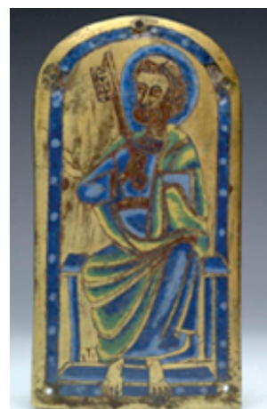
6. ábra. Szt. Péter alakja a koronáról, egy leoni ereklyetartó ládikáról és egy Maas-vidéki zománcveretről

Lajos a Szt. Bertalan lemezt Ipolyi 1886-ban megjelent könyvében. 13 (8. ábra) Nincs jogunk feltételezni, hogy ennél az apostolnál nem szerepeltették a szent előtagot. A betűk típusvizsgálatával Tóth Endre foglalkozott kimerítően, 14 így itt csak néhány további észrevételre hívnám fel a figyelmet. A betűkről általánosságban elmondható, hogy nem túlzottan konzekvens az alkalmazásuk, elég csak a többféle A, T és V betűre gondolnunk. Ugyancsak különlegesség János nevében szereplő kurzív h betű alkalmazása. Eddig talán kevésbé volt tárgyalva a ScS rövidítés, ahol a középső C fölött szerepel a ligatúra.