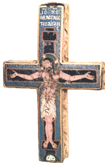
5. ábra. Ereklyetartó kereszt Thesszalónikiból

tása pedig az apostolok ívelt, kevésbé sűrű rekeszképzését idézi. (5. ábra) A kereszt ritkásabb rekeszeiben és színvilágában is párhuzamot jelent (ld. pirossal keretezett fehér keresztes zöld dicsfény). A kereszt – amelyet gyakran kötnek a Koppenhágában őrzött Dagmar kereszthez, illetve a Londonban őrzött Szt. György és Demeter ereklyetartóhoz, feltételez egy Thesszalónikiben működő műhelyet, amelynek 12–13. századi felvirágzása a Szentföld mohamedánvá válásával egyre fontosabbá váló Szt. Demeter szentély központi szerepével magyarázható. 9