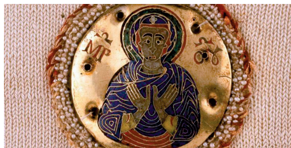
26. ábra. A Linköping mitra és a Brixeni kesztyű zománcai