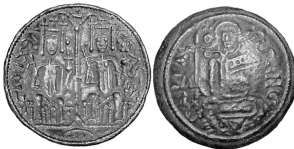
27. ábra. III. Béla réz pénzérme (CNH 98)

A bizánci művészet hatása Magyarországra a 12. században számtalan forrásból táplálkozhatott. Nem lehet figyelmen kívül hagyni a nem direkt bizánci művészeti impulzus hazai leképezését sem, itt elsősorban Antióchia, Szicília és Velence játszhatott szerepet. Az Antióchiából érkező hatás Antióchiai Ágnes (magyar nevén Anna), a bizánci császárné, Mária féltestvére, III. Béla felesége révén érkezhettek. Mivel felsorolással nem rendelkezünk, hogy valós tárgyakat köthessünk a házasságkötéshez, csak áttételes módon igazolható ez a kapcsolat. 50