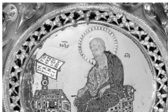
9. ábra. Pala d’Oro, Szt. Lőrinc és Szt. János felirat. 12. századi velencei munka

Ezek a rövidítések a Meuse/Maas-vidéki és német ötvöstárgyakon is előfordulnak. Feltűnő, hogy a betűket 1–1 tárgyon is többféle írásmóddal jelenítik meg, mintegy átmenetet képezve a maiuscula és a kurzív írásmódok között. Ugyan nem ötvöstárgy, de hasonló írásmódot találunk a pécsi székesegyház Szt. Bertalan apostolt ábrázoló relief feliratánál is. (11. ábra) Érdekes az ábrázolásmódban (szembeforduló alak, jobb