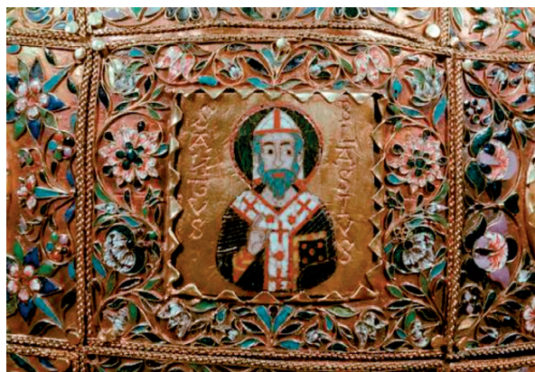
25. ábra. Szent Pál és Szent Balázs képmása a Dubrovniki kar-, és fejereklyetartóról