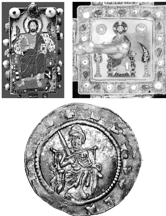
14. ábra. A Gelati és a corona latina Pantokrátora, valamint I. Ulászló pénzérme

A Nap és Hold megjelenítése a keresztre feszítés ábrázolása során, valamint megszemélyesített alakban a Maiestas ábrázolásoknál már a kora középkortól ismert, de csak a 12. század második felétől találunk párhuzamot erre az uralkodói pecséteken, pénzeken. Talán az első hold és csillagábrázolás III. Bohemond antióchiai uralkodó dénárján fordul elő, ahol az előlapi sisakos fejébrázolás két oldalán 1–1 holdat és csillagot jelenítettek meg. A hátlapi holdábrázolás sokkal inkább a sziglak körébe sorolható, és hasonlóképpen nem feltételezhetünk hasonló tudatosságot a III. István érme félhold és csillag ábrázolásánál sem. (15. ábra) Krisztus alakját övező két csillag ábrázolás Mánuel