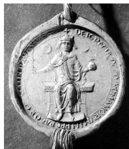
16. ábra. Oroszlánszívű Richárd (1189-99) és IV. Ottó császár pecsétje (1209) hold és csillagábrázolással

A nap és hold ábrázolás a kereszties államokhoz kapcsolódhat – amire a korábban felsorolt uralkodók kereszties hadjáratokban való aktív vagy passzív részvétele mellett alátámaszt az is, hogy Jacques de Vitry, Akkó püspöke ezt a szimbólumpárt, mind pecsétjén, mind mitráján, mind pedig hordozható oltárán megjelenítette. (17. ábra)