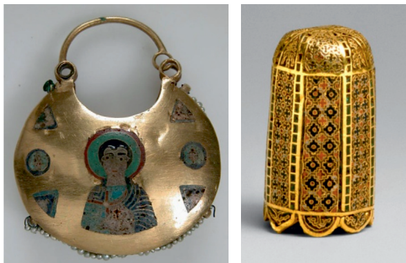
1. ábra. Bizánci és kijevei homlokfüggők és mutató hegye a 11-12. század fordulójáról)