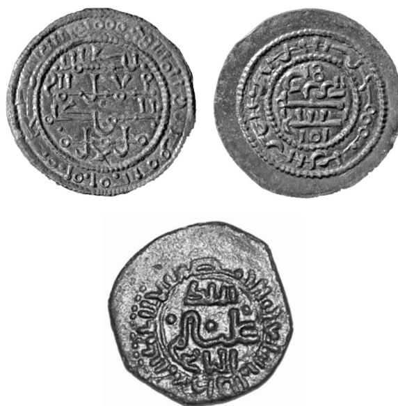
28. ábra. III. Béla rézpénze és II. Vilmos (1166-1189) follisa 57

III. Béla Esztergomban, ahol a király ötvösműhelyt is működtetett, 58 nagyszabású építkezésekbe kezdett, ahol a díszítések részben bizánci gyökerekből táplálkoztak (pl. kápolna freskó). Feltehetően az ötvösműhelyben is dolgoztak bizánci gyökerű mesterek. Bizonyosak lehetünk afelől, hogy III. Béla neveltetésével mellett a Szerémség és Délvidék 16 évig tartó bizánci fennhatósága is hozzájárult a bizánci művészet magyarországi elterjedéséhez. Úgy tűnik, hogy a 13. század elején a Bizánctól korábban megszerzett zománcokat – köztük III. Béla enkolpionjához (3. ábra) hasonló lunetta alakú lemezeket - másodlagosan is feldolgozták, elég itt a cseh Vyssi Brodban őrzött kettős kereszt alakú sztautothékára gondolnunk. 59